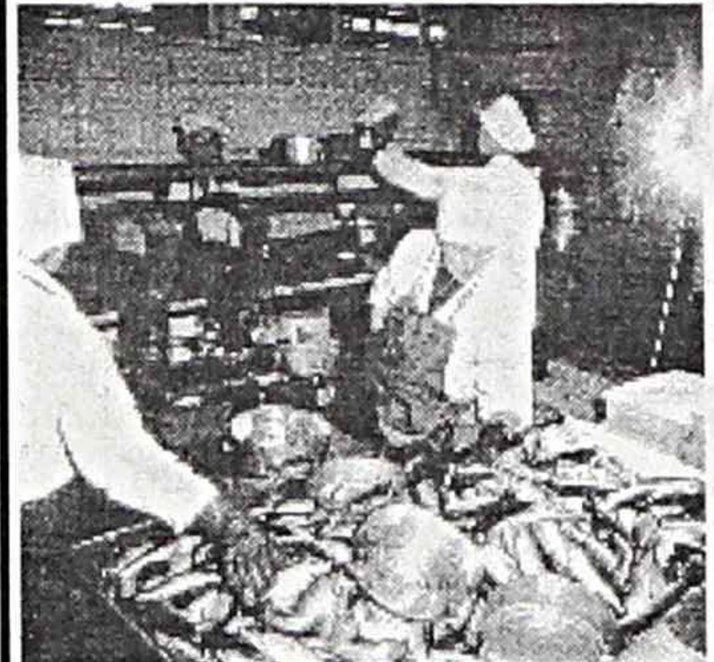
ЗА ПЯТЬ месяцев комбинат рыбной гастрономии ОАО "Находкинская БАМР" выпустил 265 тонн продукции. Это почти на 33 процента меньше по отношению к аналогичному периоду прошлого года.