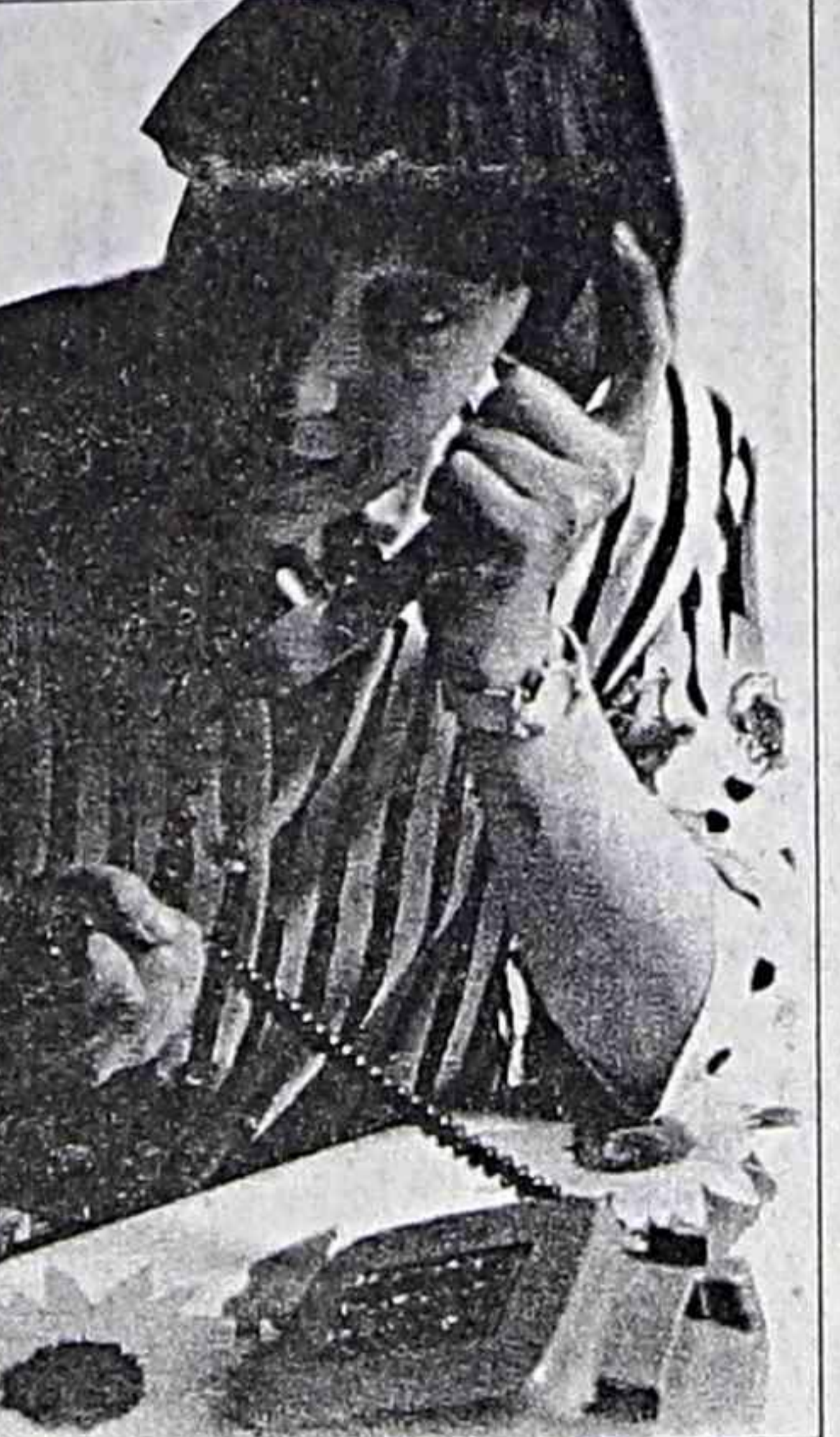
А если подобное будет повторяться постоянно? Как быть? Неужели мы не можем защитить свои права?"

Так что напомним еще раз правила пользования междугородной и международной телефонной связью, где сказано, что владелец телефона (абонент), на чье имя он записан, производит расчет за услуги связи, даже если ими воспользовались без его ведома".