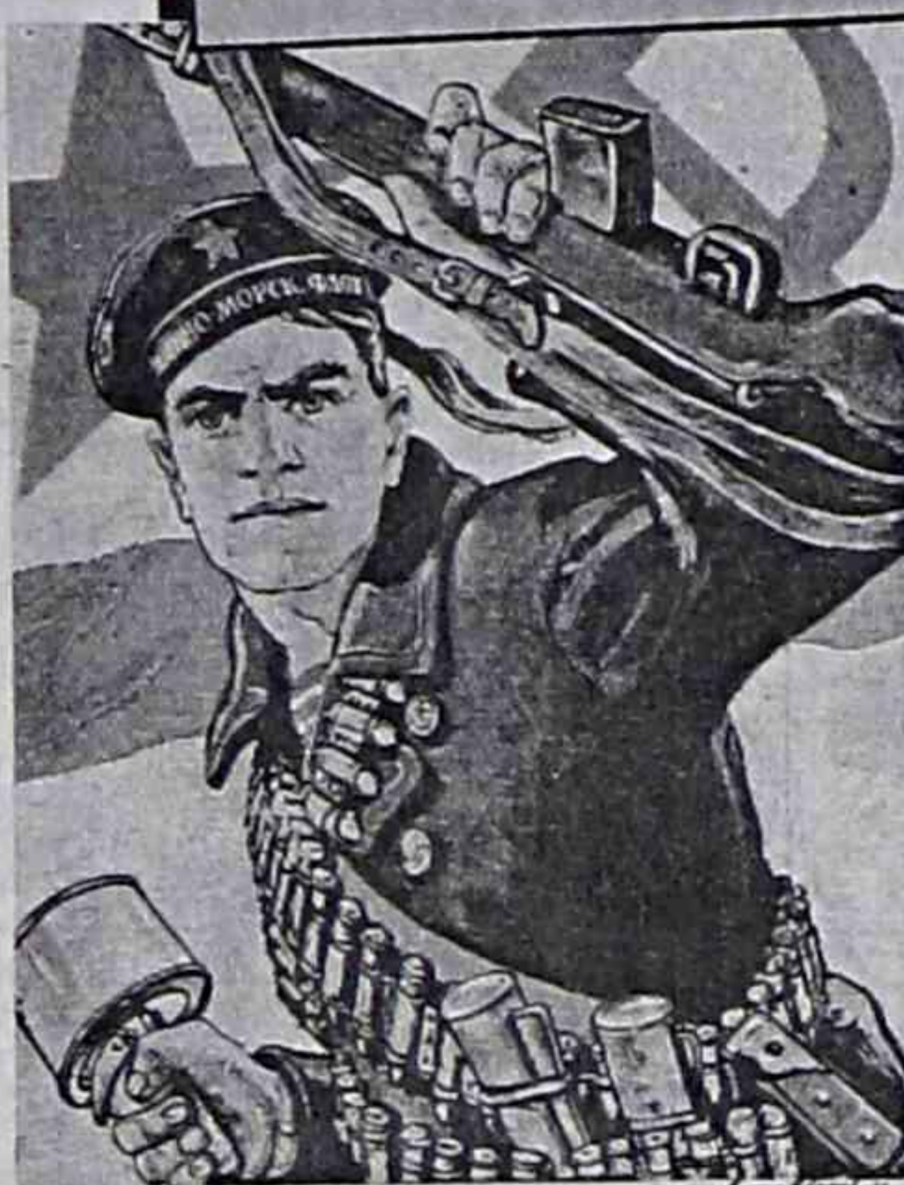
ВПЕРЕД! НА ЗАПАД!

Публикации в "НР", посвященные тем, кто выдержал суровое испытание в годы Великой Отечественной войны, не оставили равнодушными наших читателей. В редакцию звонят, пишут письма, заходят люди со своими воспоминаниями. Часть из них подготовил к печати наш корреспондент Владимир ЧЕТВЕРГОВ.