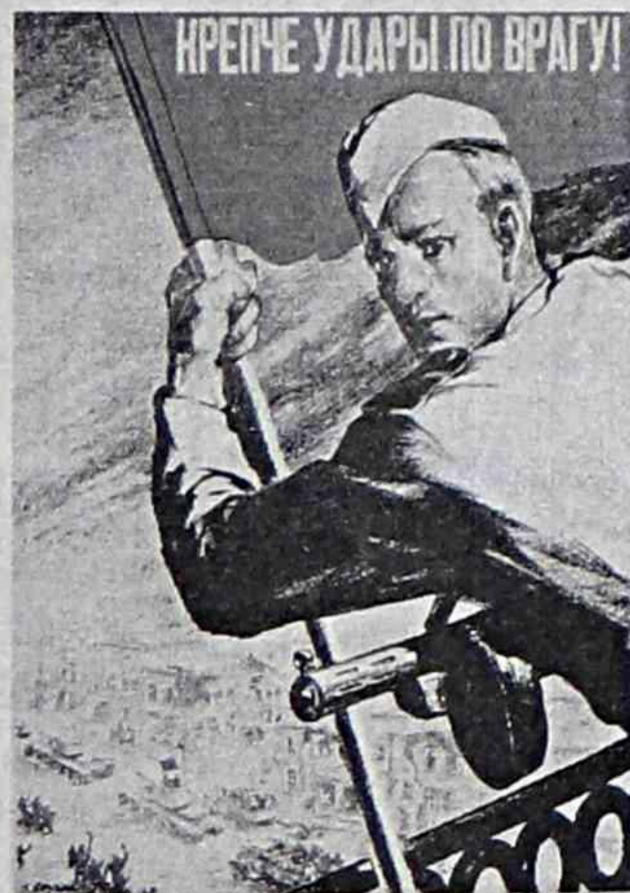
КРЕПЧЕ УДАРЫ ПО ВРАГУ!