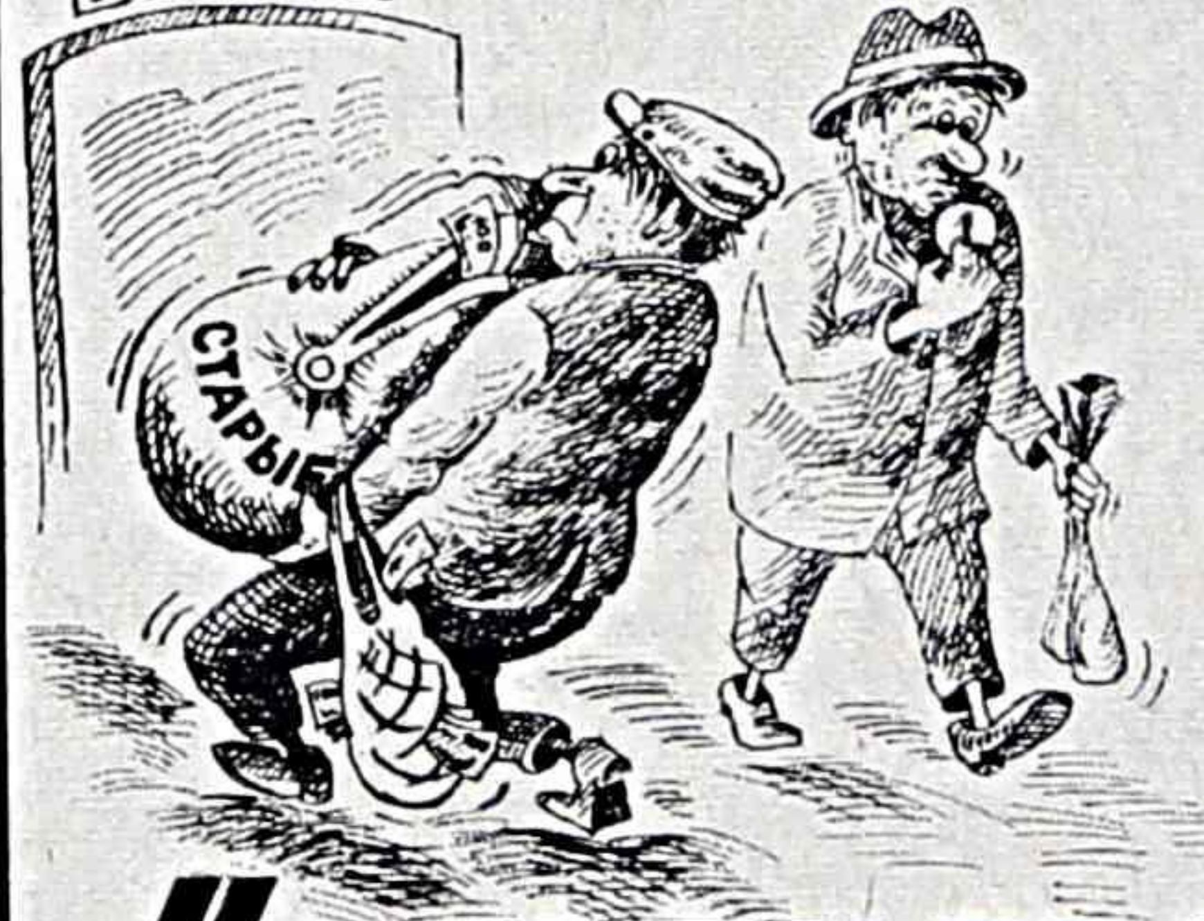
Рис. Кати Львовой.

Ольга ЧИКИЛЬДИНА. НА СНИМКЕ: на занятии Лера Марчук.