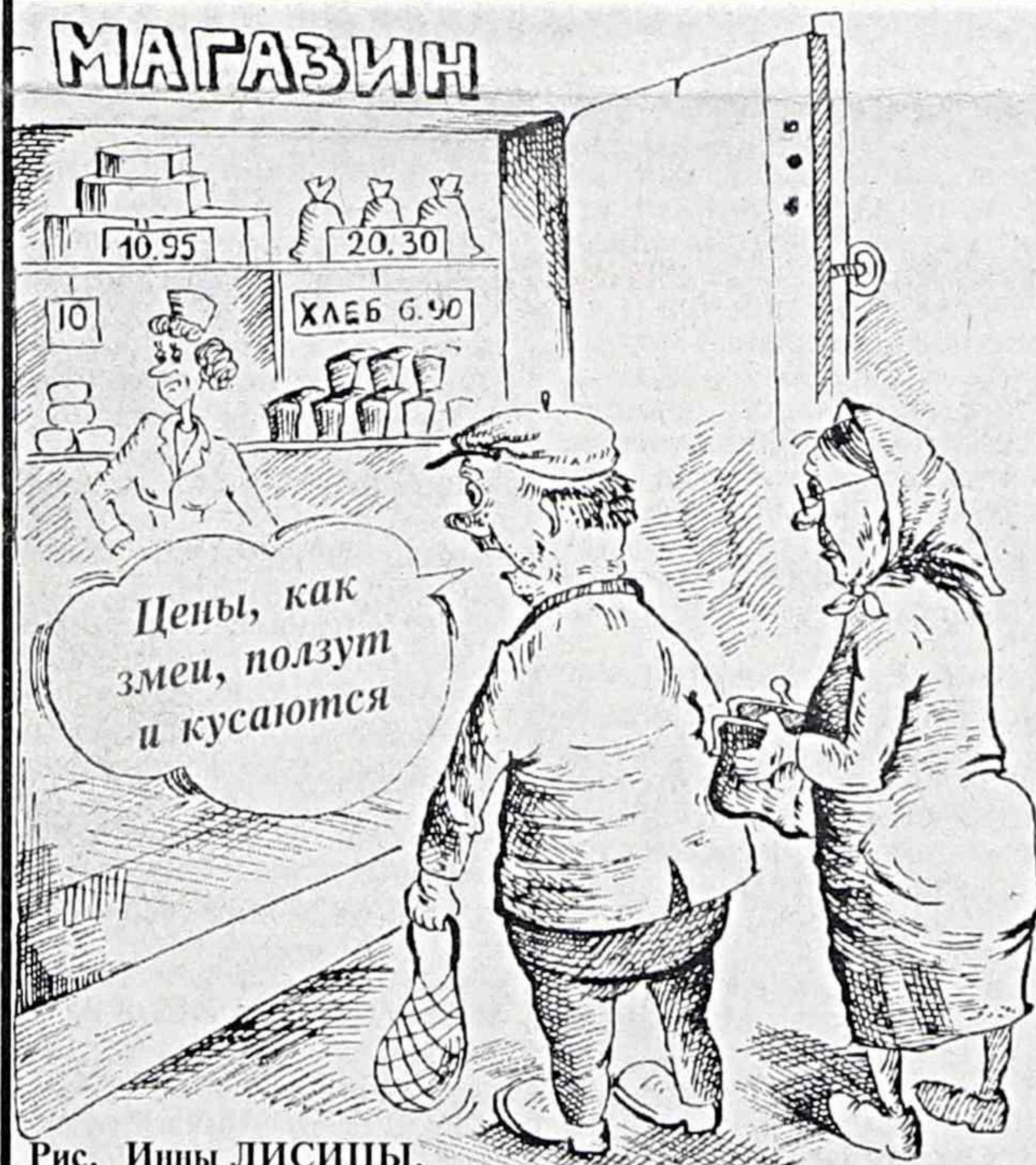
Рис. Ины ЛИСИЦЫ.

"ВЧЕРА было по три, а сегодня по пять" - цены в магазинах меняются по такому немудреному принципу, который вряд ли можно назвать экономическим. Подсчитали - прослезилась: предстоящее с апреля повышение пенсий и зарплаты бюджетников уже сегодня съедает идущая инфляция. По самым скромным обывательским подсчетам, рост курса доллара, повышение цен на продукты, топливо, товары и услуги с начала года составили в среднем не менее 10 процентов. В некоторых случаях они превышают эту планку и достигают тех самых 20 процентов, которые нам обещают добавить со всенародного Дня смеха. Получается, никакого повышения зарплаты и пенсий фактически не произойдет. Более того - в предстоящие два месяца потребительские цены, судя по темпам, вырастут на 30-40 процентов.