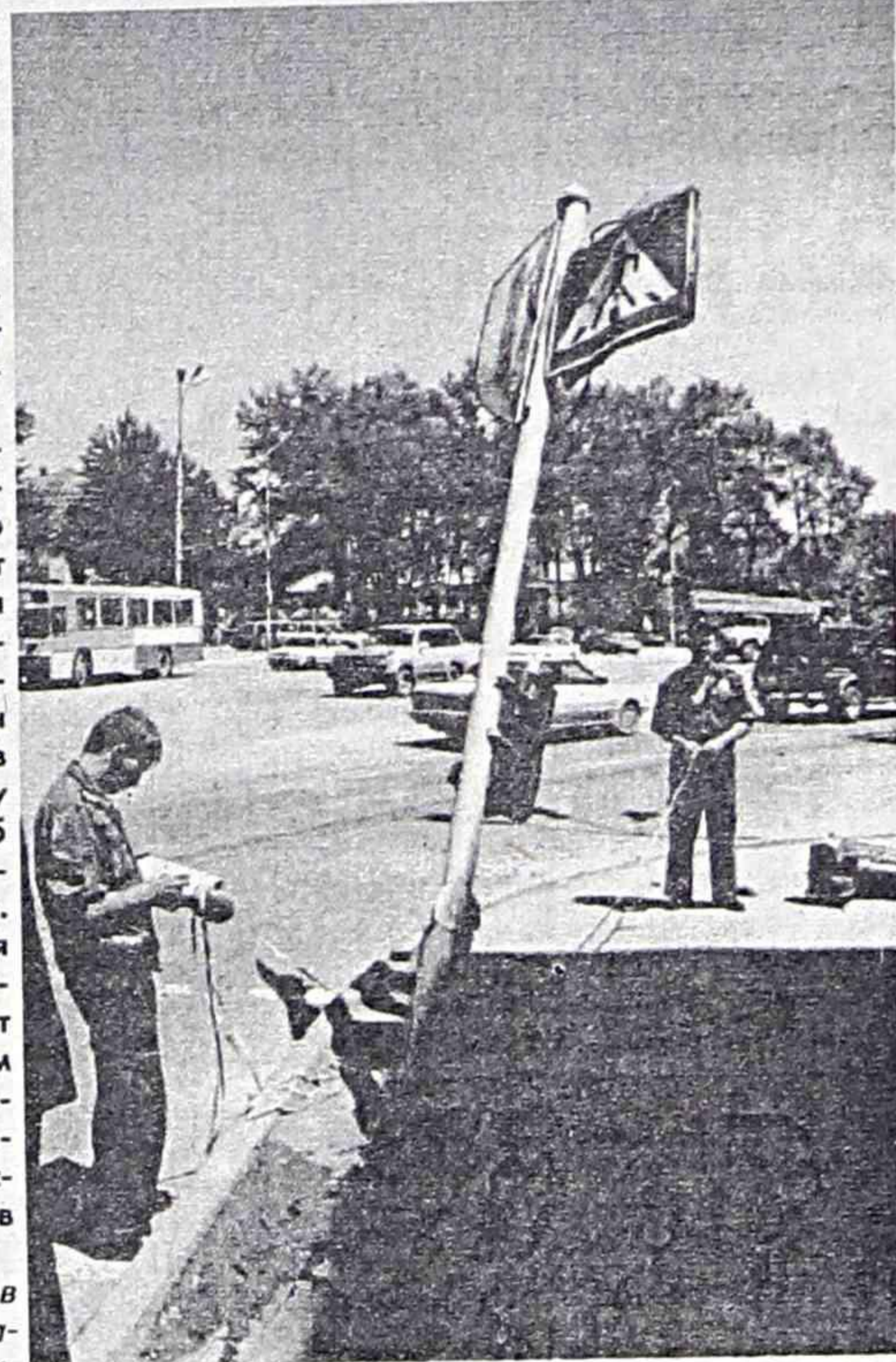
Сотрудник ГИБДД проверяет документы у водителя.

- В Находке около 80 тысяч машин. Отечественных среди них единицы. Надеемся, что законодатели учтут наше географическое