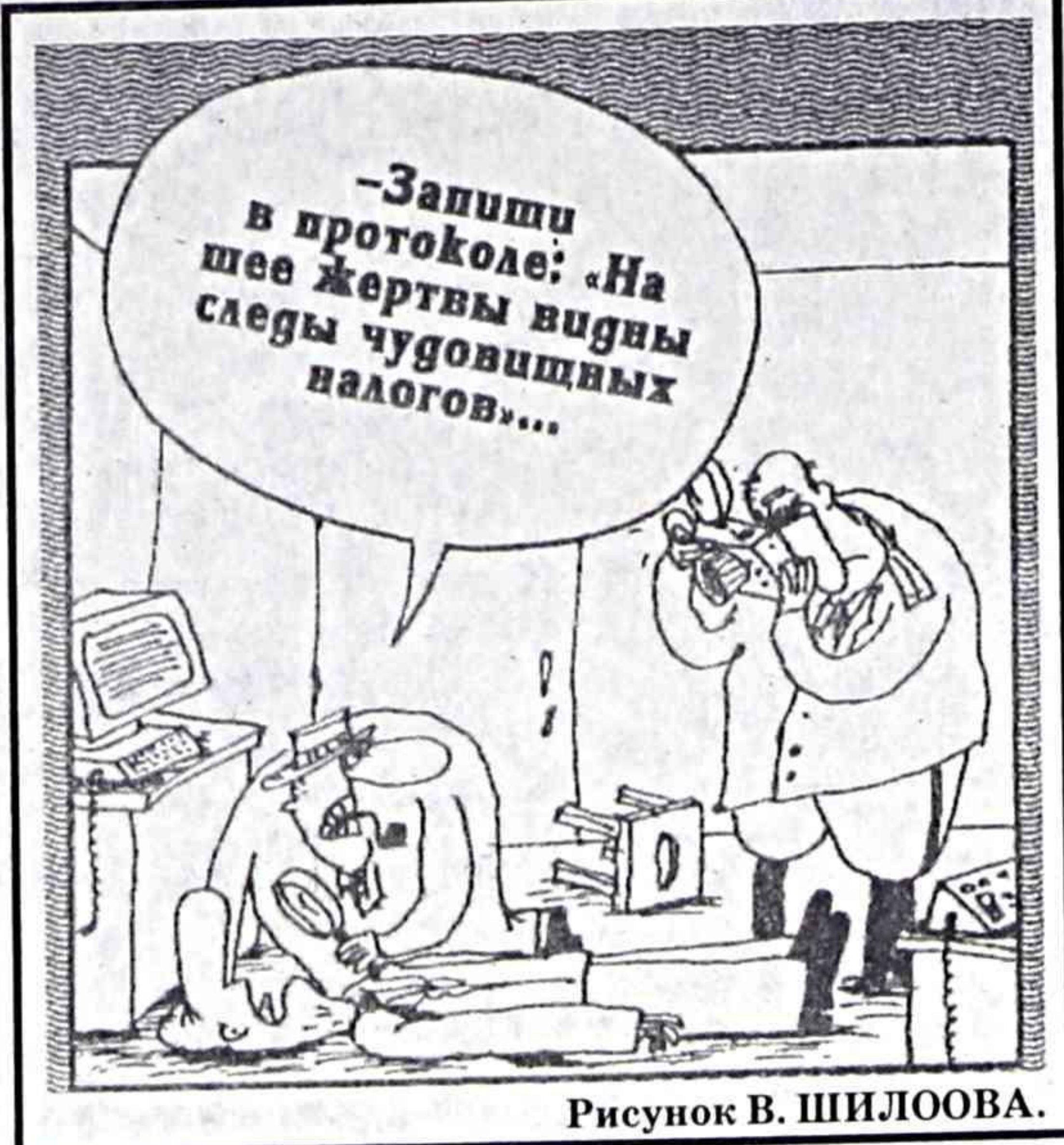
Рисунок В. ШИЛООВА.