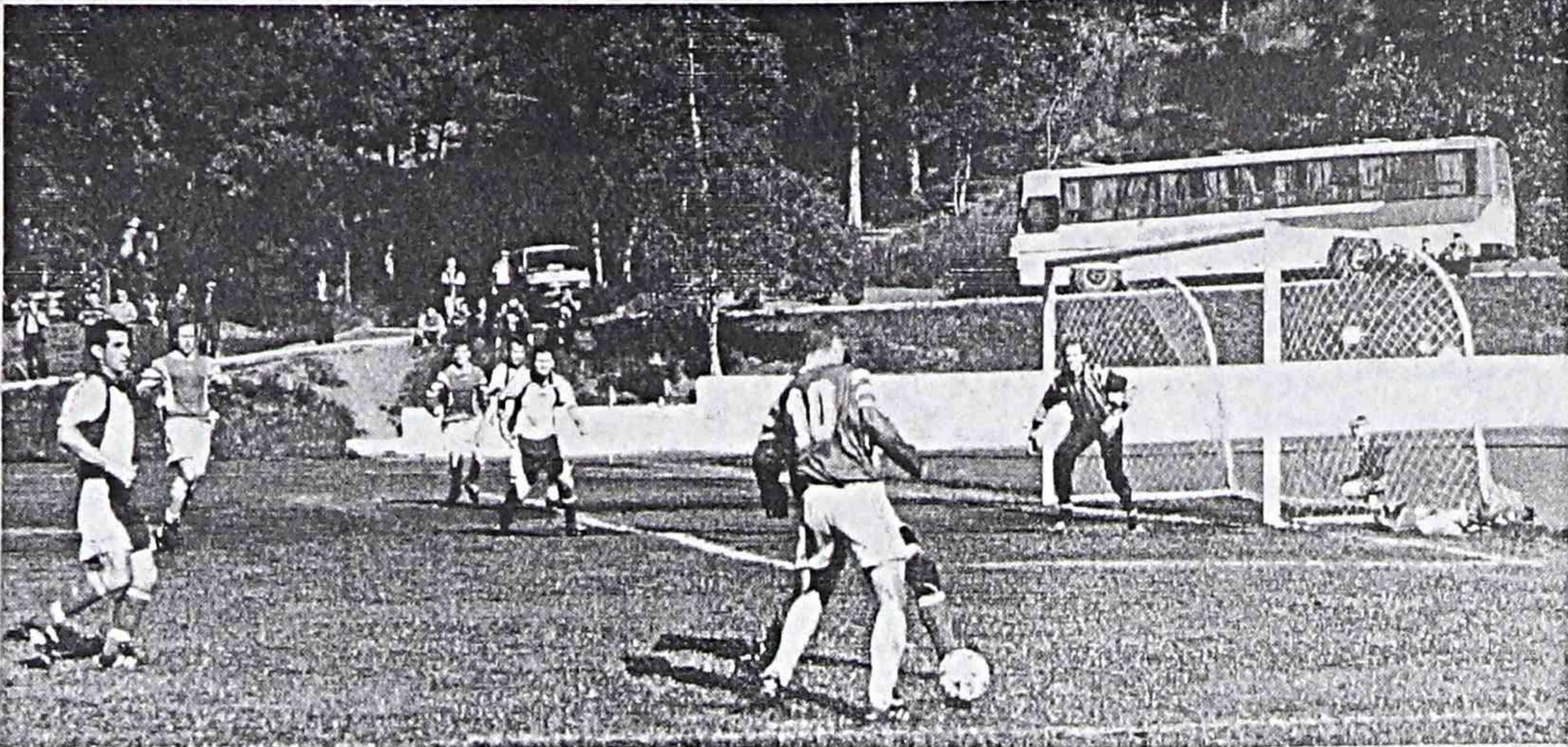
Футбол - 98: итоги сезона