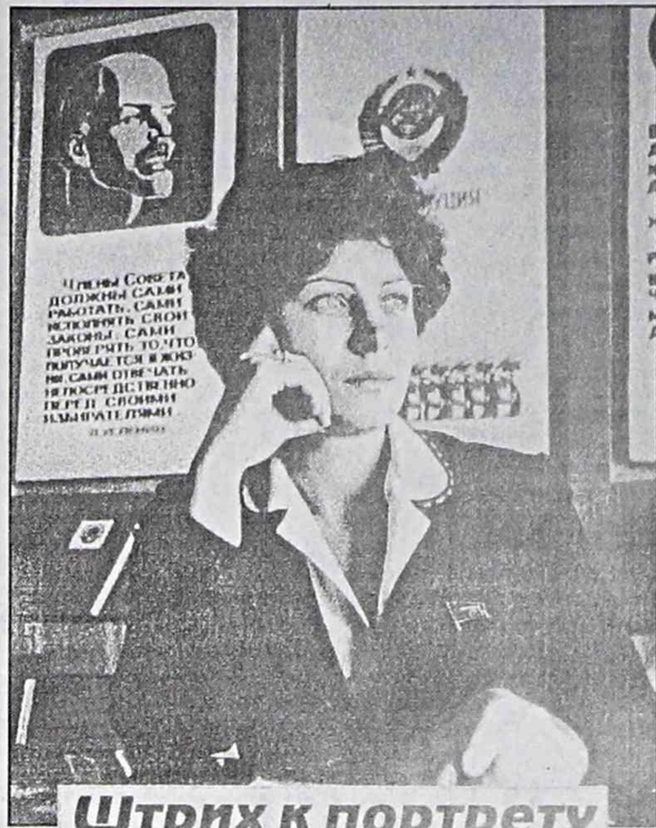
Штрих к портрету