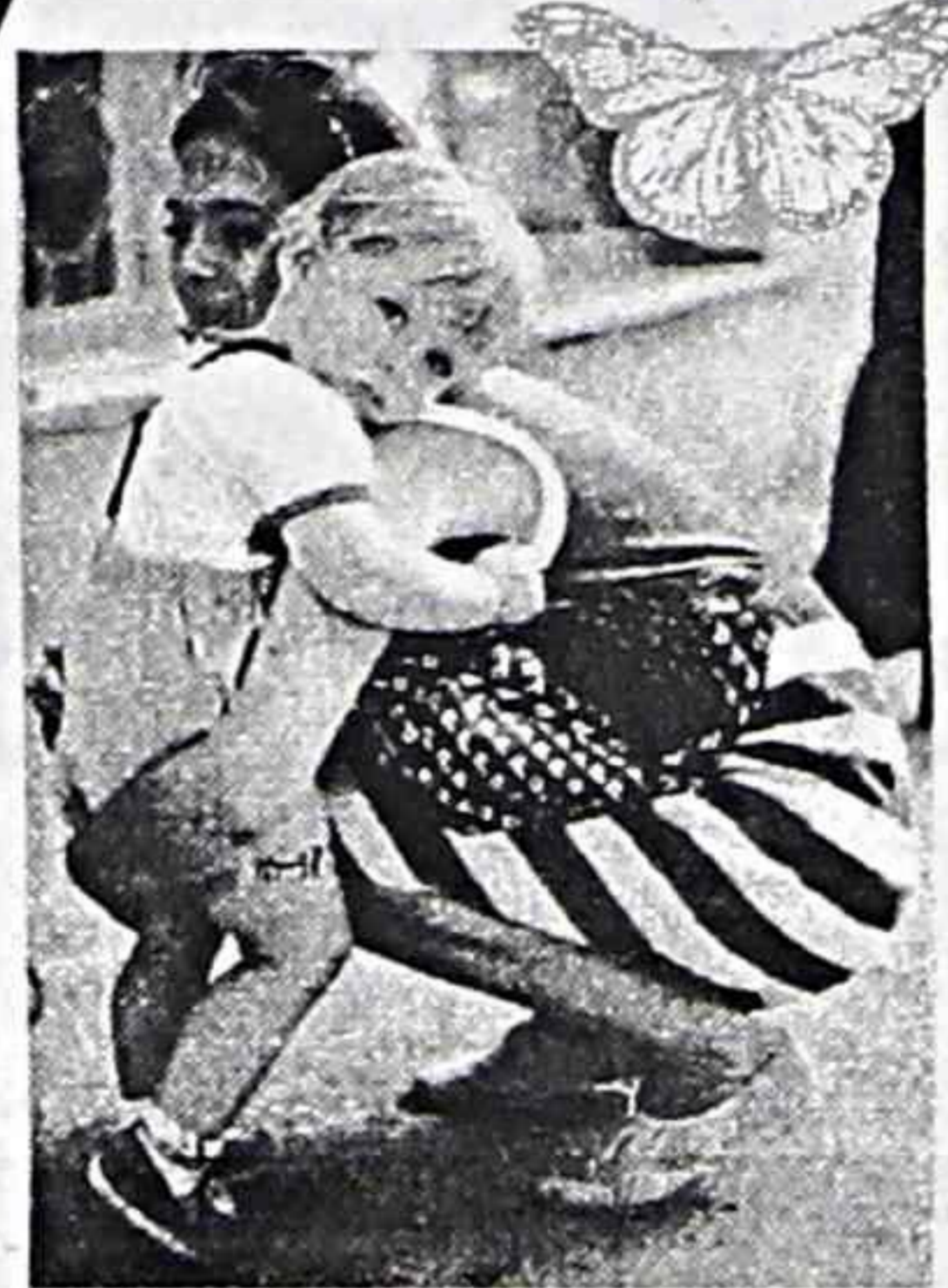
кой: - Машина по голове ездила!