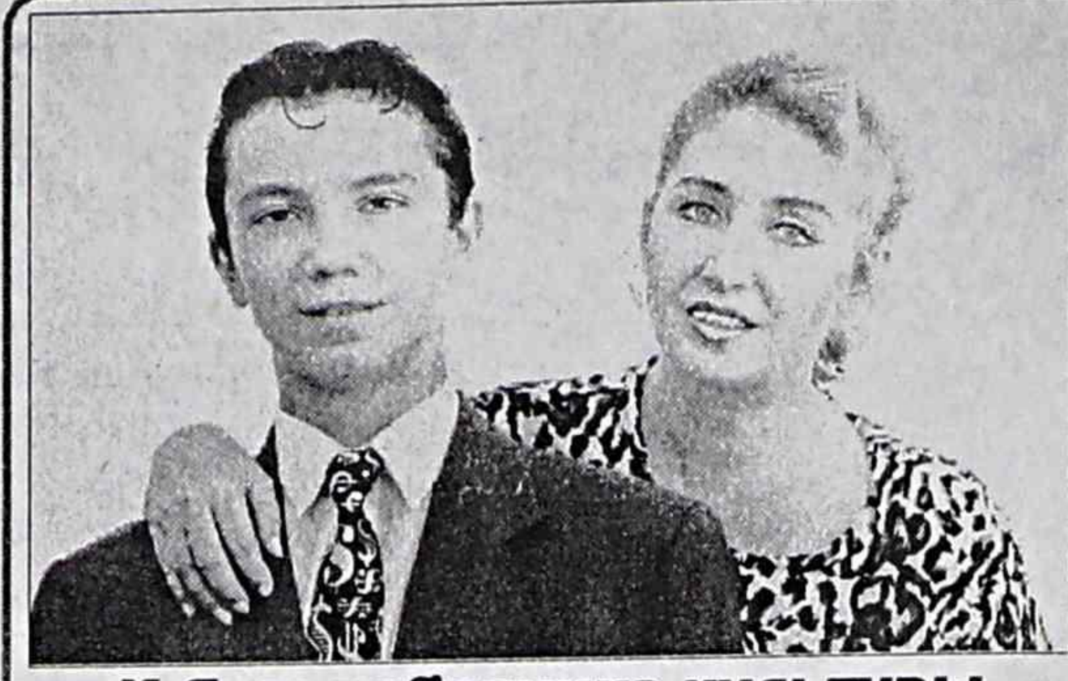
К Дню работника культуры

Эдита КИРЬЯНОВА, пресс-служба администрации города.