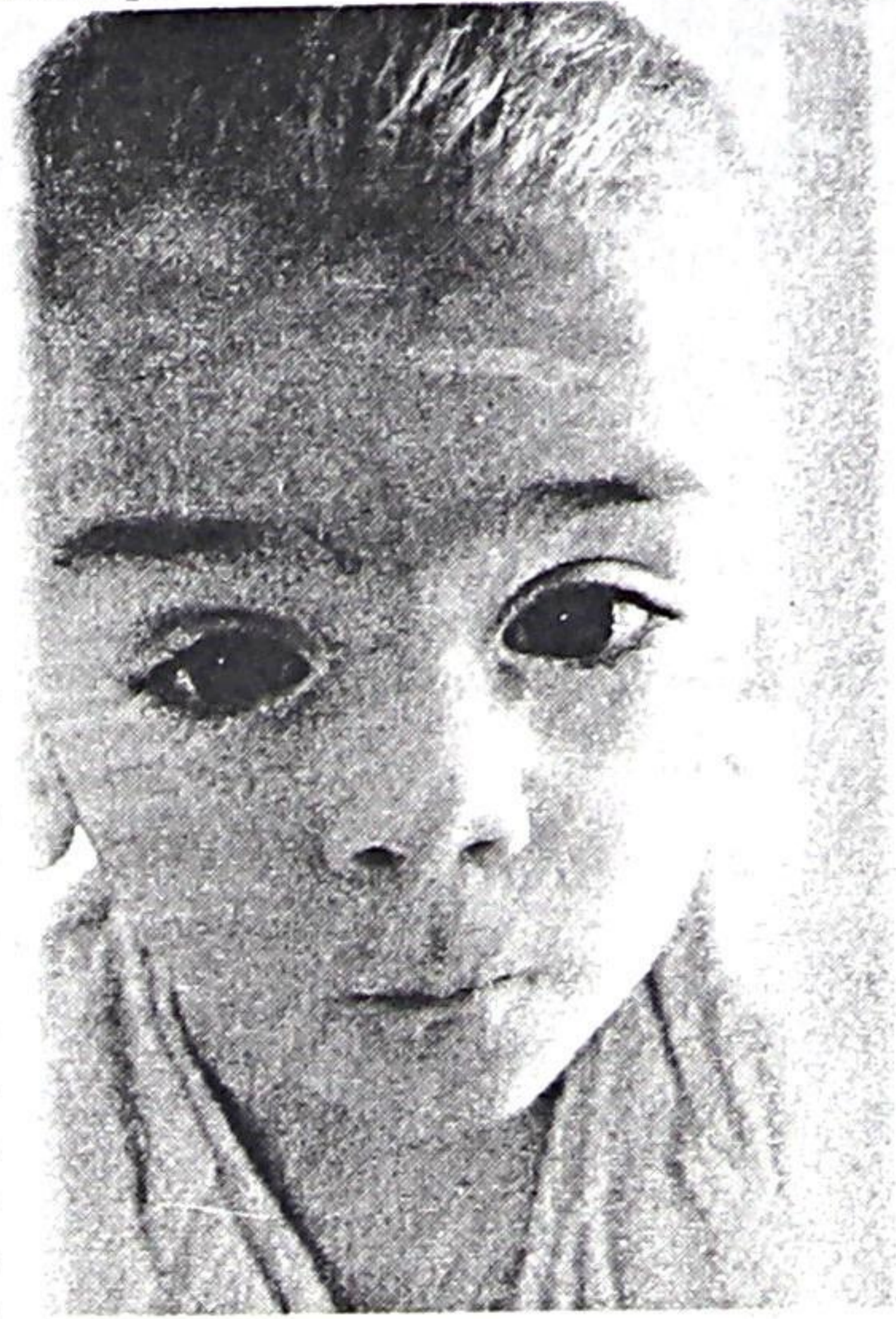
"под солнцем". Лолита МУЗЫКА.