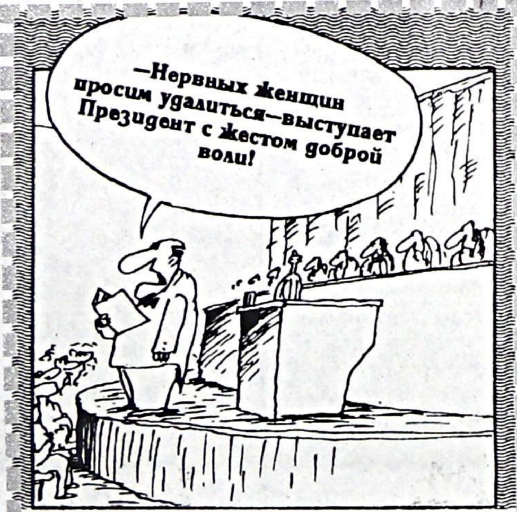
Рисунок Вячеслава ШИДОВА

О том, что президент ни в чем не желает ограничивать свои аппетиты, говорит еще один факт.