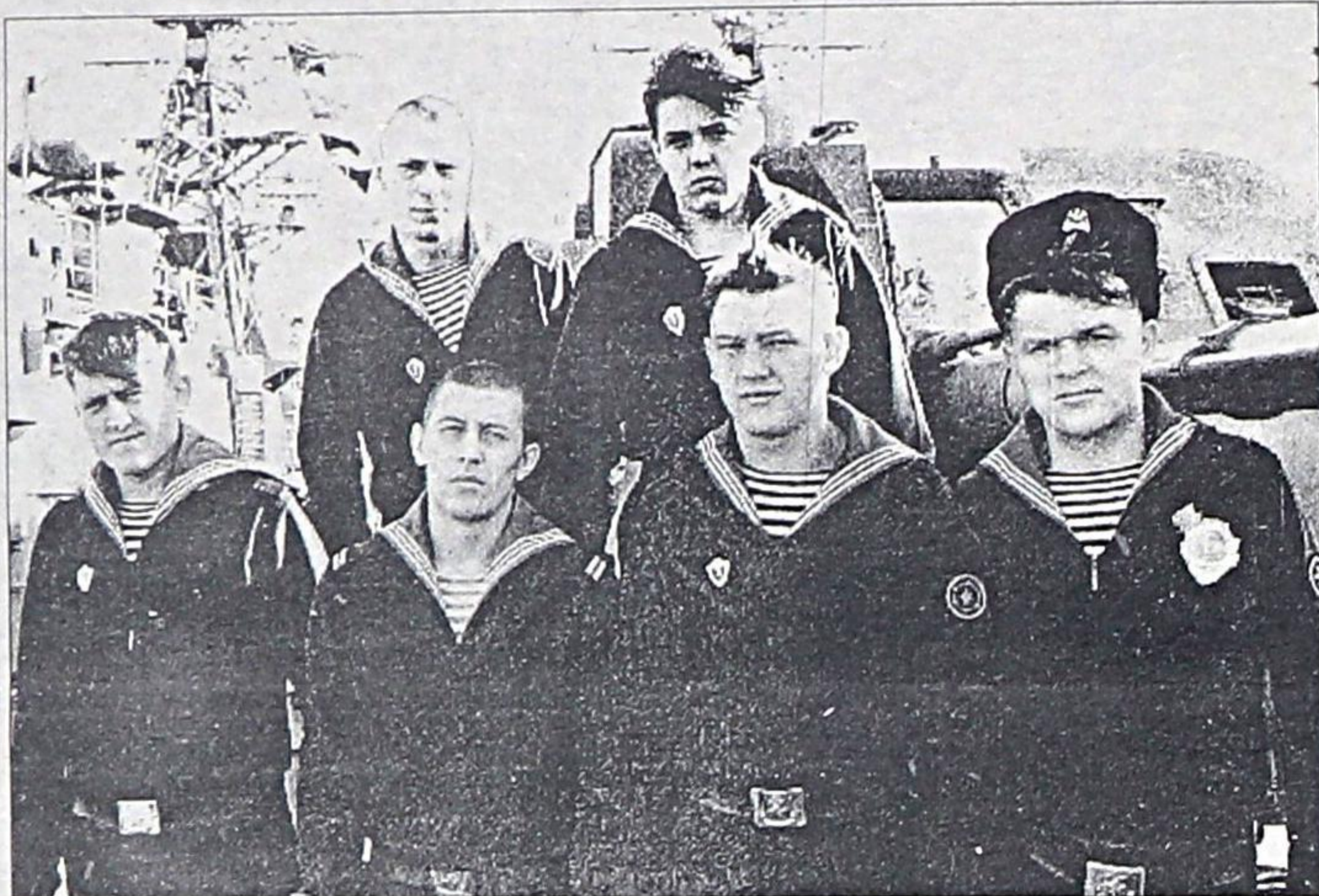
Матросы экипажа корабля, в числе которых и награжденные.

Десятого декабря исполнилось 15 лет со дня подъема на ПСКР “Ворон” военно-морского флага погранвойск и включения его в состав бригады. Все эти годы корабль активно нес службу по охране государственной границы и исключительной экономической зоны РФ. Кораблем пройдено 132048 миль, осмотрено 1136 рос-