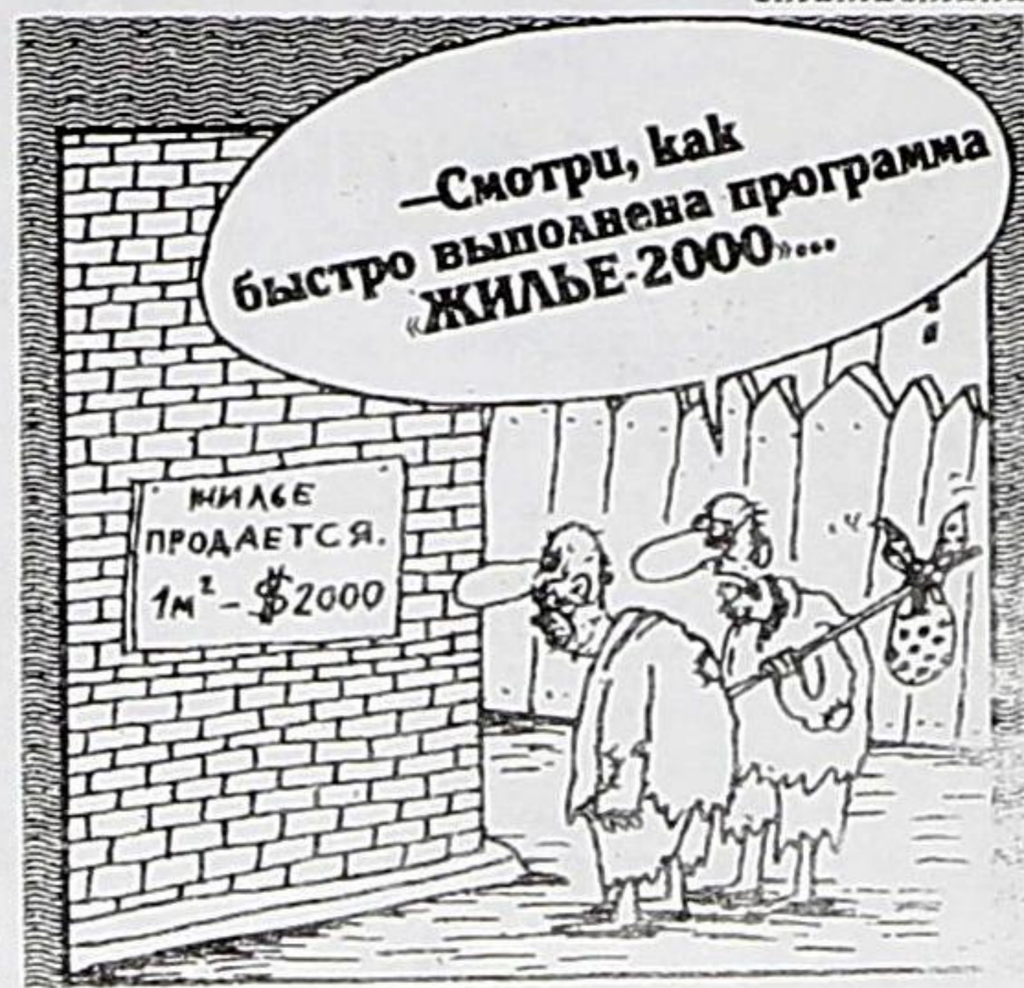
Рисунок Вячеслава ШИЛОВ

Подготовил Олег ЯКУНИН по материалам городского управления статистики