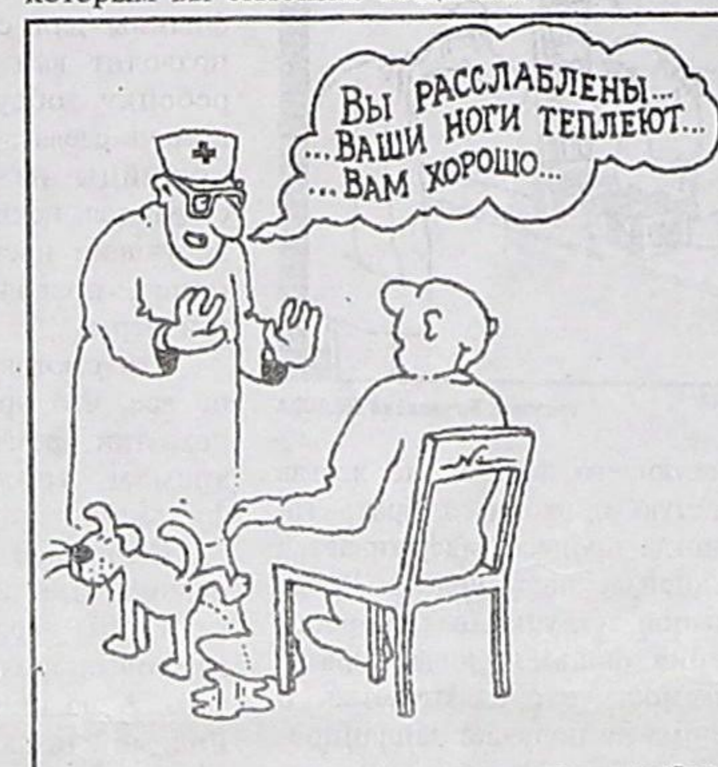
Рисунок Игоря КВЕТКО

Из общих принципов, основное - это не копить в себе отрицательные эмоции. Если речь идет о каждодневных проблемах, то, естественно, не нужно бежать к психиатру. Нужно просто об этом рассказать человеку, с которым вы склонны общаться.