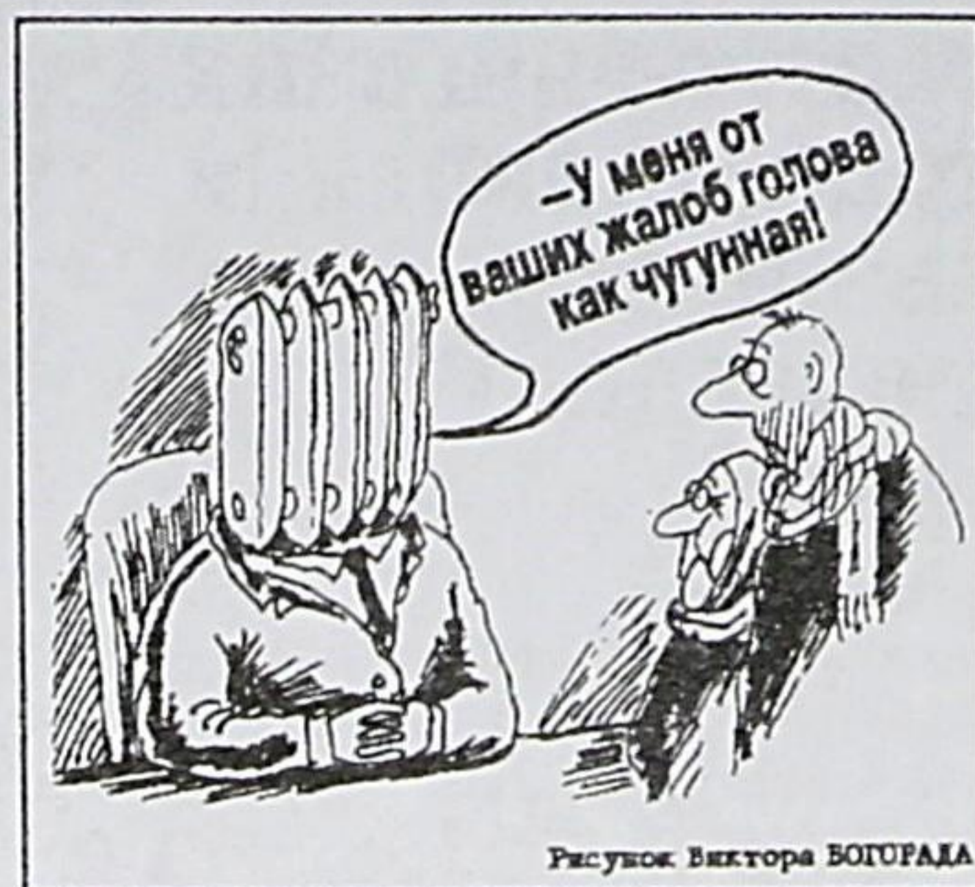
Рисунок Виктора БОГОРАДА

фиксировать качество и объём коммунальных услуг, это может пригодиться при внесении квартплаты, когда с вас будут требовать больше, чем вы должны.