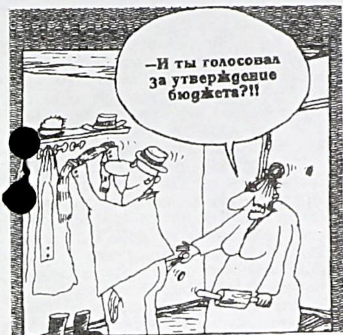
Рисунок Вячеслава ШЕЛОВА

На объединённом заседании депутатских комиссий по "Экономике и промышленности" и "Бюджету, финансам и услугам" рассматривались отчёт администрации города об исполнении бюджета за 1996 год, вопросы о строительстве нового водовода, о проекте договора на предоставление жилищно-коммунальных услуг населению, о расходовании топлива в 1997 году и о разработке Положения "О порядке создания, реорганизации и ликвидации муниципальных унитарных предприятий".