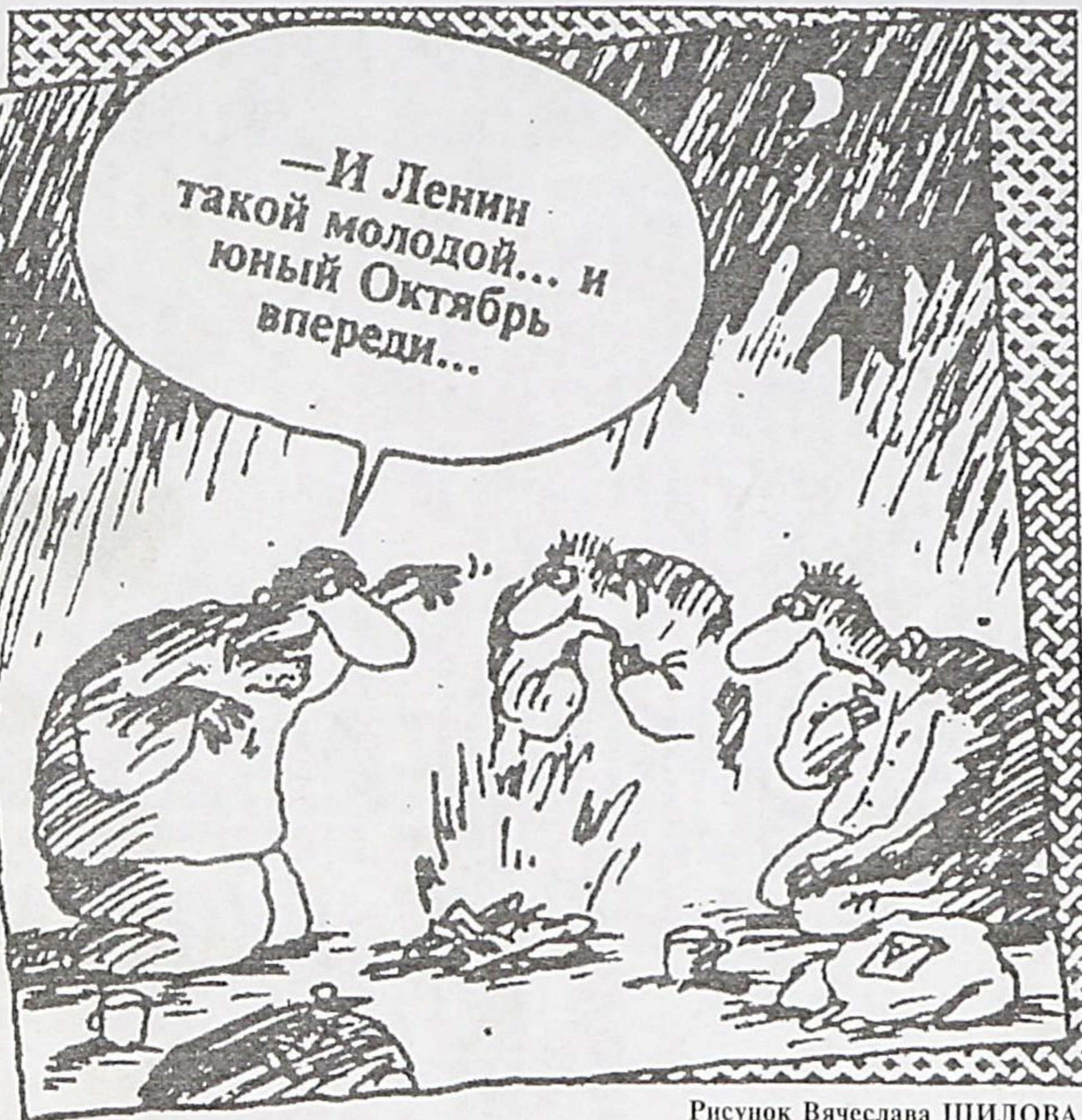
Рисунок Вячеслава ШИЛОВА.

билею одного из самых трагических событий в истории человечества Президент Ельцин настроился философски. День 80-летия Октябрьского переворота объявлен им Днём согласия и примирения. Кто с кем должен примириться? Те, кто натерпелся горя при коммунистическом режиме, пережил лагеря, ссылки, психушки, травлю крови не жаждут. Хотя бы потому, что они в корне отличаются от своих гонителей. Примириться людям с нелюдьми? Простить чекистов из тех, кто ещё живы и могут рассказать как расстреливали невинных? Кстати, по никем не отменённому российскому Закону "О реабилитации жертв политических репрессий"