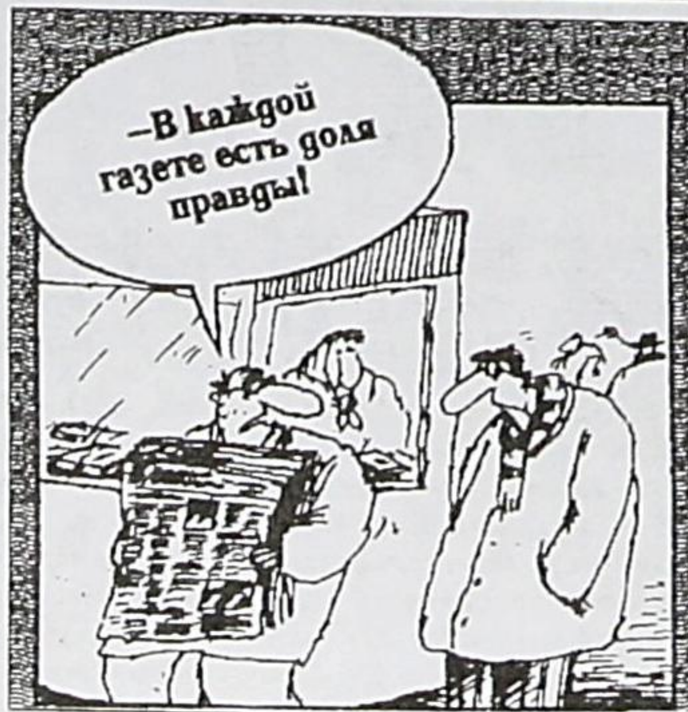
Рисунок Вячеслава ШИЛОВА

популярного "Московского комсомольца"?", Марина Анатольевна ответила коротко: "Плохо расходуется". Причина того, что с прилавков исчез не менее популярный "Огонек" названо то, что его не предлагают ни само издательство, ни какие-либо другие распространители. Стабильно пользуются спросом столпы российской журналистики: "Литературная газета", "Известия", "Аргументы и факты". А журналы горожане редко берут - низкая покупательская способность заела. Тут не до "Космополитен" - хлеба бы купить.