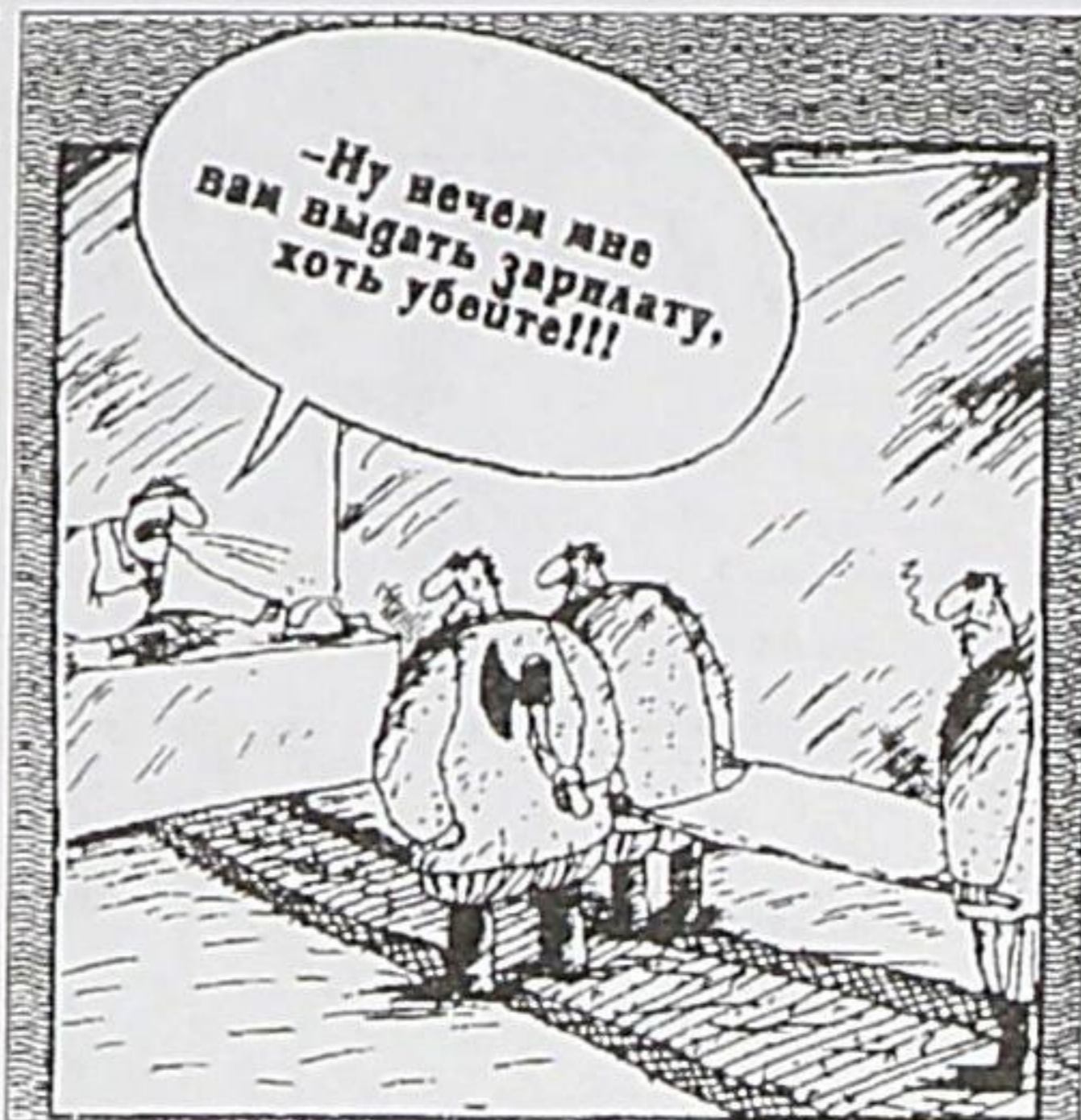
Рисунок Вячеслава ШИЛОВА