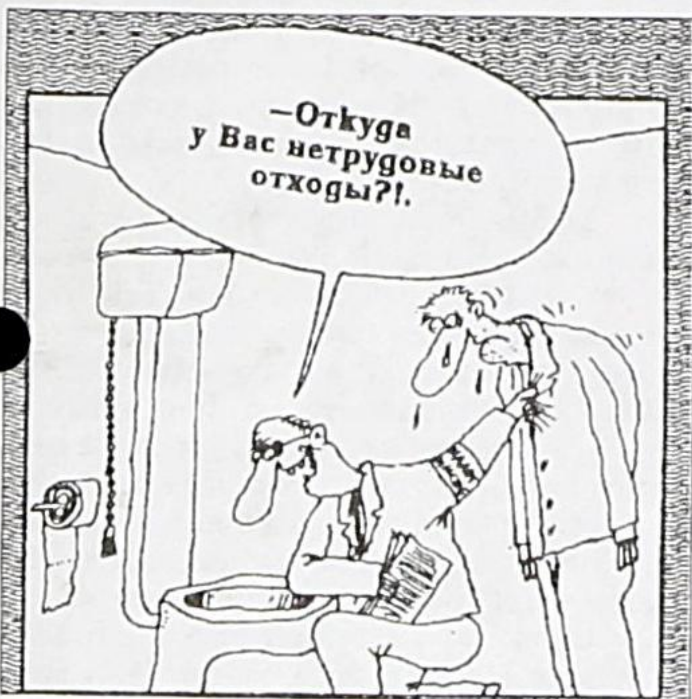
Рисунок Вячеслава ШИЛОВА

Очевидно, что показатели могли бы быть значительно выше, не будь в Находке многочисленного отряда "челноков" и других категорий горожан, вынужденно "делающих сами себя". Плюс - скрытая безработица, когда на простаивающих предприятиях внешне все как бы в порядке, но реальное положение дел остается вне официальной статистики.