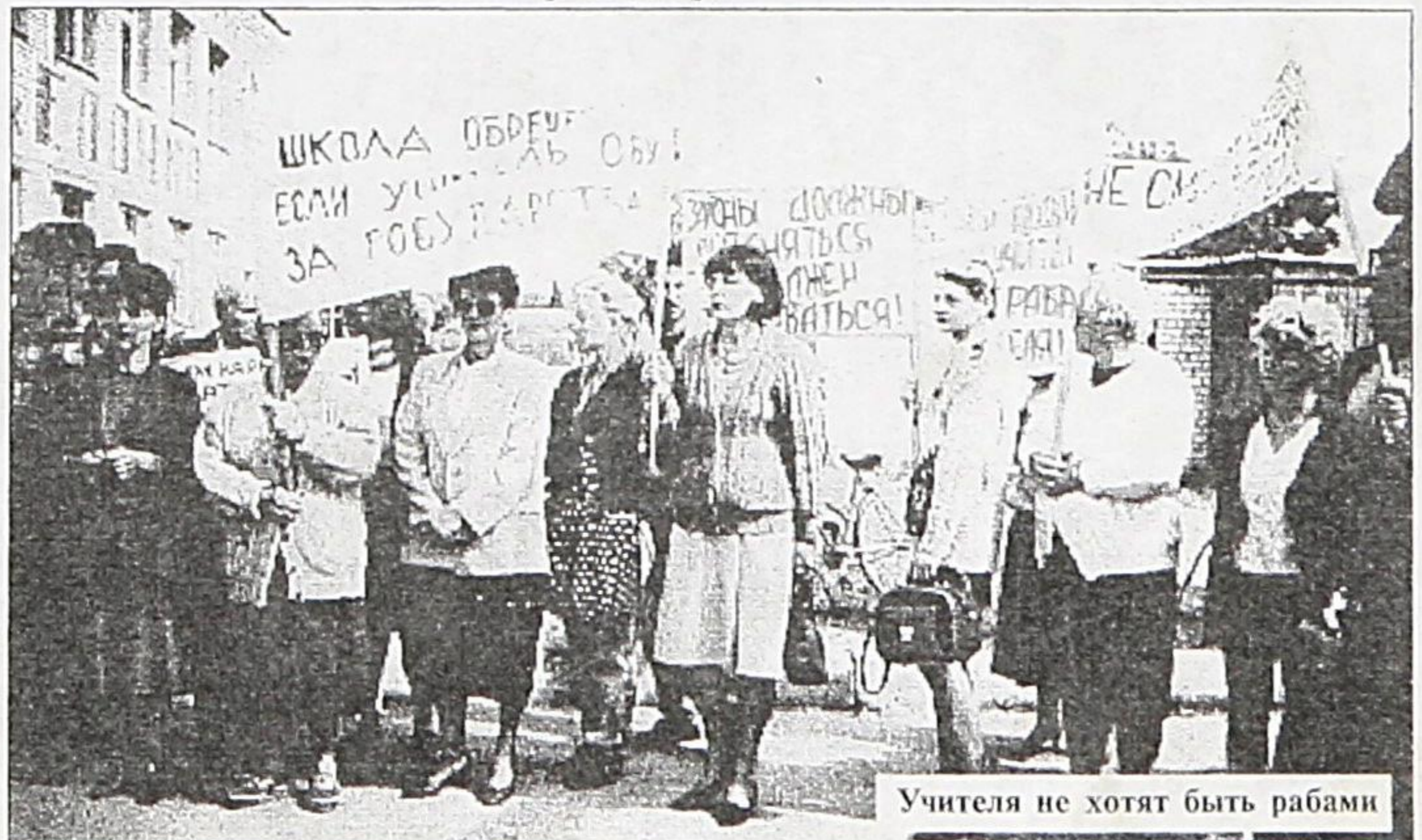
Учителя не хотят быть рабами

Еще 5 сентября прошла акция гражданского неповиновения педагогов и родителей учеников нескольких школ Партизанского района. Была заблокирована автотрасса Находка-Владивосток в районе поселка Новолитовска. Далеко не все представители стачкома смогли поучаствовать в этой акции. Причины разные. Либо угрозы руководящих товарищей в адрес бастующих, либо отказ в предоставлении автотранспорта для учителей других поселков района. Либо - самое эффективное: милицию заранее оповестили - взбунтовавшихся учителей и родителей в Новолитовск "не пушать". Поэтому присутствовало на месте