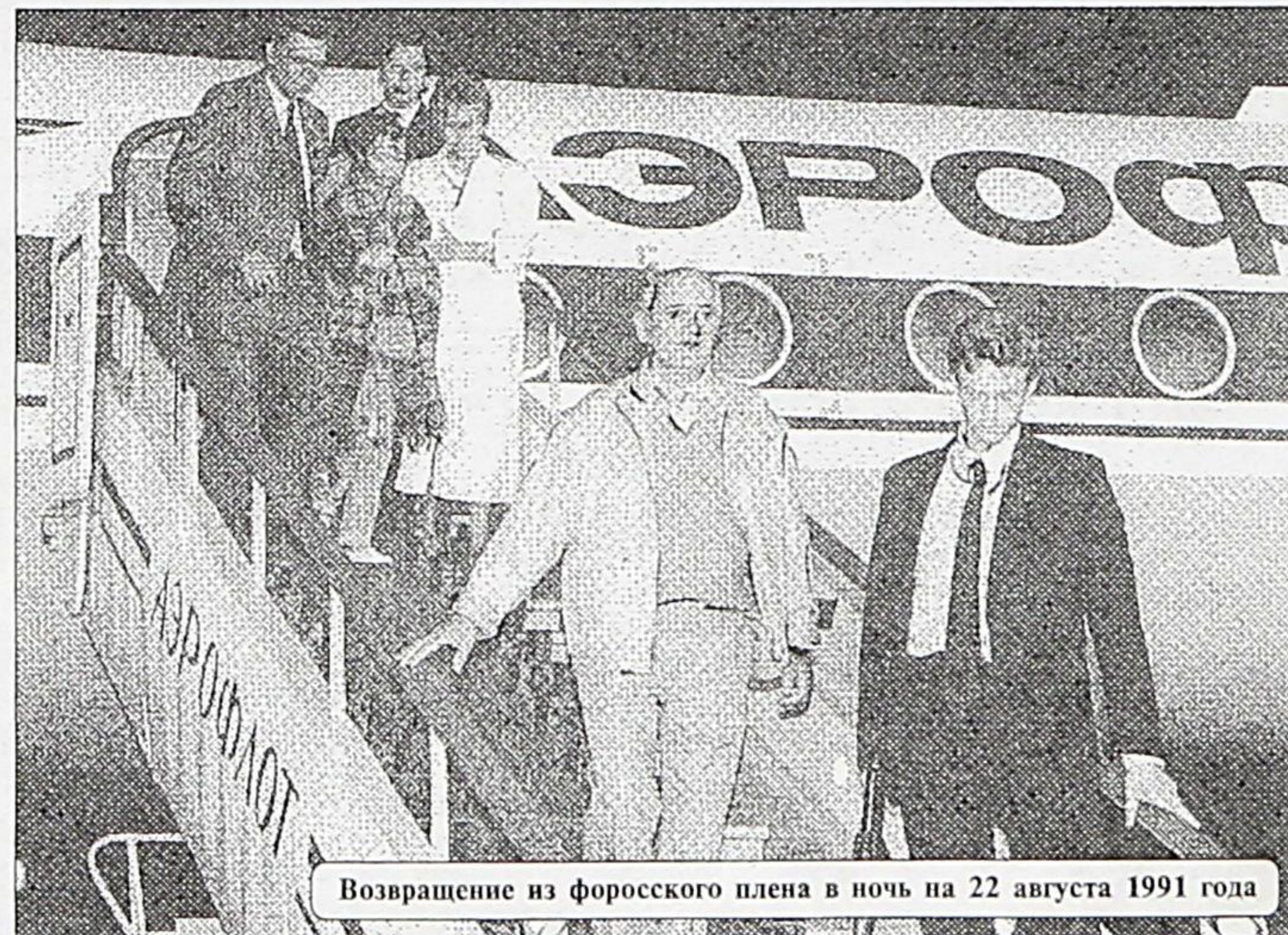
Возвращение из форосского плена в ночь на 22 августа 1991 года

по сути, оправдали. Бывшие ГКЧП-сты заседают в Думе, пишут мемуары, консультируют коммерческие структуры. Единое государство, которое могло бы сохраниться в виде обнов-