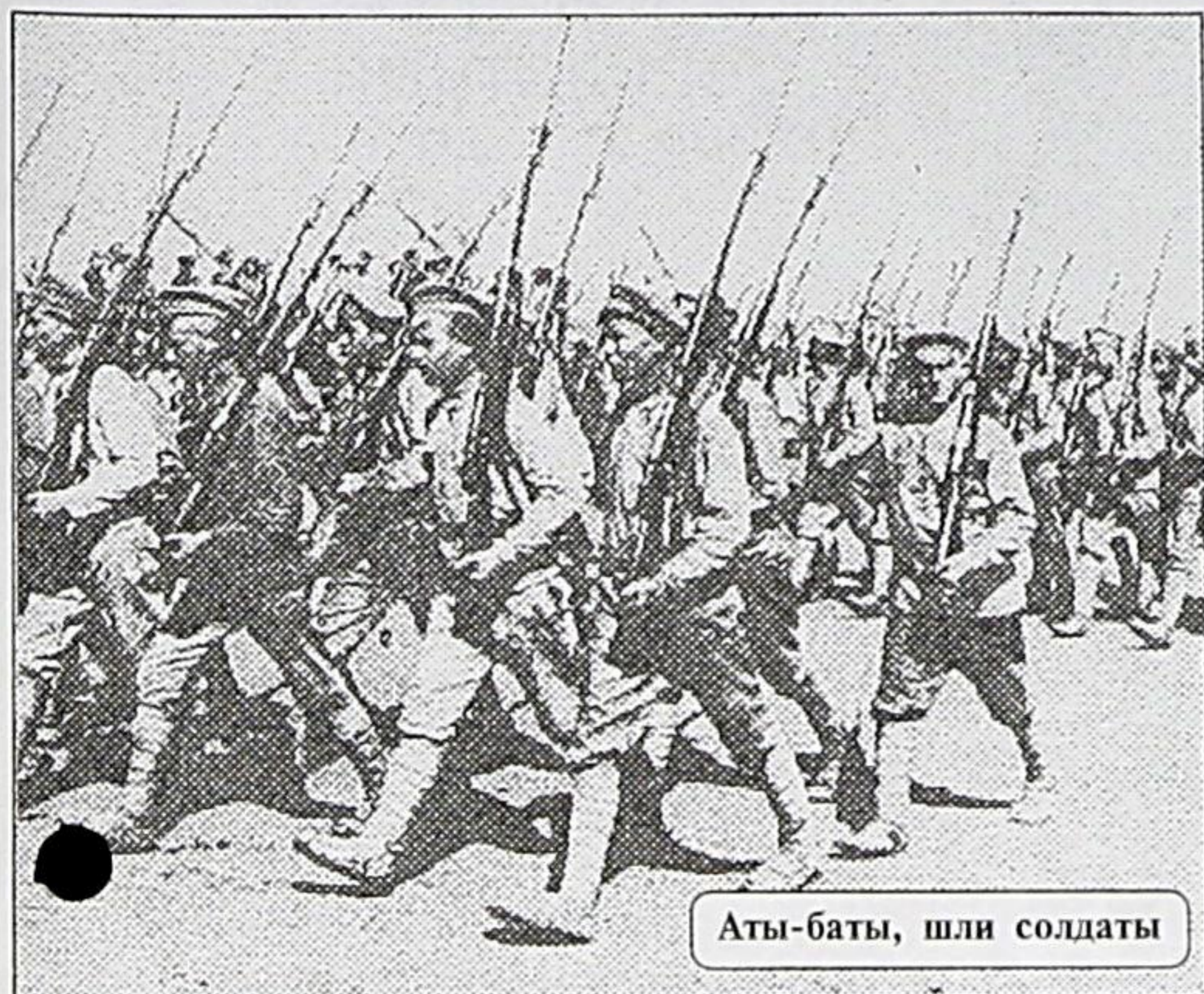
Аты-баты, шли солдаты

Август - месяц, не раз роковым образом сказывавшийся на мировой истории, на жизни миллионов людей. Вспомним о двух событиях. О Первой мировой войне, приведшей к новому устройству мирового сообщества, к революции в России. И о путче 19-21 августа 1991 года, положившем конец существованию "двух систем, двух образов жизни".