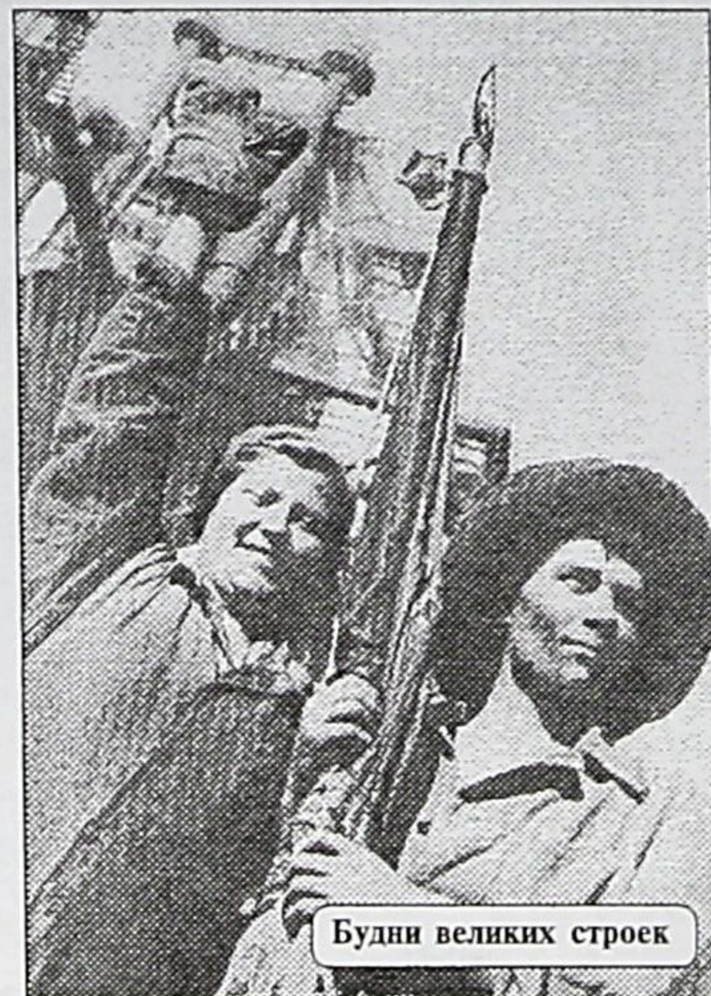
Будни великих строек

ленного Союза, вряд ли уже восстановишь. Авантюра руководителей СССР привела к его краху.