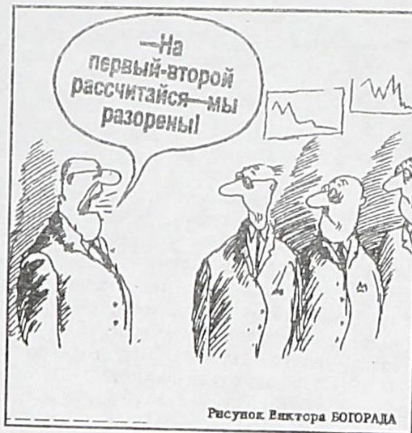
Рисунок Виктора БОГОРАДА