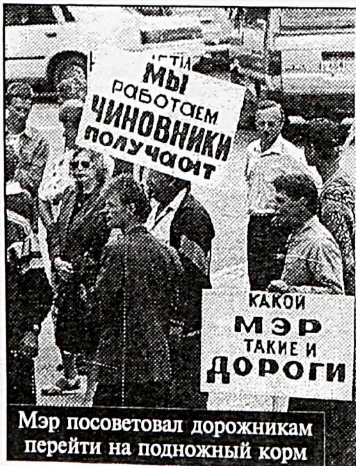
Мэр посоветовал дорожникам перейти на подножный корм