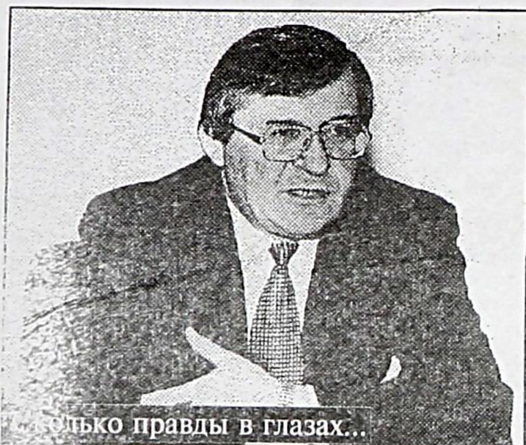
Только правды в глазах...