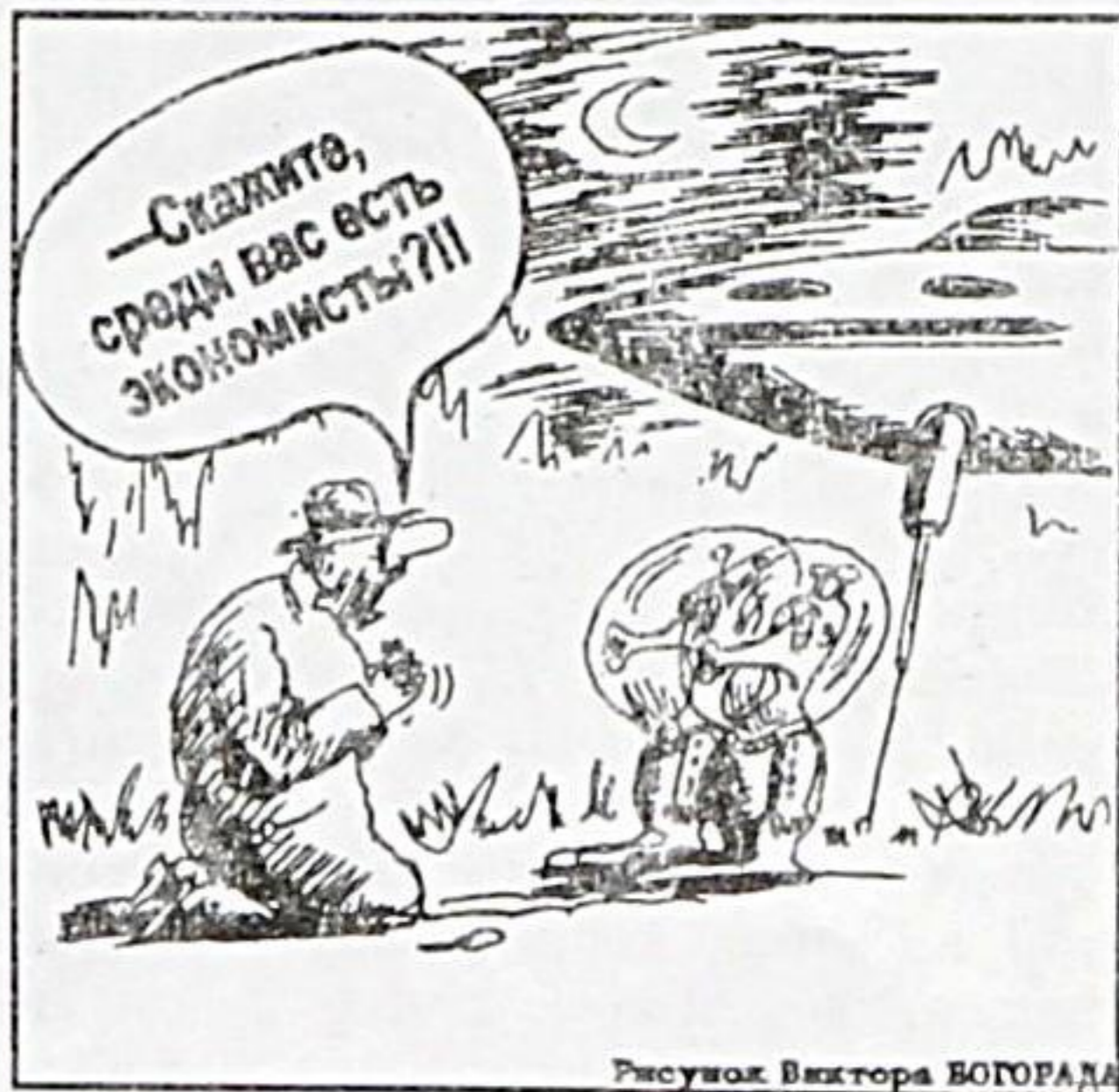
Рисунок Виктора БОГОРАДА

Редакция "Проспекта" с чувством глубокого удовлетворения отмечает факт реагирования властей на критические выступления прессы. Так, подверглось резкому непониманию засыпание дорожных ям глиной. Даже сами дорожники возмутились этим фактом. Меры приняты. Некоторое время назад ямы в районе Центральной площади (и не только) были засыпаны мелким щебнем. Что позволило не объезжать ямы в течение более чем 15,05 минуты.