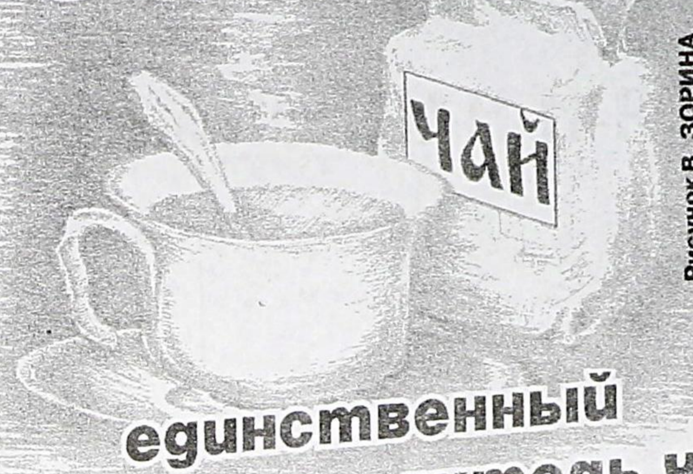
Рисунок В. ЗОРИНА