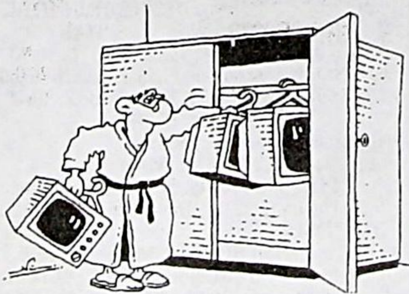
Рисунок Игоря КВЯКО