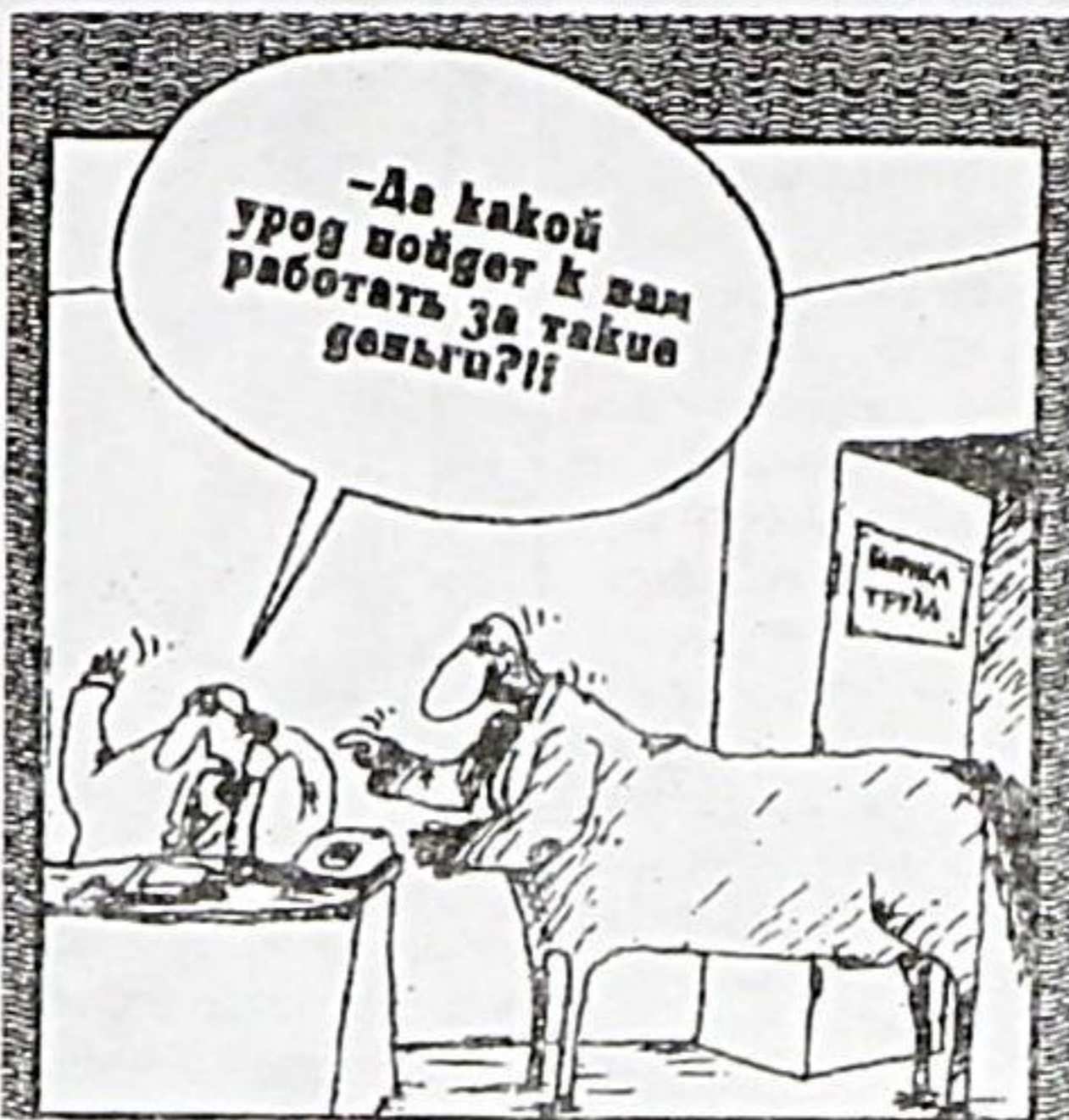
Рисунок Вячеслава ШИЛОВА

- Кстати, иностранным безработным гораздо легче обманывать наших коллег, особенно в Европе. Границу пересечь очень легко. Можно состоять на учете как безработный в одном государстве, получать пособие, а подрабатывать в другом. У нас с этим гораздо сложнее. Не так-то просто выехать за границу, тем более устроиться