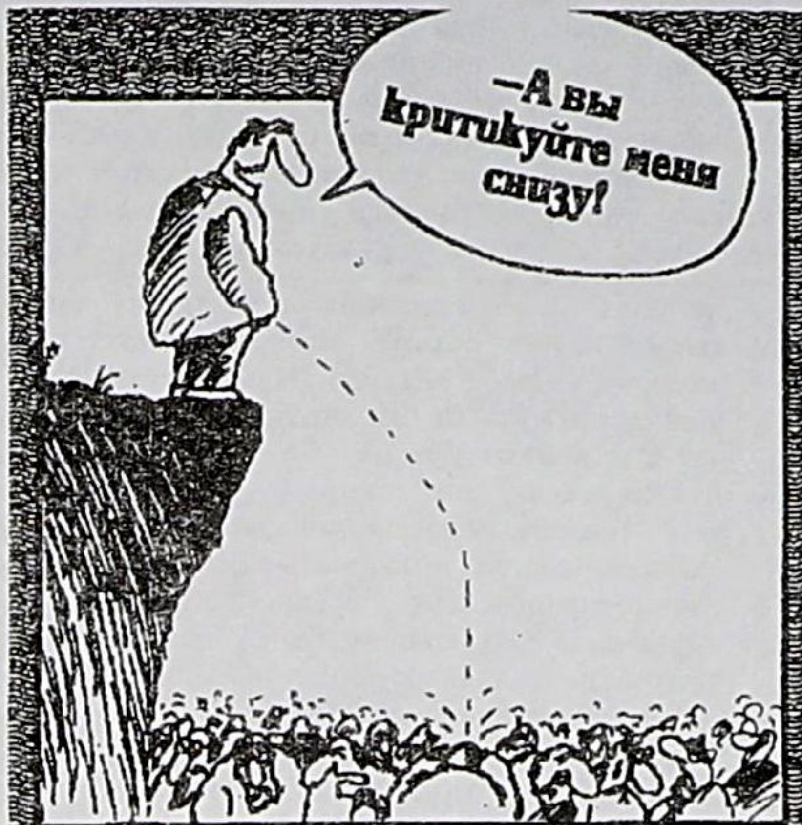
Рисунок Вячеслава ШИЛОВА

В доме Бердоносова при обыске изъято: 8340 долларов США, 4200 немецких марок, 1160 финских марок, банковские складные книжки с 30 миллионами рублей и 636 долларами США на остатках, различные облигации номиналом почти на 60