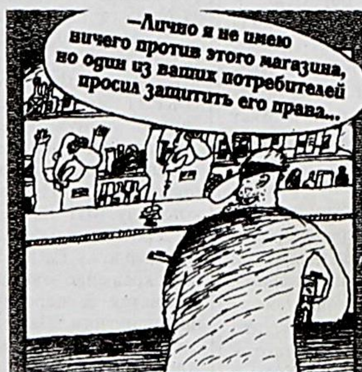
Рисунок Вячеслава ШЕЛОВА

К примеру, городской музей, отель "Пирамида", магазин "Кедр" и светофор на пешеходном переходе запитаны напрямую на этот нестандартный источник энергии. Небольшой по размерам и очень мощный ветряк пришелся по душе жителям нашего города, уставшим ждать то энергии с атомной подлодки, то с Уссурийской