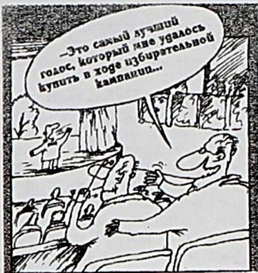
Рисунок Вячеслава ШЕЛОВА