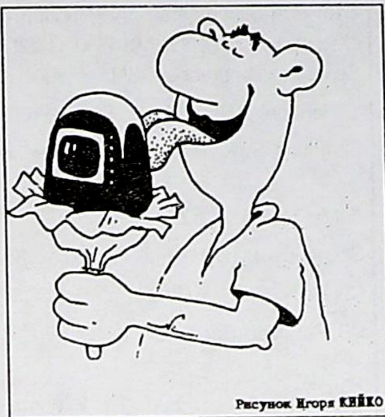
Рисунок Игоря КВЯКО

памяти 15.00 Вести 15.20 "Крах инженера Гарина-2" 16.30 За околицей 16.45 М/ф 17.35 Фильм-концерт ПТ 18.20 Американский английский 18.35 Между прочим 18.45 вираж 19.05 Пресс-эксперт 19.15 Тогда и ныне 19.45 Факс 20.00 Местное время РТ 21.00 Вести 21.30 Добрый вечер 22.25 "Санта-Барбара" 23.20 Кто мы? 00.00 Вести 00.15 Все, что могу, спую