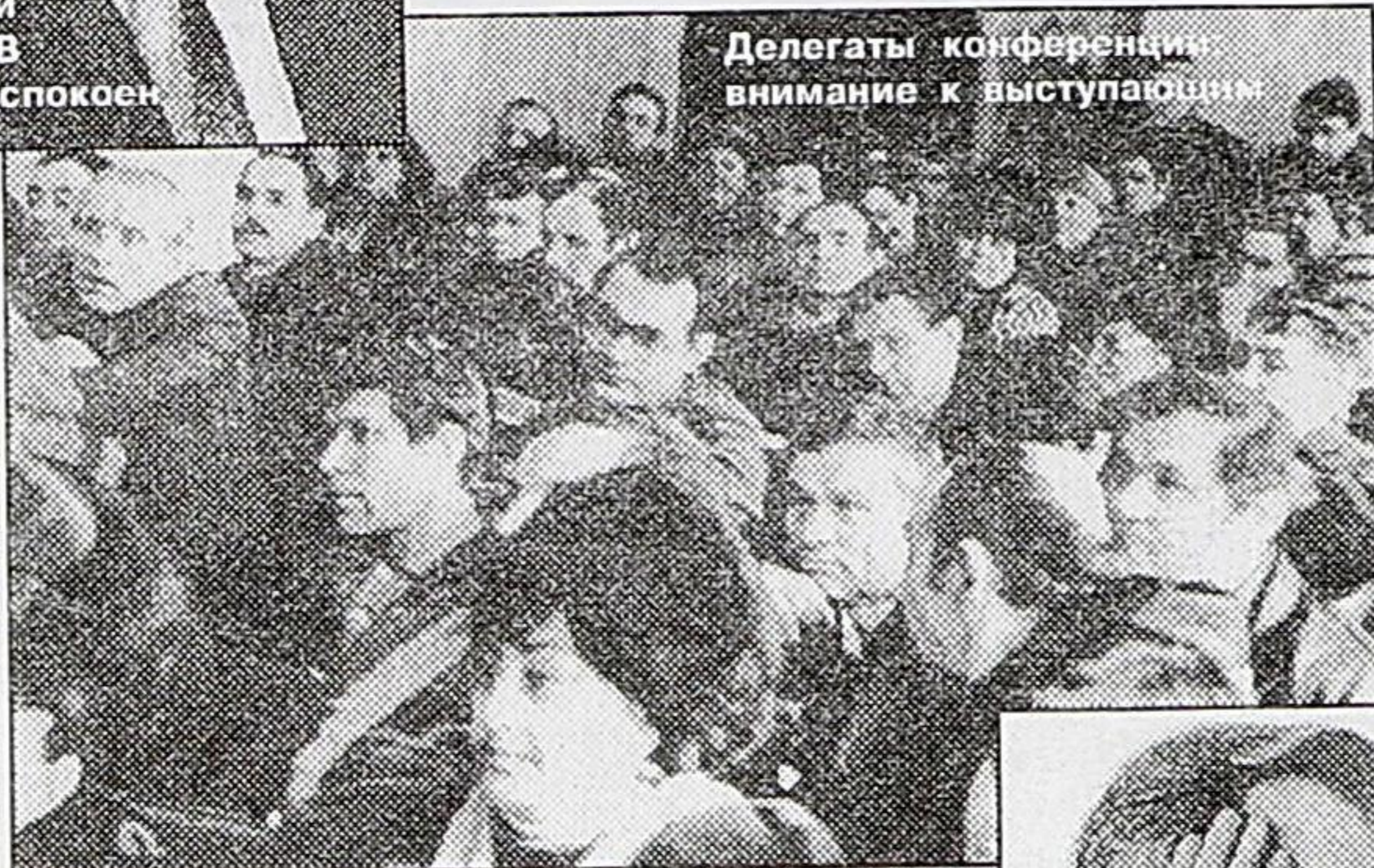
Делегаты конференции внимание к выступающим