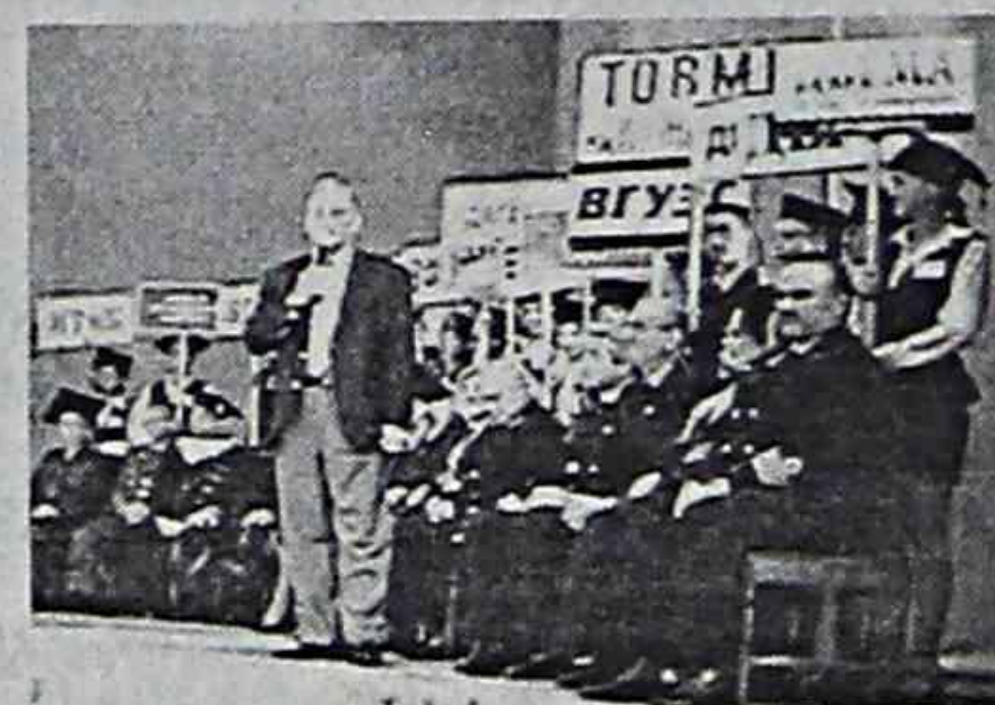
Ректоры желают своим студентам благополучия.

Что теперь? А теперь организаторы заводят новый студенческий. Жизнь продолжается, и в следующем году случится очередной краевой праздник посвящения в студенты "Виват, гаудеамус!"