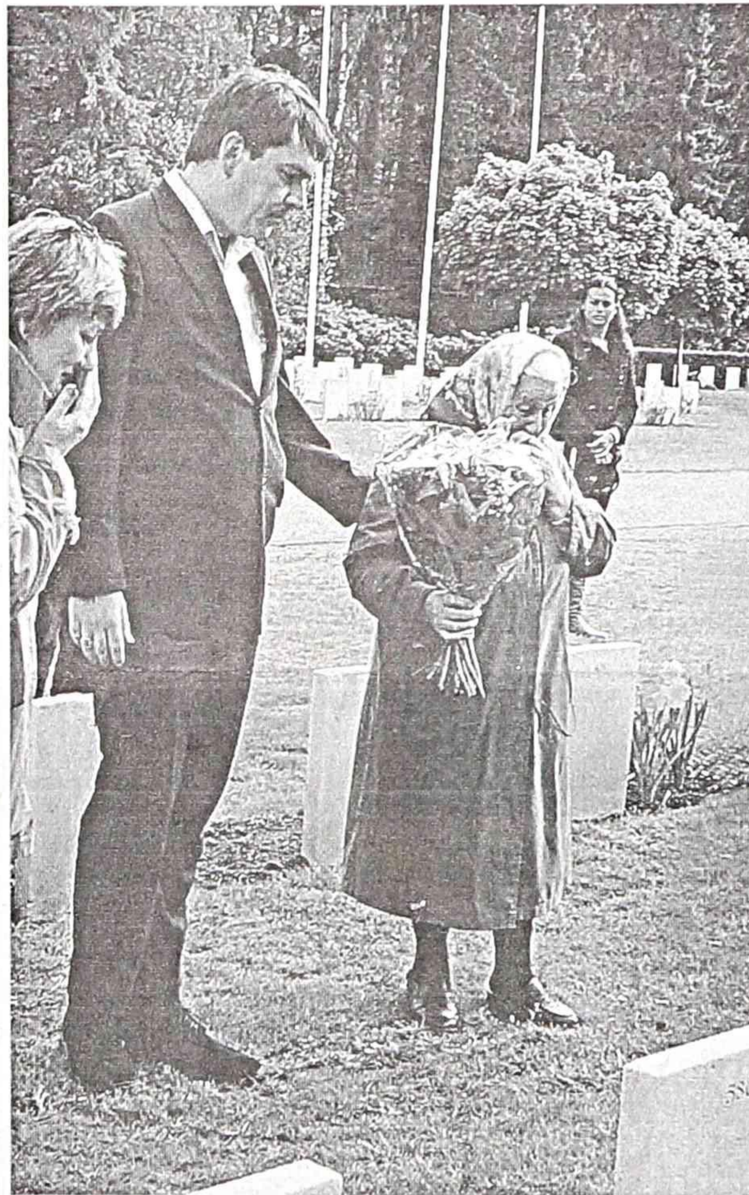
На Поле Славы