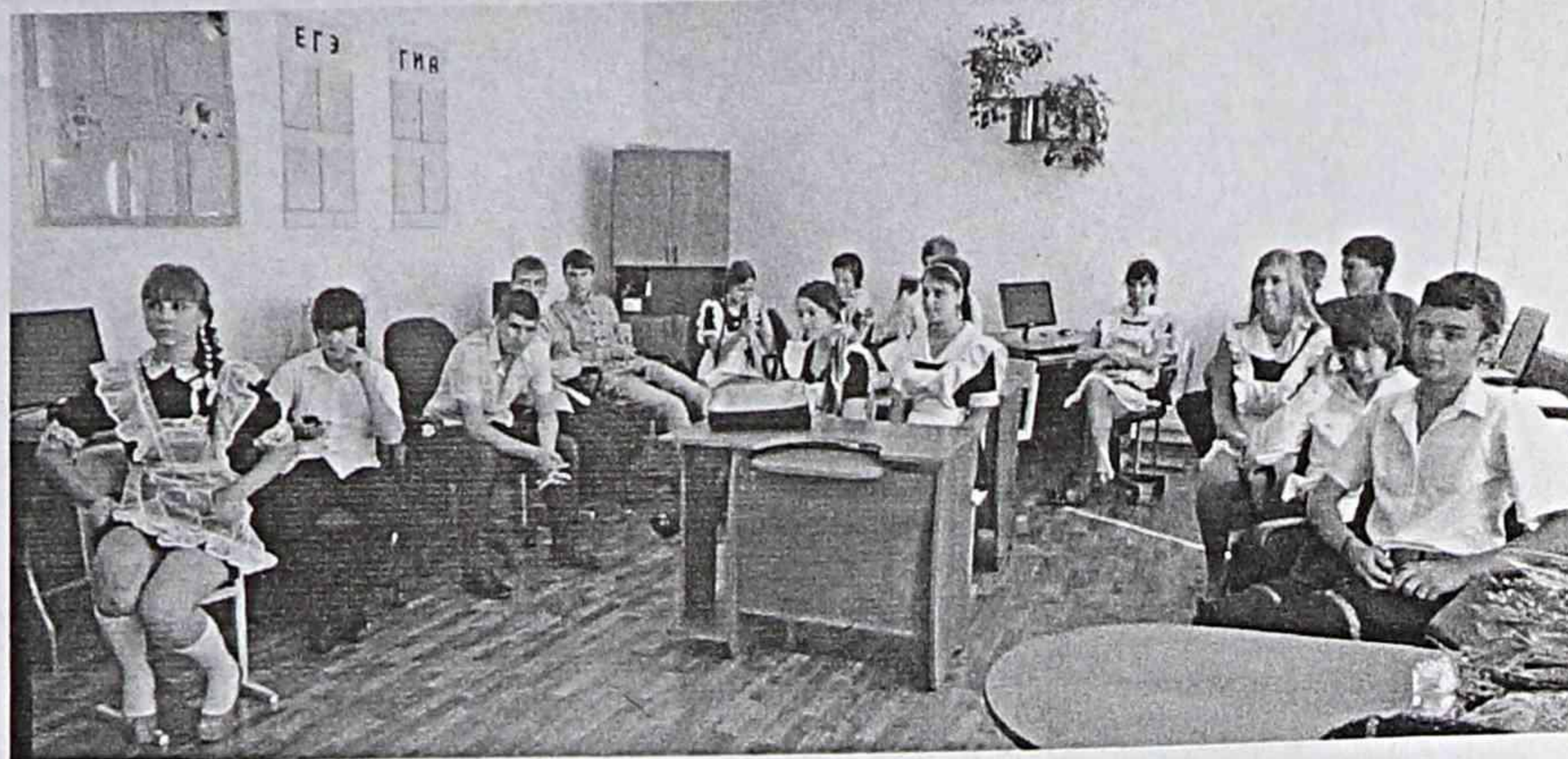
1 сентября 2012 г. 11-й класс школы № 27 п. Южно-Морской

В системе российского образования постоянно появляется что-нибудь новенькое. Так в последнее время появился новый стандарт для начальной школы, готовится вступить в силу новый образовательный стандарт для старшекласников. На фоне появления новых образовательных стандартов для учеников, чиновники не смогли оставить педагогов в стороне. Минобрнауки разрабатывает стандарты для учителей РФ. 1