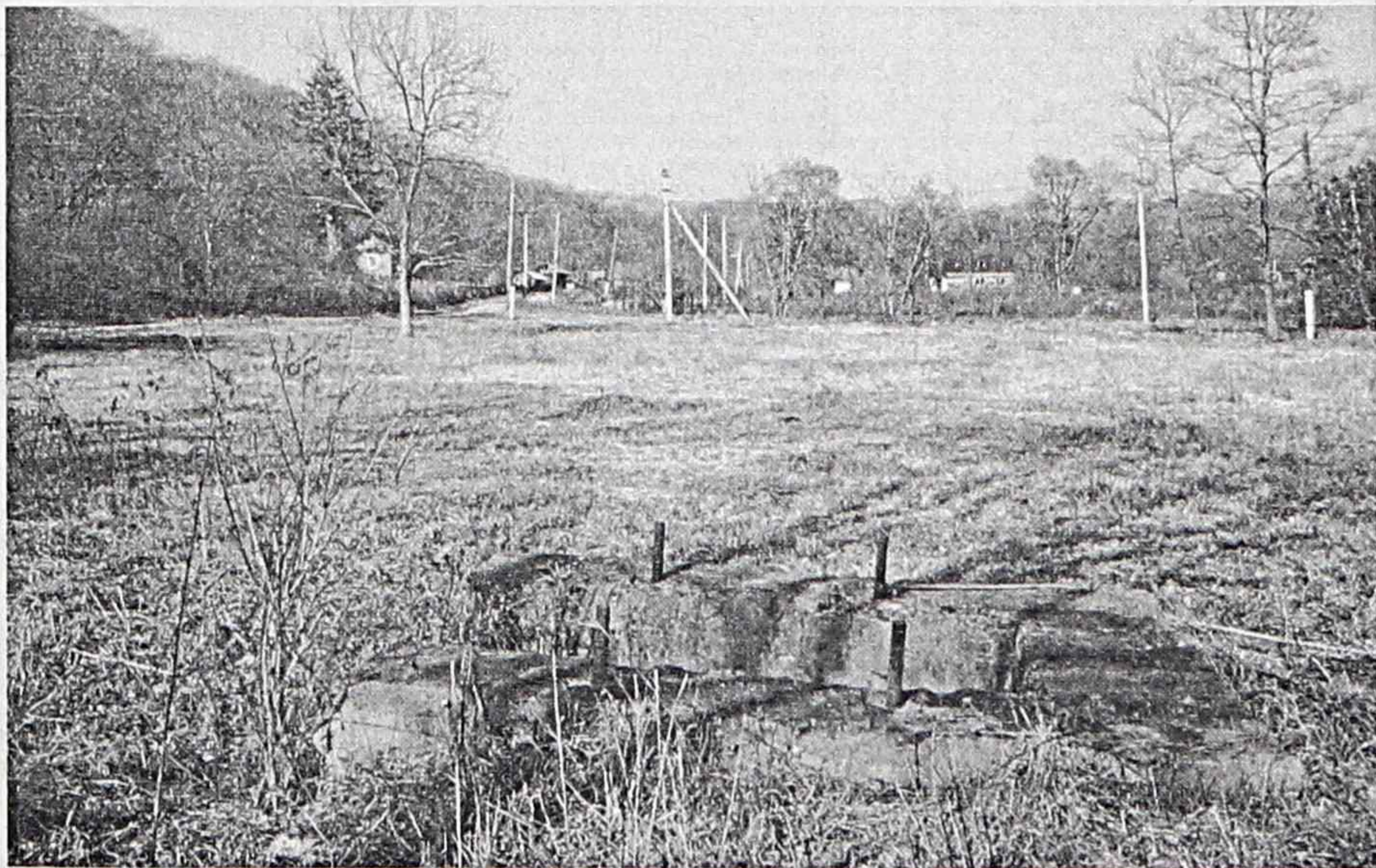
Душкино. Где-то здесь была церковь