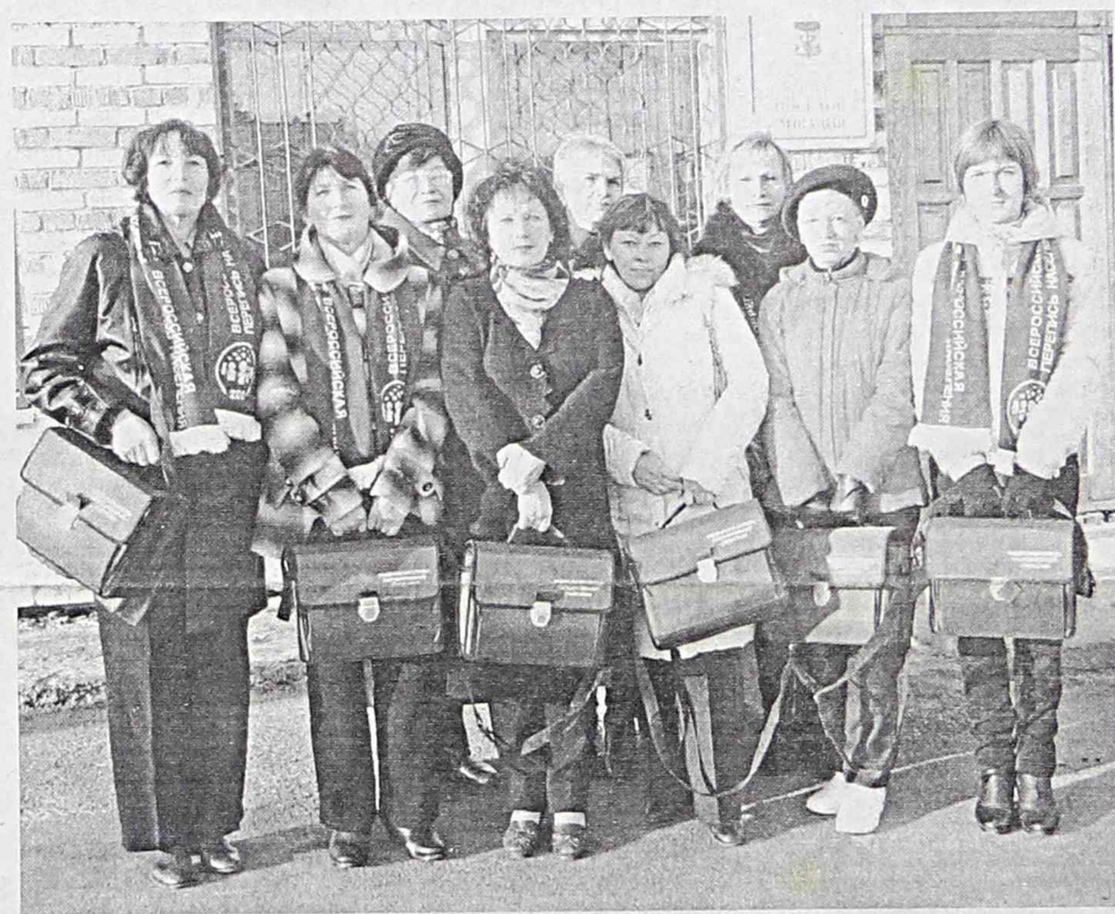
Бригада переписного участка № 2 - п.Ливадия, с.Средняя и п.Авангард.