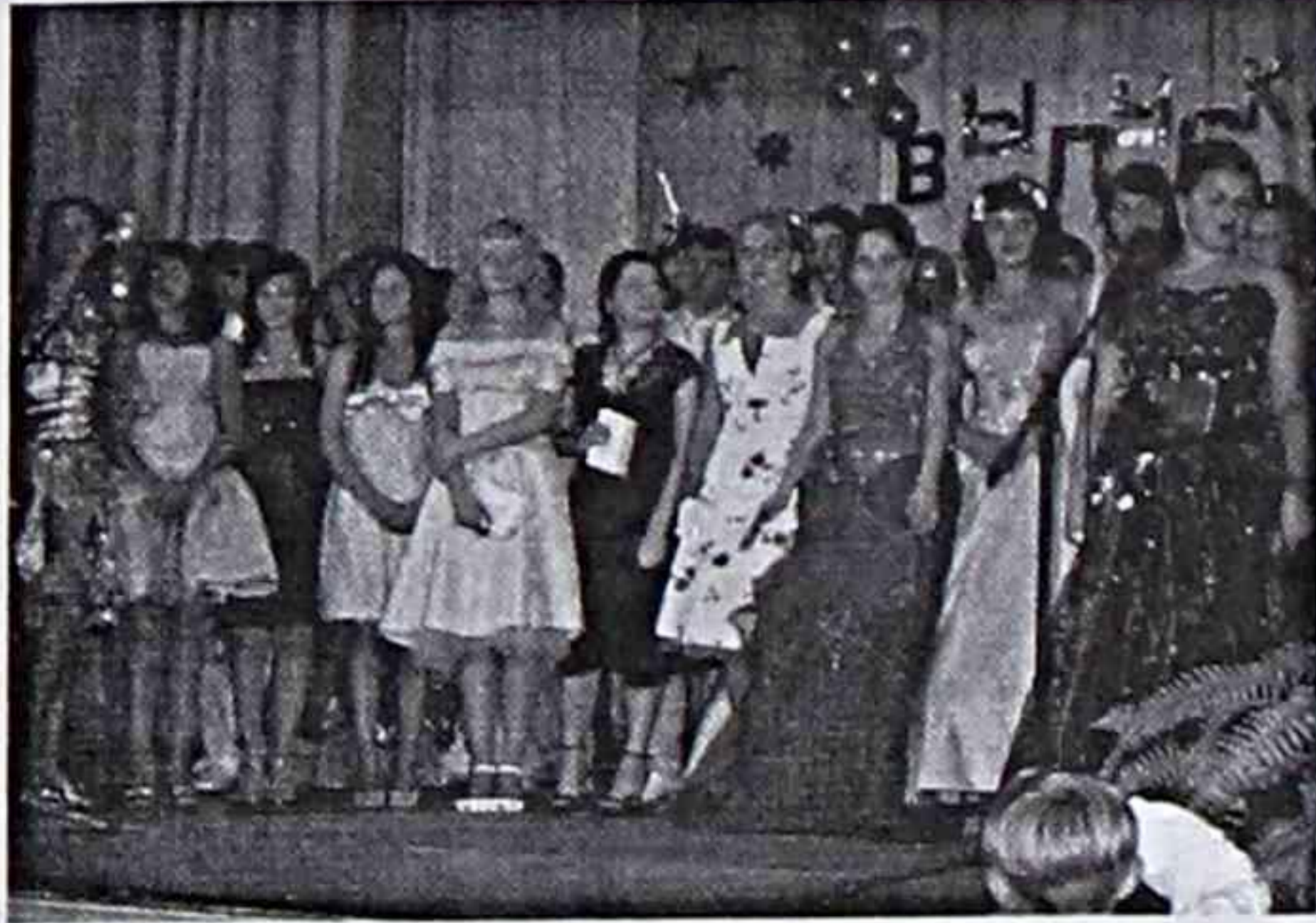
Выпускники школы № 27 п.Южно-Морской