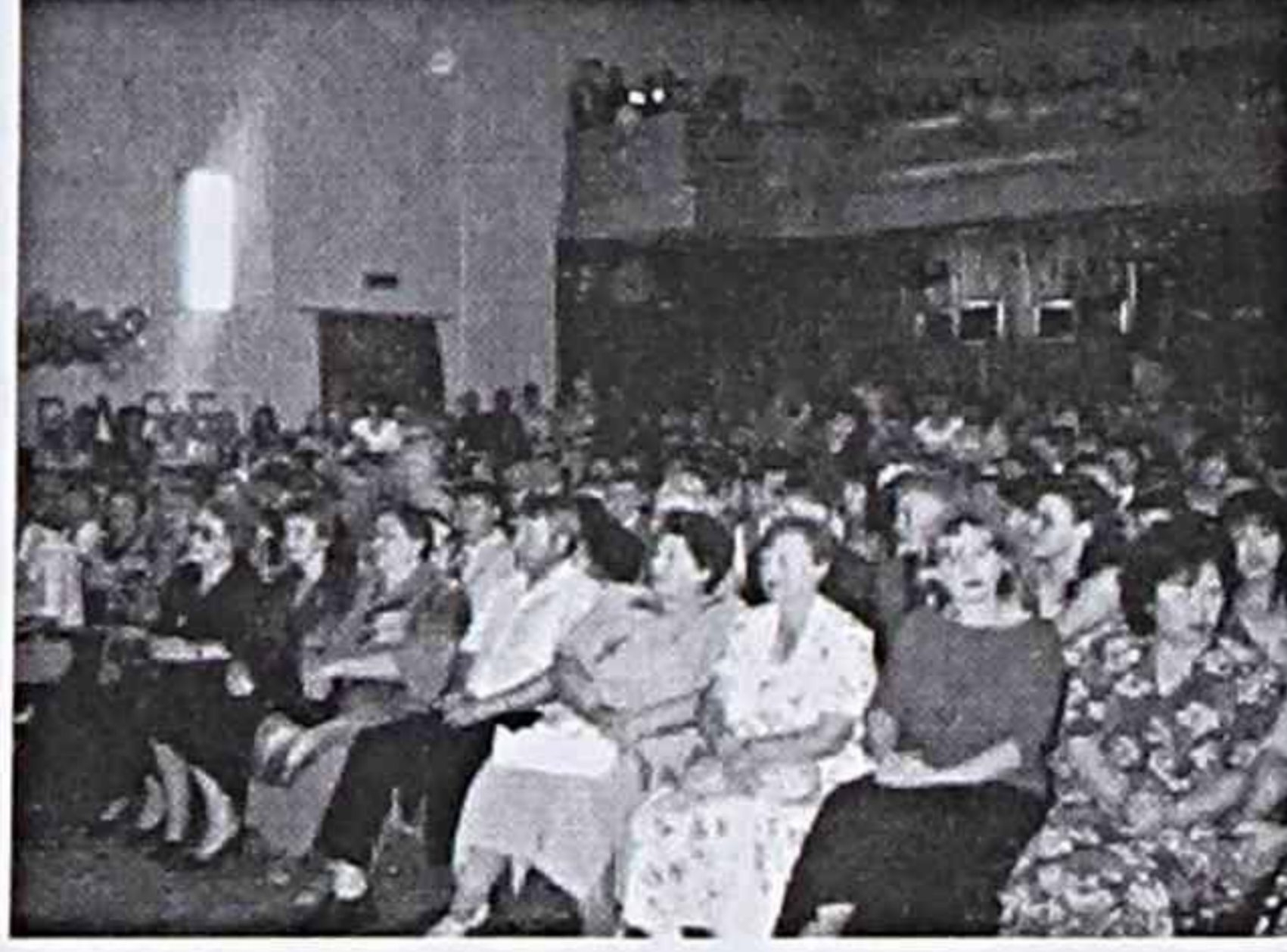
ДК Ливадия. Церемония вручения аттестатов. На первом плане учителя.

на конкурсе красоты «Мисс вселенной». Преодолевав волнение, ученики пели гимны учителям, учителя пели посвящения выпускникам. В теплой дружеской обстановке прошел праздник, который запомнится на всю жизнь.