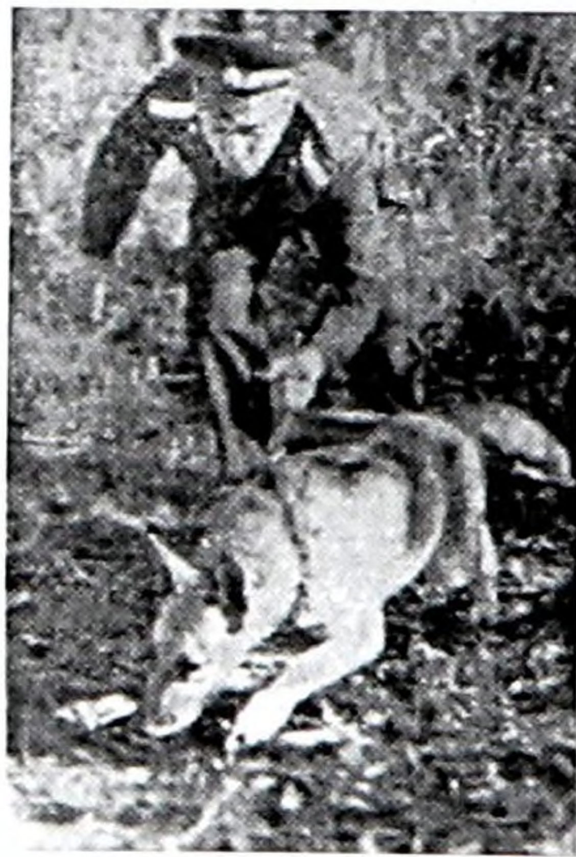
Проводник служебно-розыскной собаки Г.М. Мецерыков