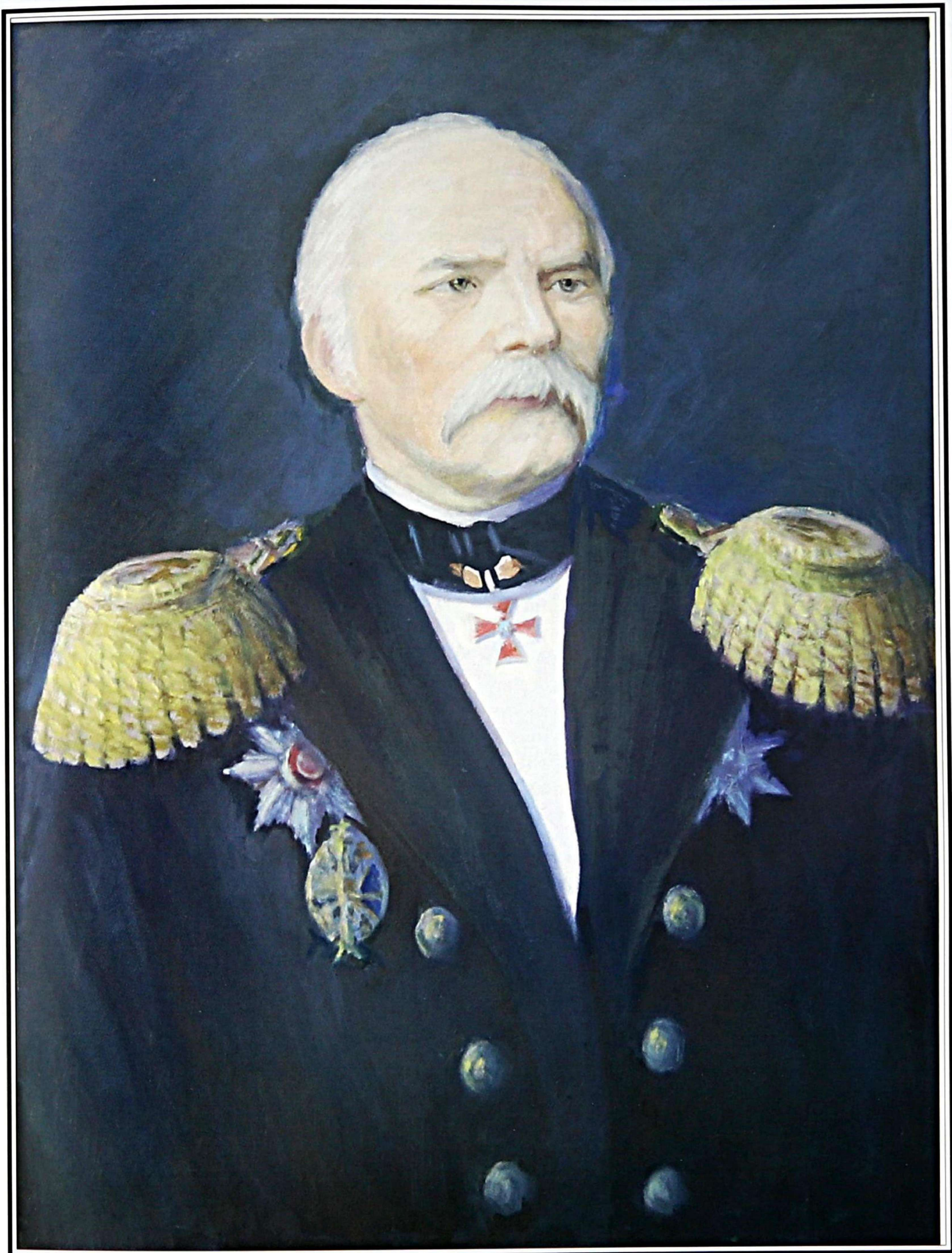
Адмирал Невельской Геннадий Иванович