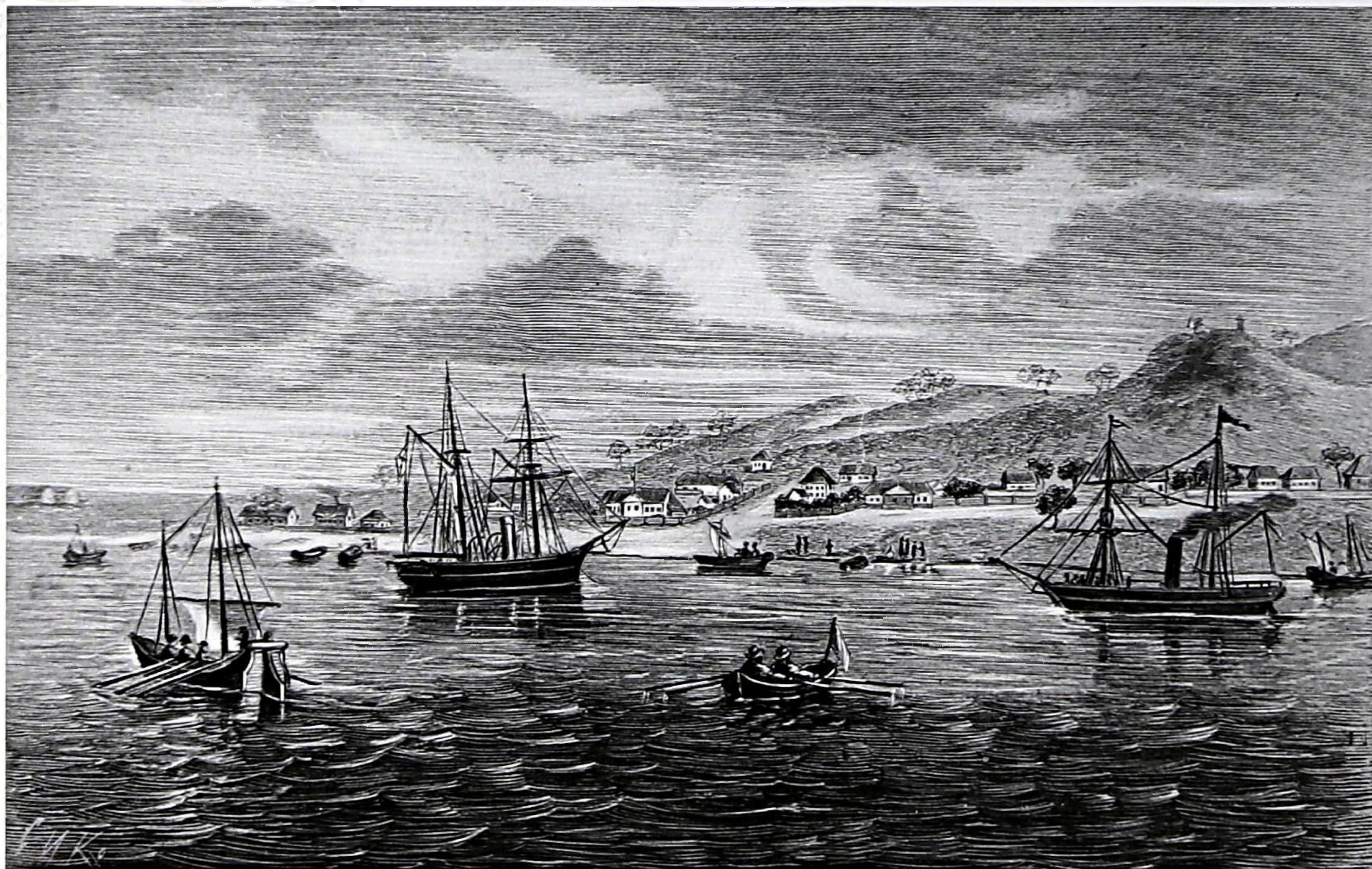
Владивосток в годы основания. Гравюра.

С февраля 1861 года – генерал-губернатор Восточной Сибири, с 1865 г. – командующий войсками Восточно-Сибирского военного округа, произведён в генерал-лейтенанты. В этот период значительное развитие получили земледелие в Амурской области, золотопромышленность,