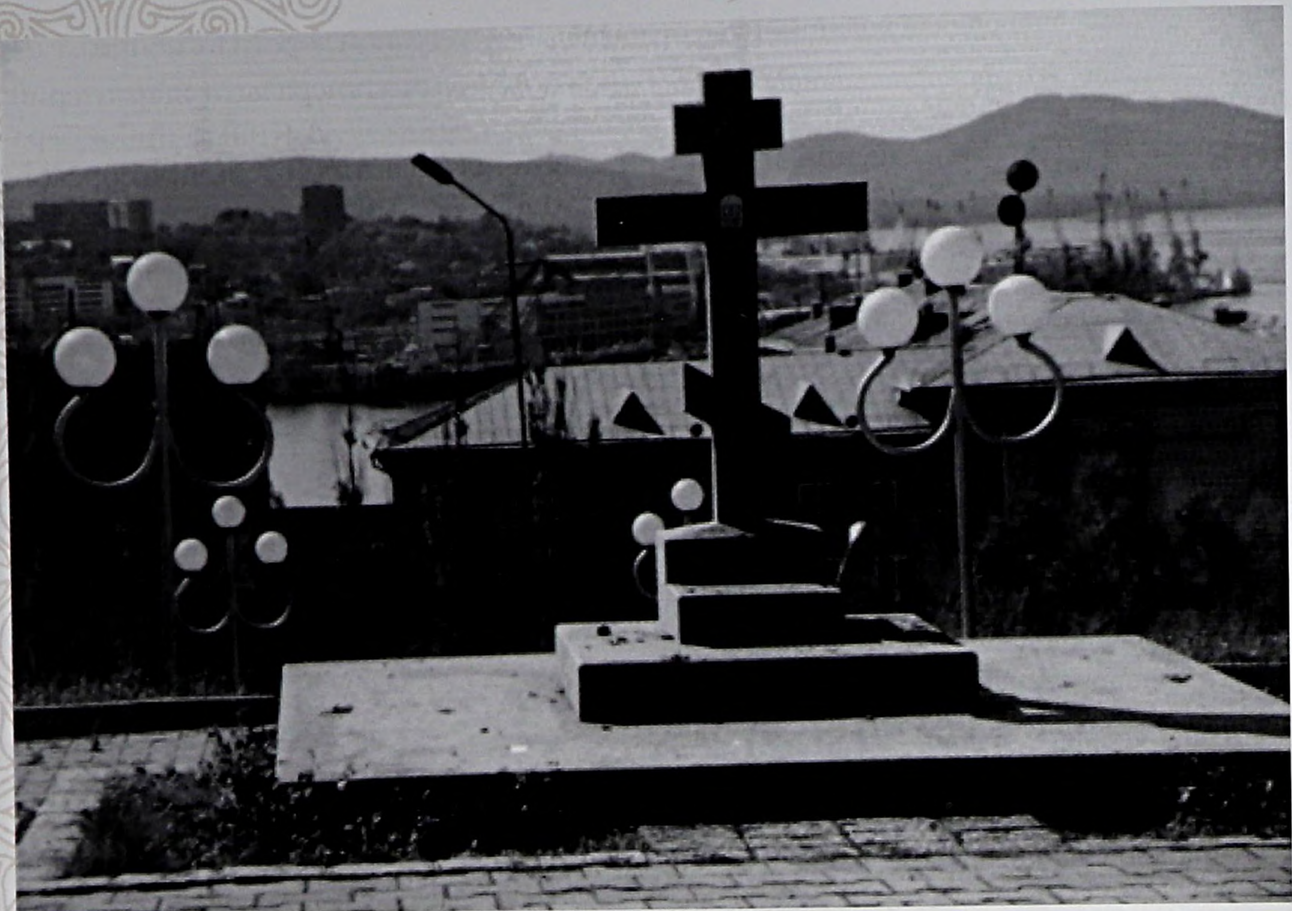
Памятник на месте перезахоронения останков графа Н.Н. Муравьева-Амурского во Владивостоке.

Амурского с декабристами, отбывающими ссылку в Восточной Сибири, не прошли ему даром. По настоянию царской охранки (третье отделение), он был в 1861 г. снят с генерал-губернаторского поста и закончил жизнь в добровольной эмиграции».