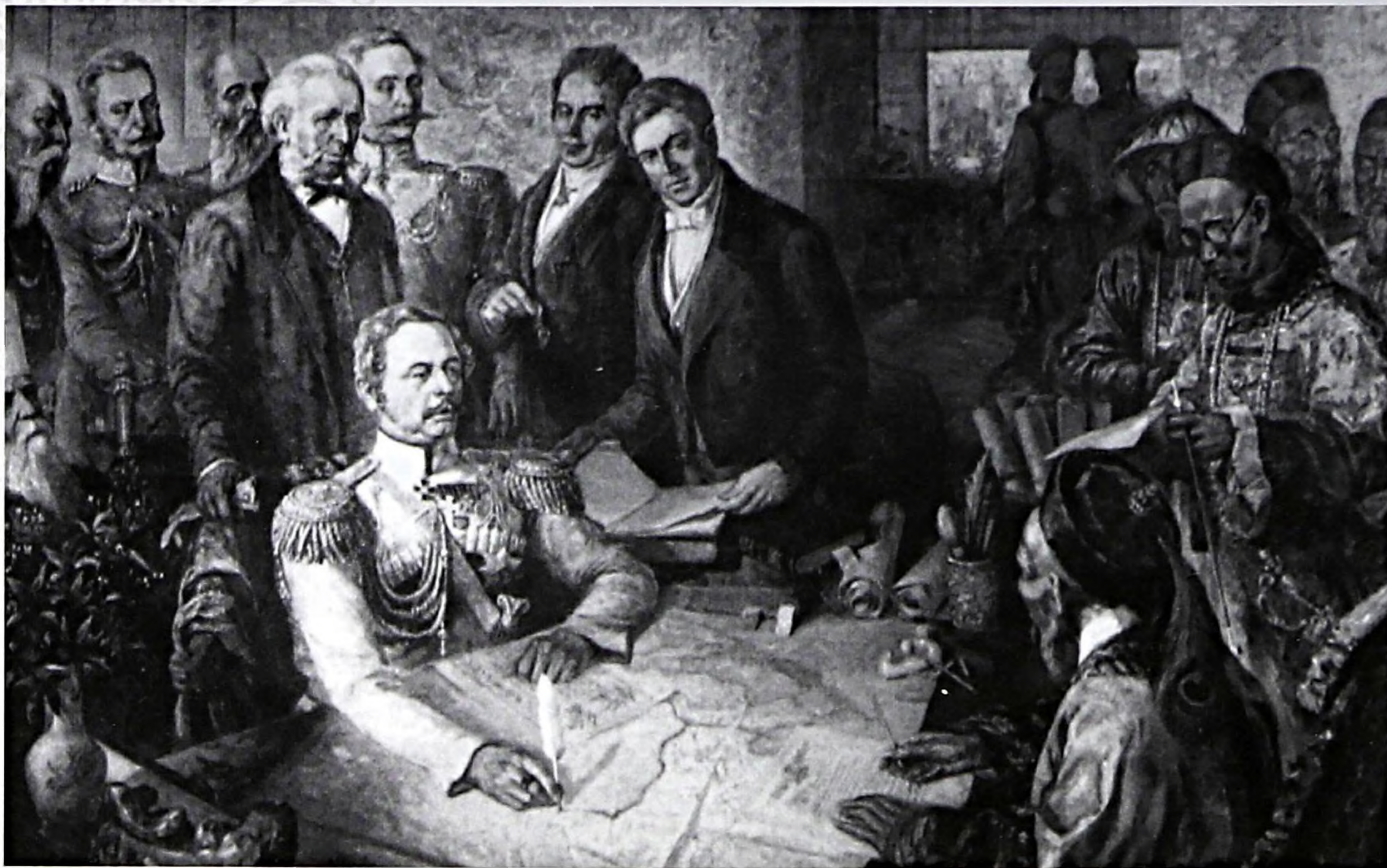
Подписание Айгунского договора. Репродукция.

В 1859 году на пароходе-корвете «Америка» при возвращении из Японии совершил плавание вдоль приморского побережья, в ходе которого получили свои названия залив Петра Великого, Амурский залив, Уссурийский залив, порт Владивосток, открыта бухта Находка.