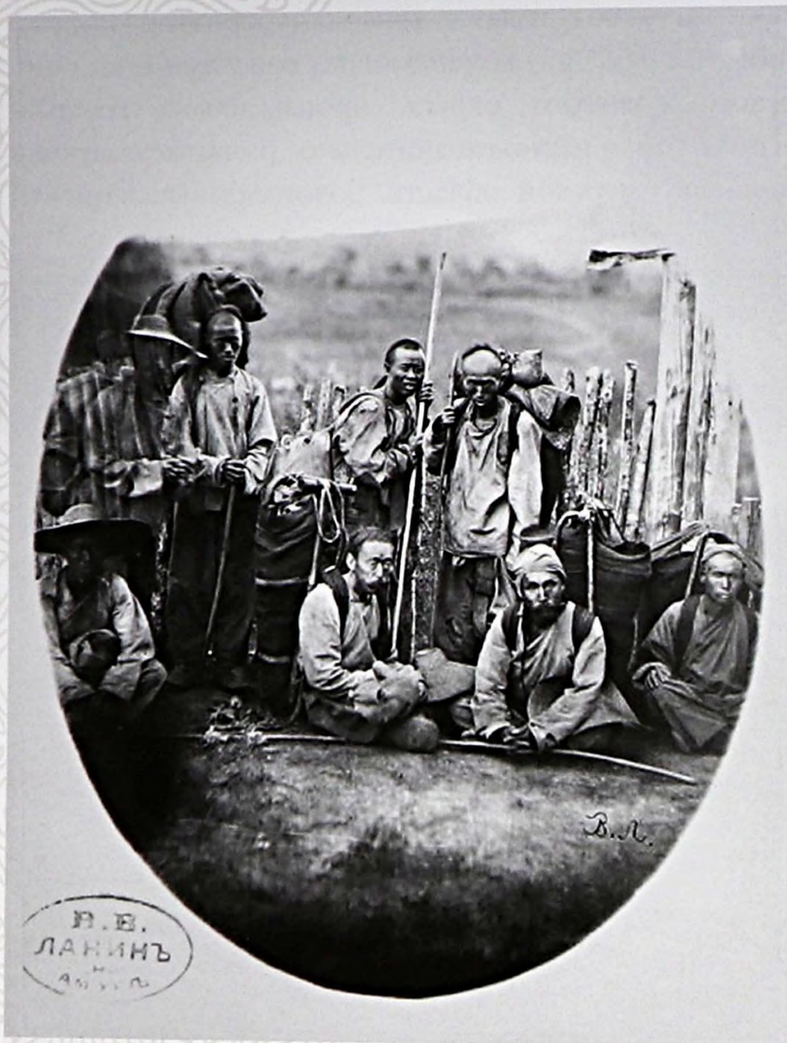
Китайские изгнанники (манзы) на приморской границе. XIX в.

И в то же время современники дают генерал-губернатору довольно нелестную оценку. М.И. Венюков в своей книге «Путешествия по Приамурью, Китаю и Японии» пишет: «Кор-