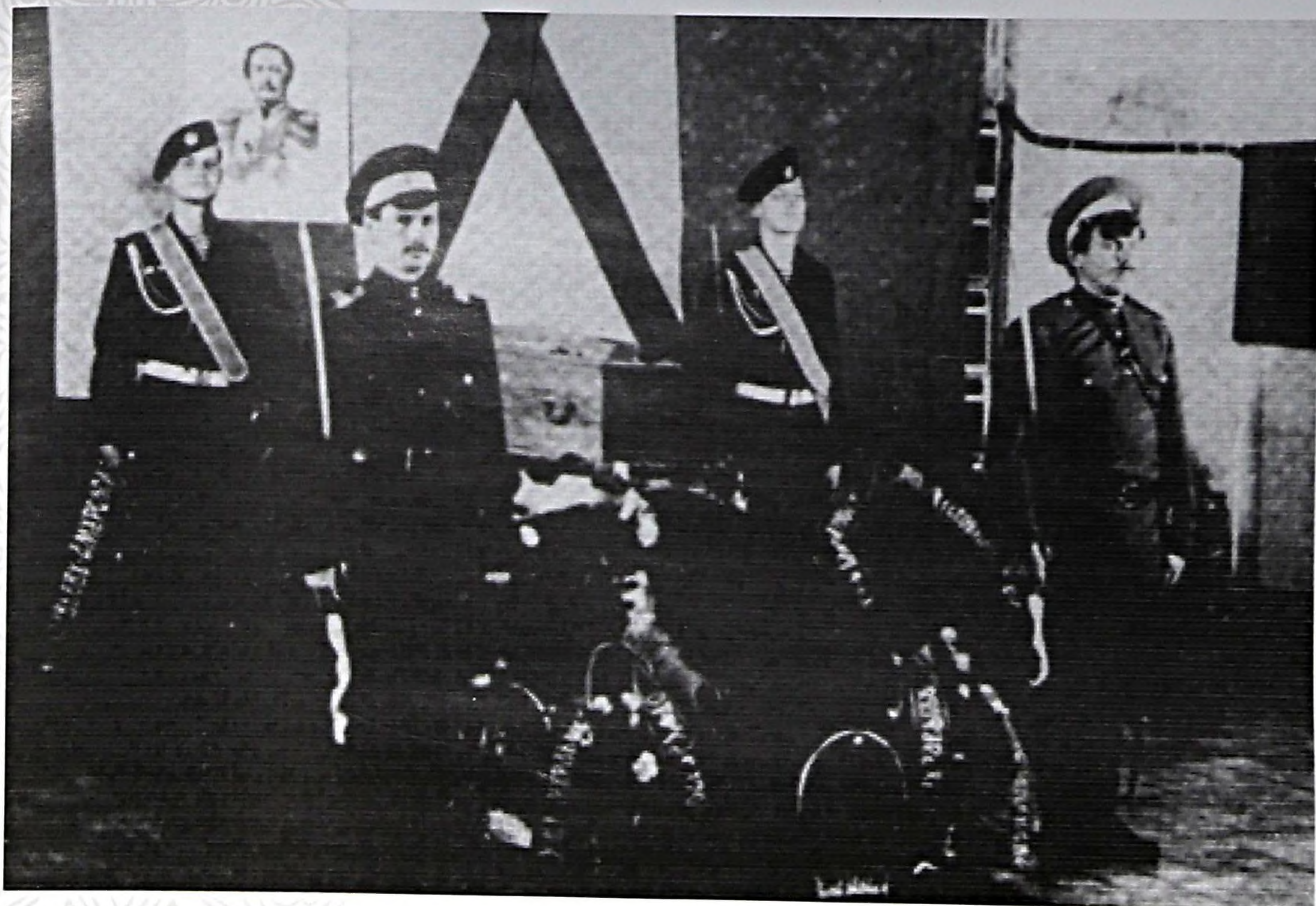
Почетный караул у праха графа Н.Н. Муравьева- Амурского, перевезенно- го для перезахоронения из Парижа во Владивосток. 1991 г.

Скончался 18 ноября 1881 года в Париже, похоронен на кладбище Монмаррта. В 1991 г. прах генерал-губернатора Н.Н. Муравьева-Амурского перенесён во Владивосток и перезахоронен в сквере на пересечении ул. Суханова и Лазо.