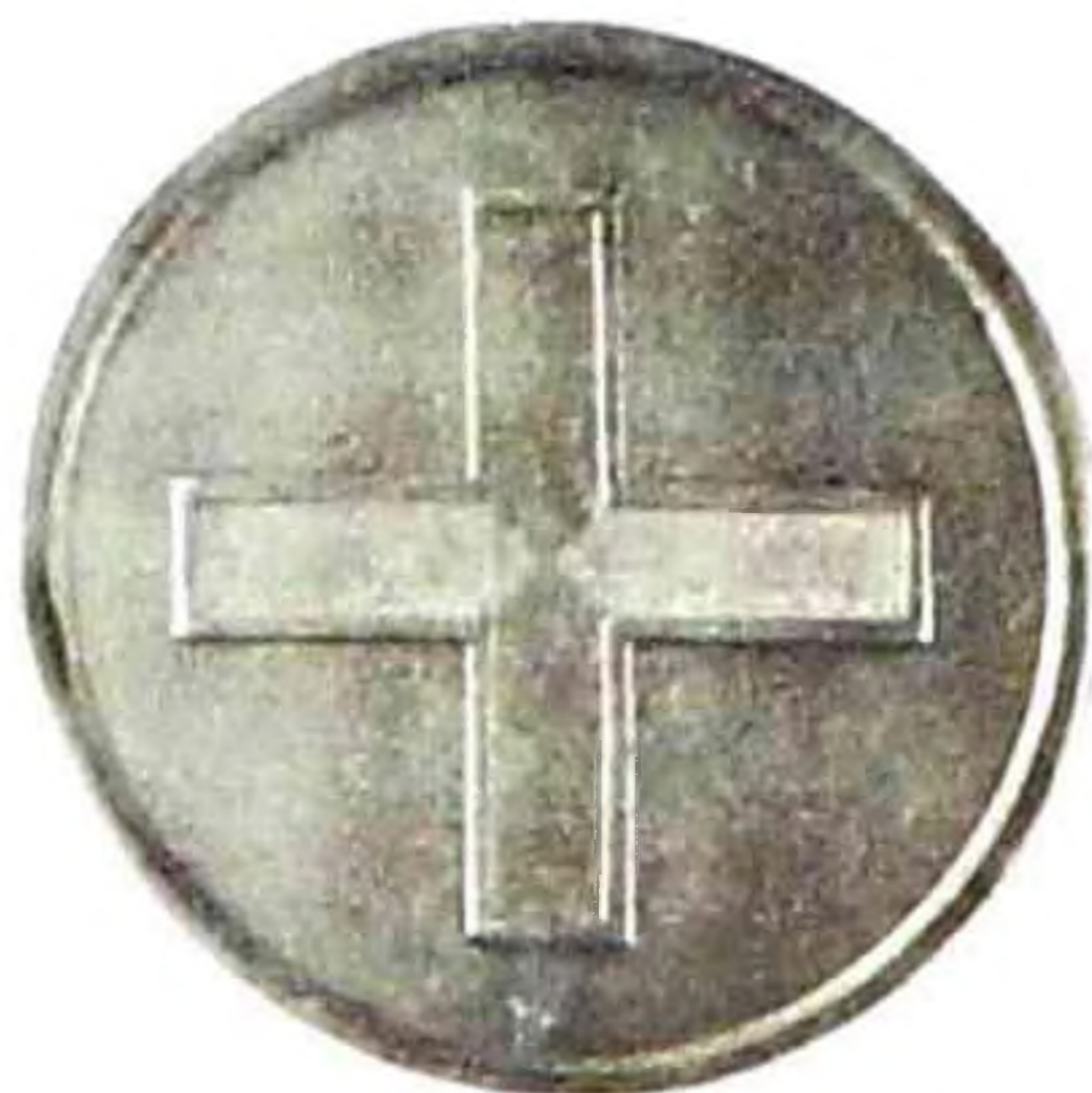
Медаль Павла I, 1801 г., серебро