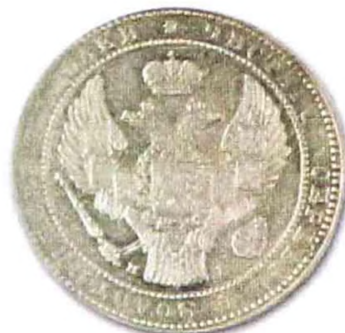
10 злотых (1 1/2 рубля), 1835 г., серебро, редкая