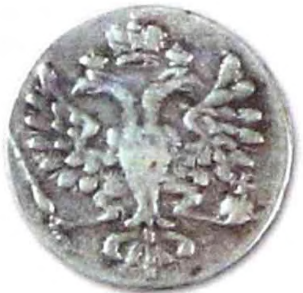
Полполтины Екатерины II, 1726 г., серебро, раритет