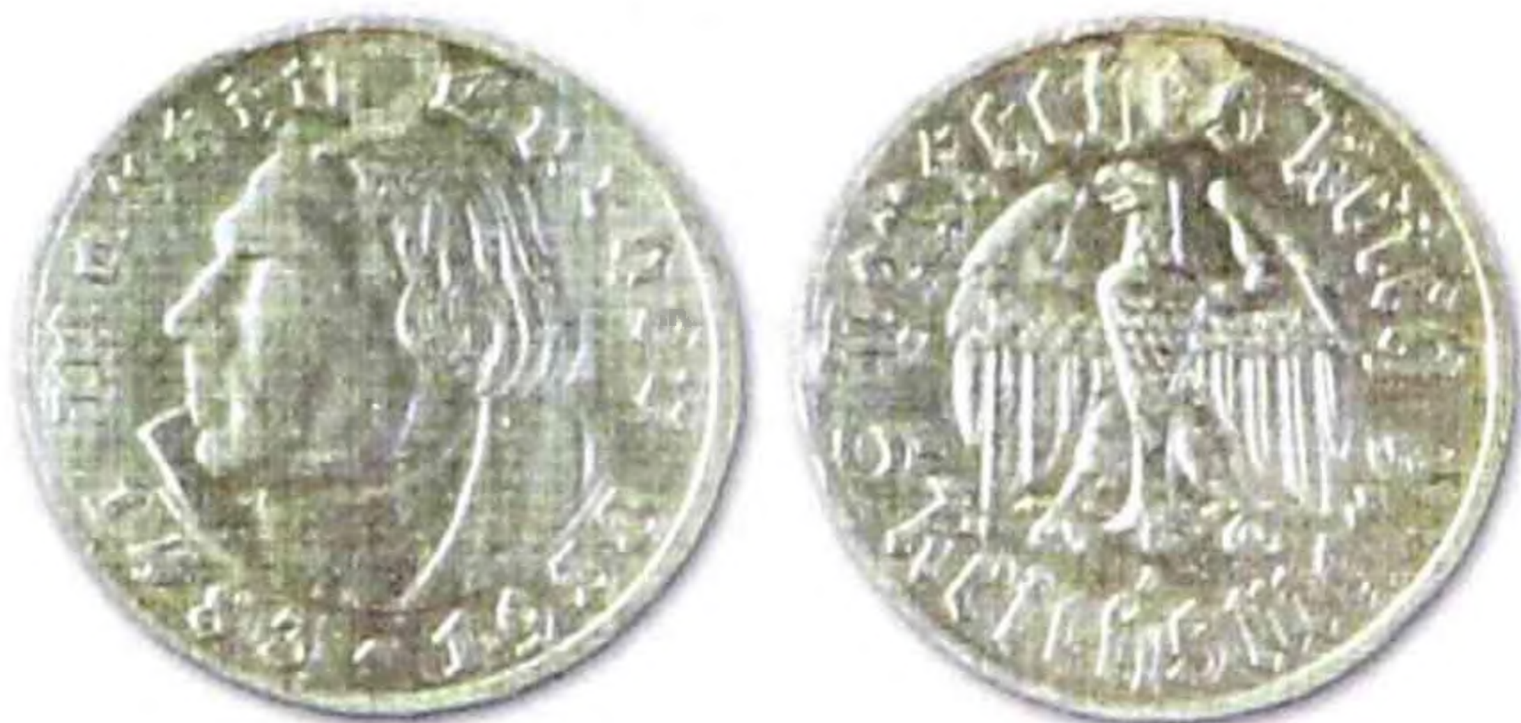
5 марок, Германия, Мартин Лютер, 1933 г., серебро