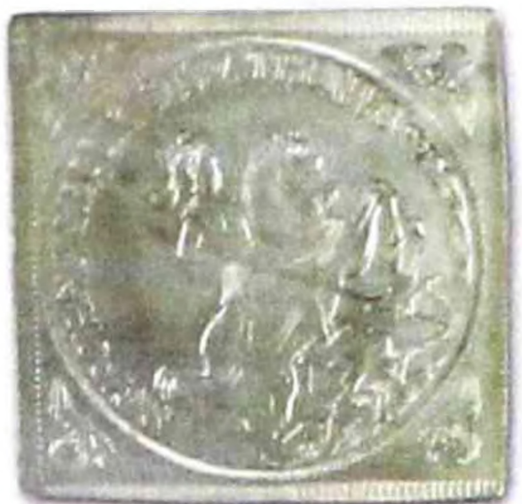
Охранная медаль (талисман моряка) с изображением Святого Георгия Германия (Рига), б/г, серебро