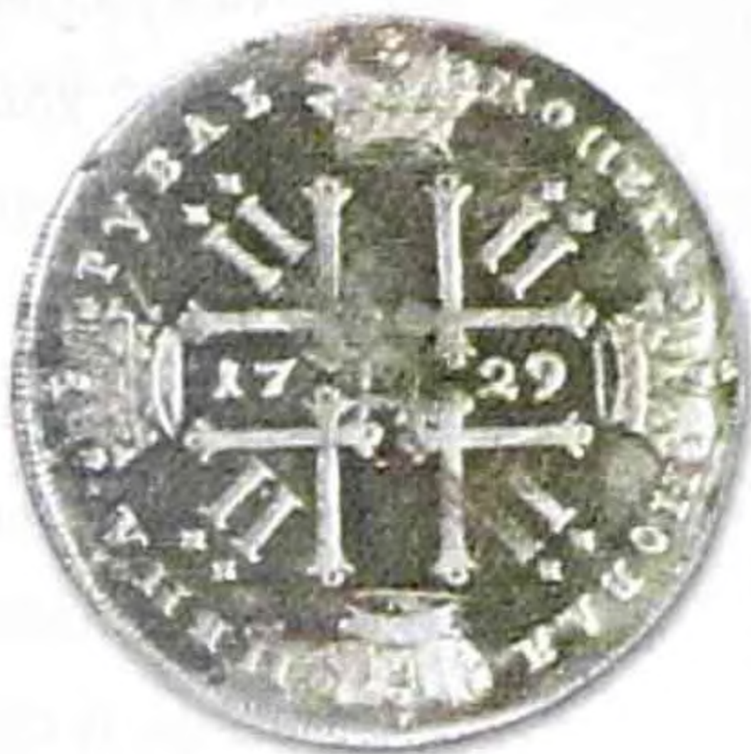
Рубль Петра II, 1729 г., серебро