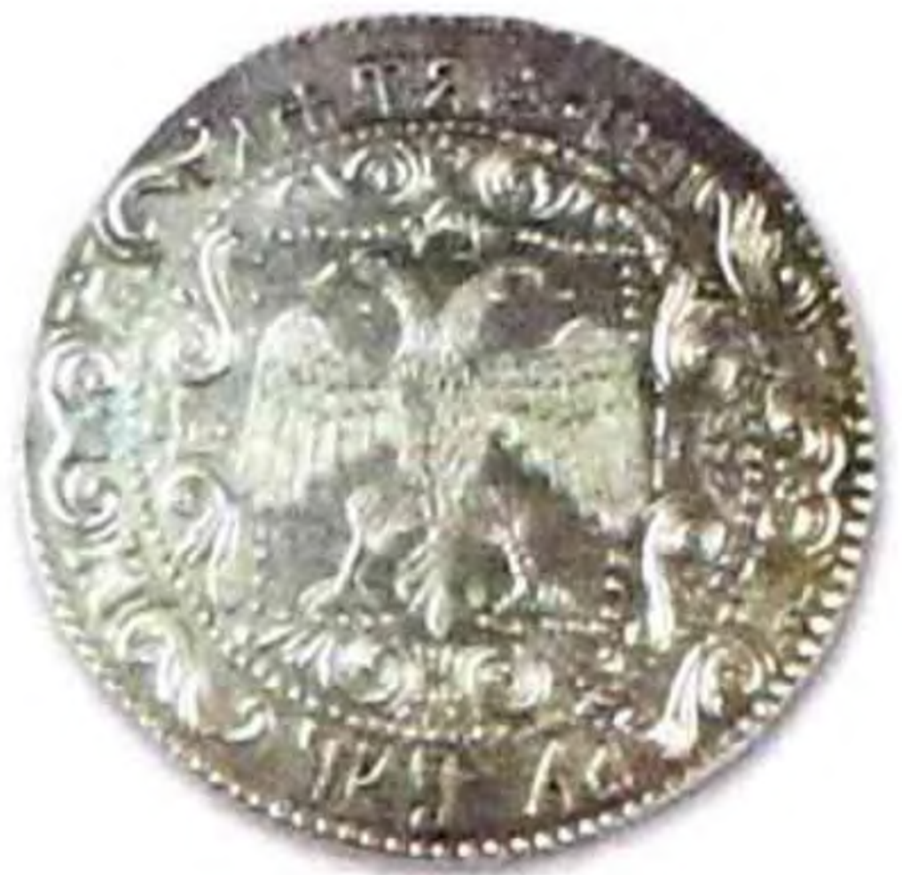
Рубль Алексея Михайловича, 1654 г., серебро, редкая