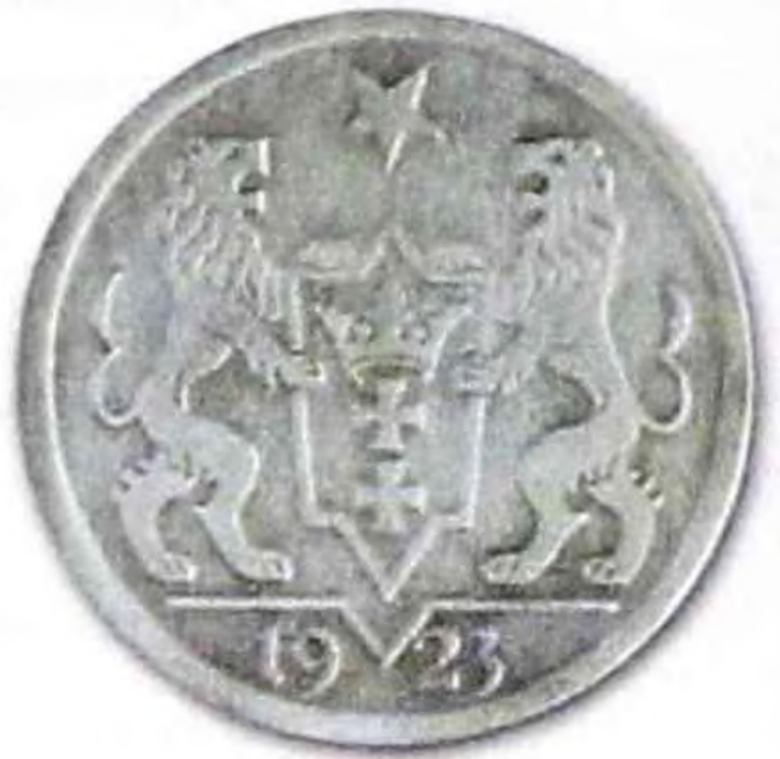
1 гульден, г. Данциг, 1923 г., никель