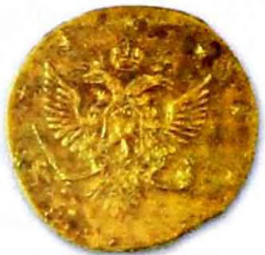
10 копеек, Россия, 1760 г., медь