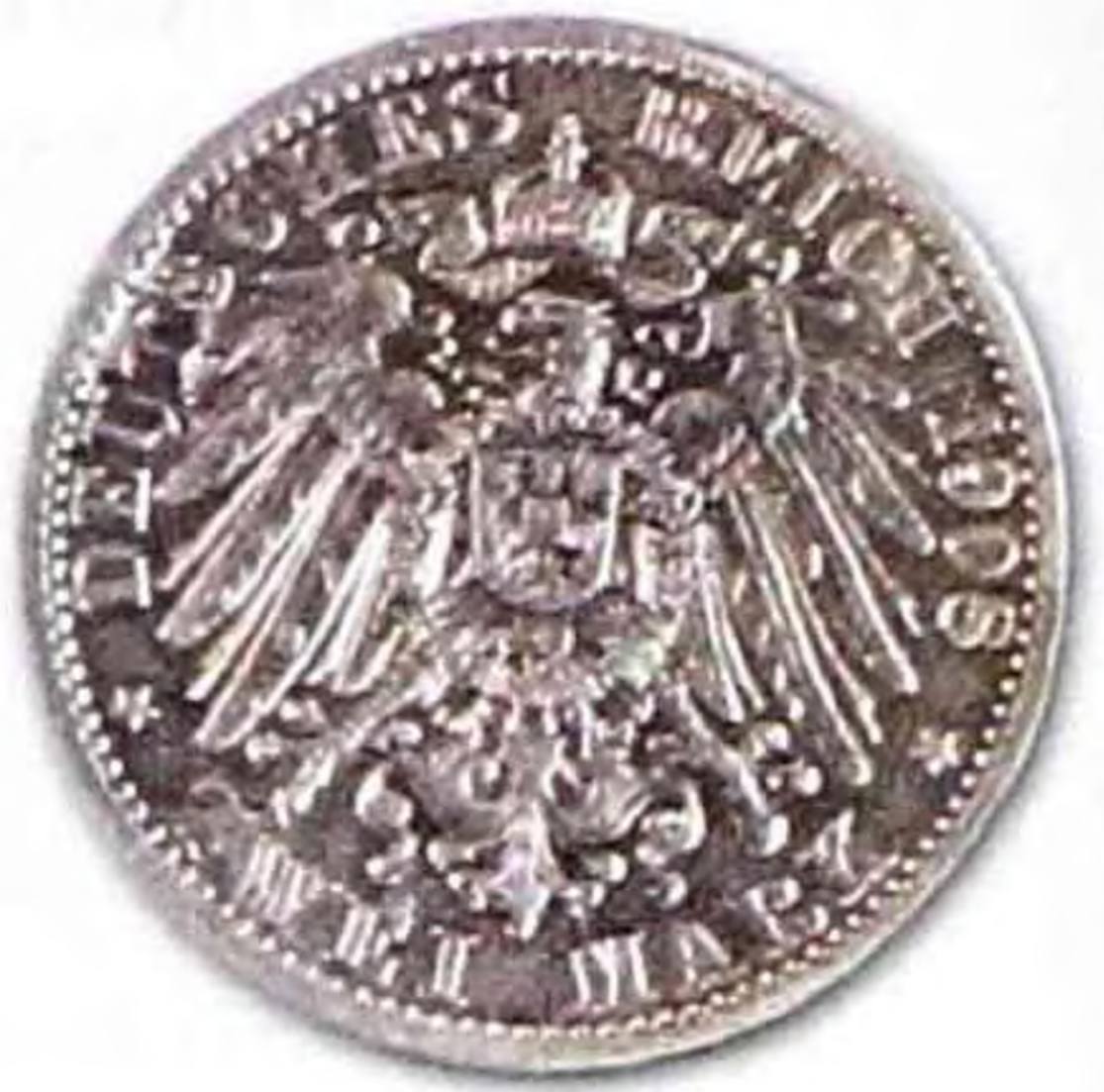
2 марки, 400 лет университету в Иене, 1908 г., серебро