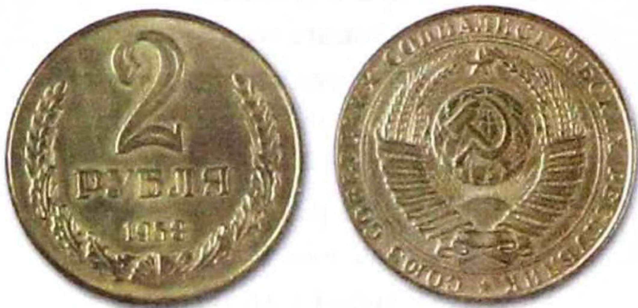
2 рубля СССР, 1958 г., никель, редкая