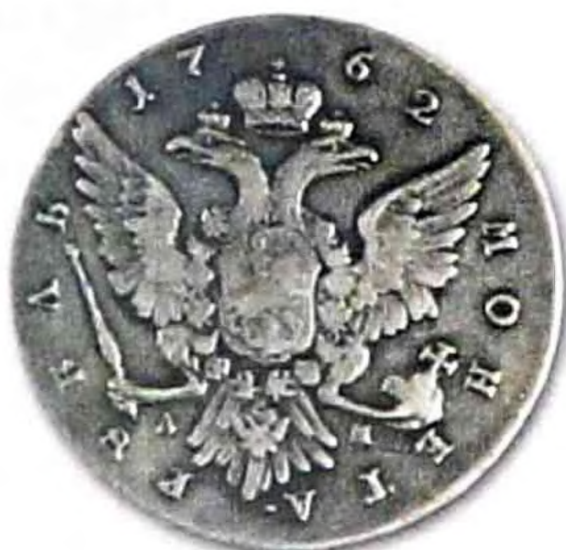
Рубль Петра III, 1762 г., серебро, редкая