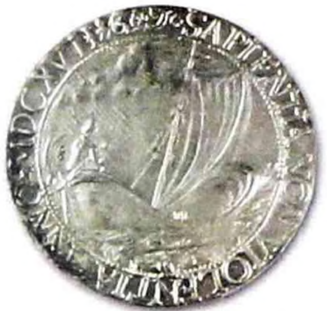
1 таллер, Филипп II, Испания, 1617 г., серебро, редкая