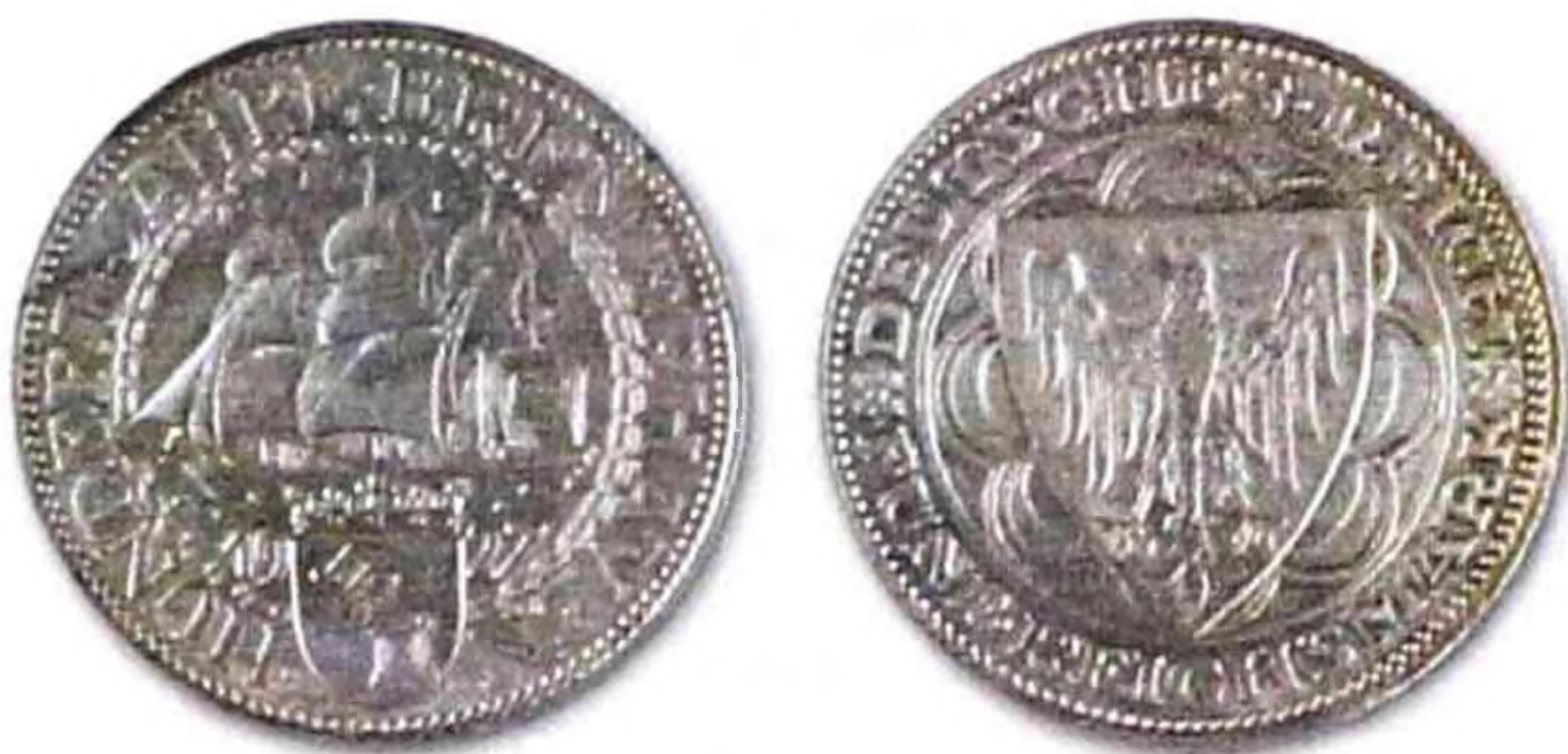
5 марок, 100 лет гавани Бремена, 1927 г., серебро