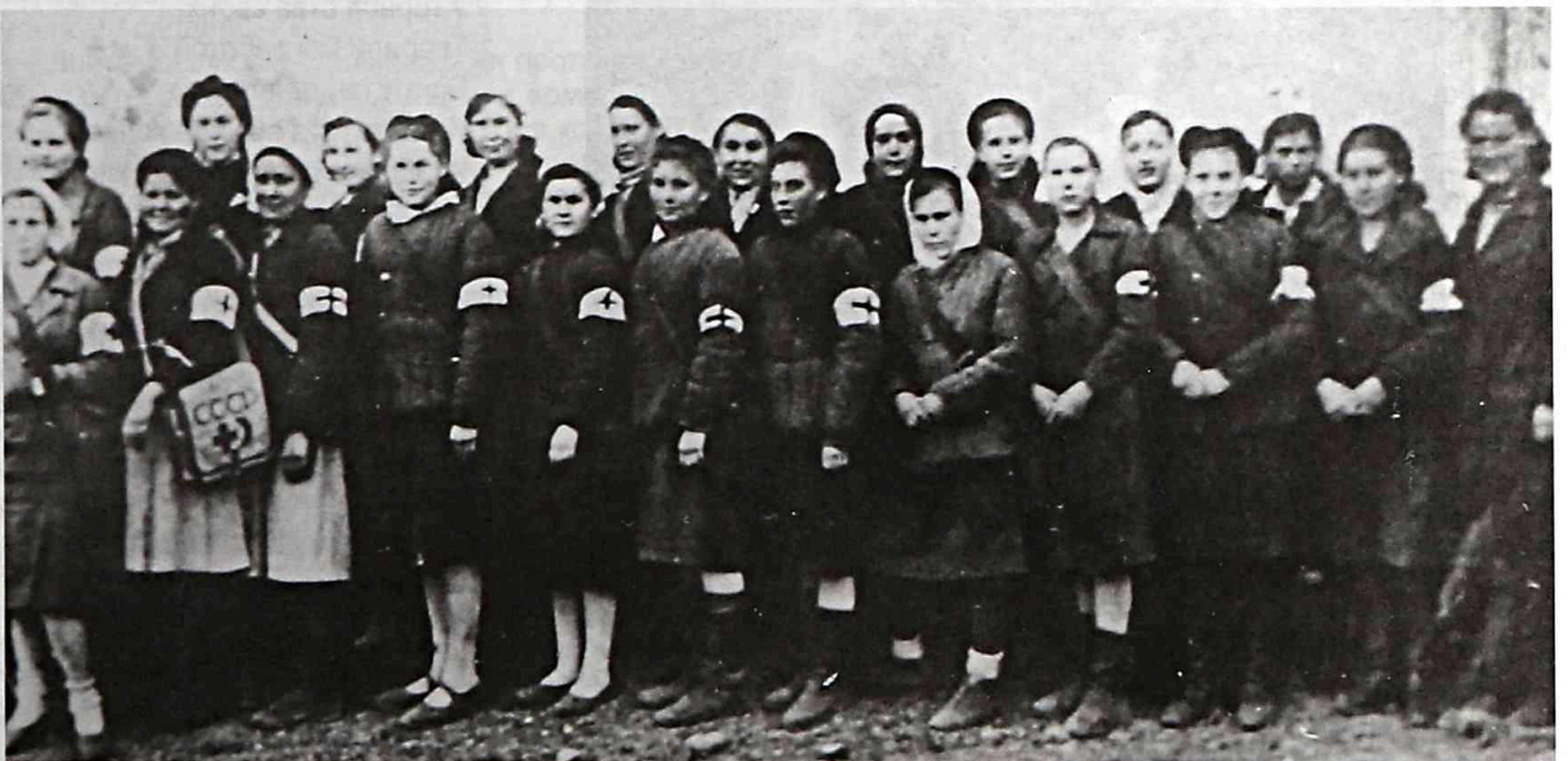
Сандружинницы завода «Аскольд», 1943 г.

В 1941 г. из цехов завода поднялся в небо первый учебно-тренировочный самолет УТ-2, ставший в годы войны учебной партой тысяч летчиков-фронтовиков.