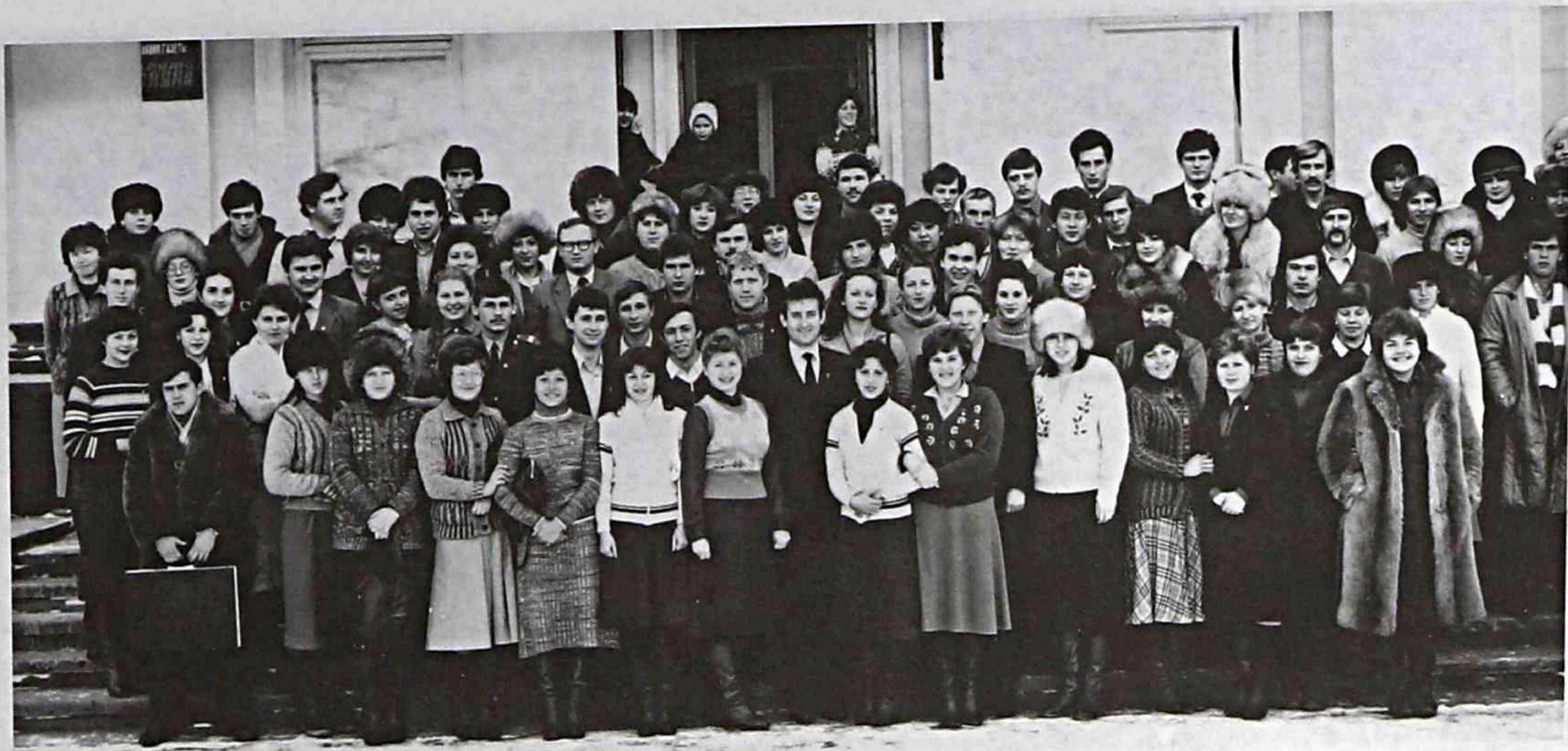
Кустовой семинар секретарей первичных комсомольских организаций г. Артема и Надеждинского района, 1984 г.

Совета Всесоюзной пионерской организации им. В.И. Ленина, награды получили и 27 правофланговых пионерских отряда города Артема.