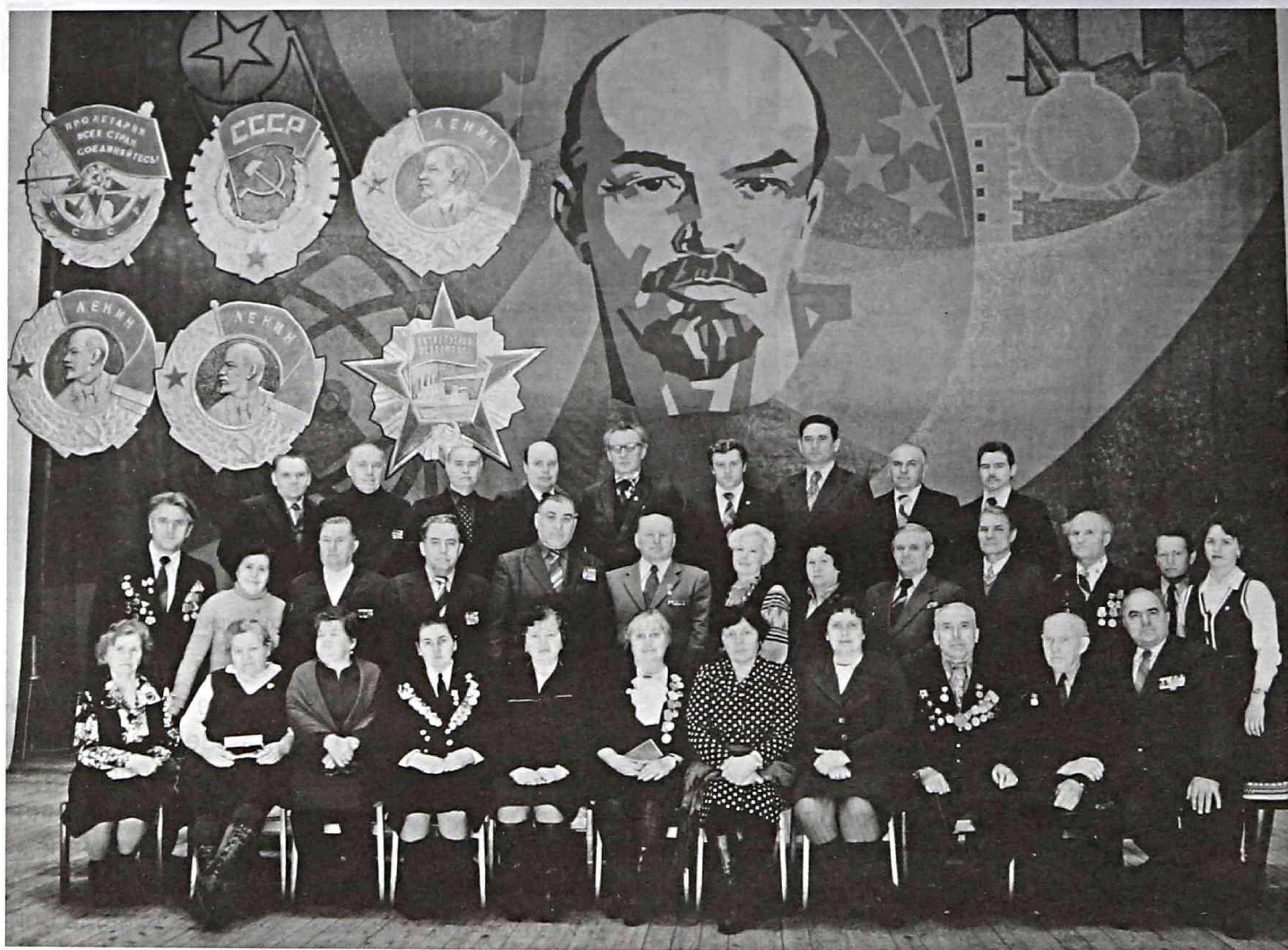
Ветераны комсомола г. Артема на городском слете, 1972 г.

1973 г. торжественно распахнул свои двери пионерский лагерь «Лазурный».