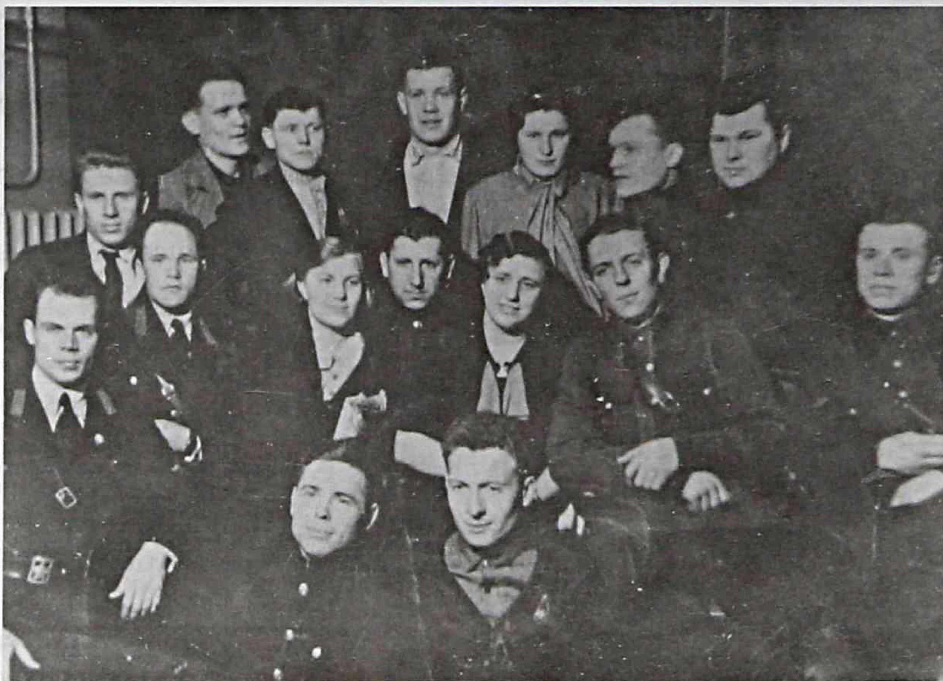
Делегаты Артемовской конференции ВЛКСМ