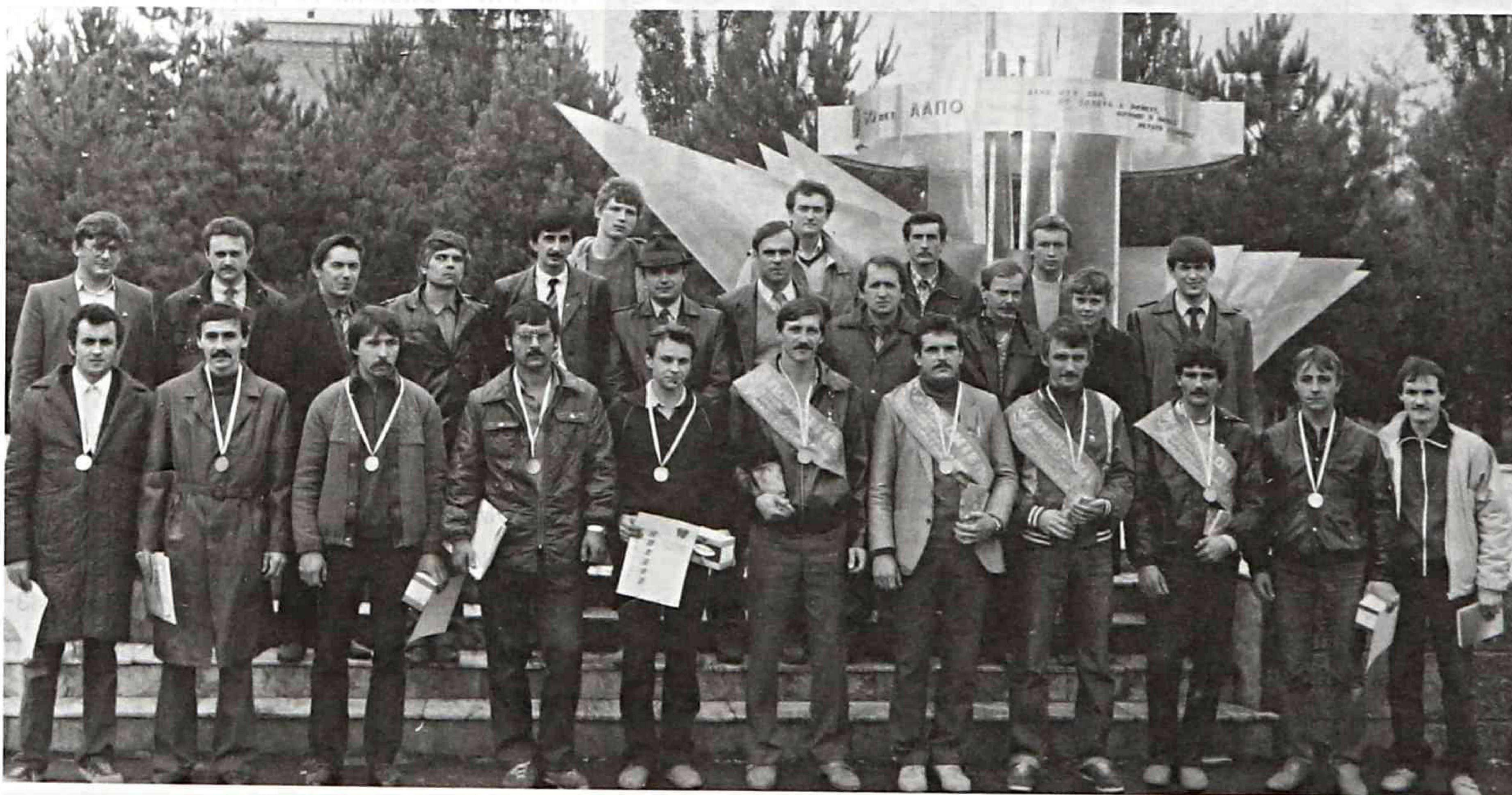
Участники конкурса профессионального мастерства в честь 50-летия комсомольской организации ААПО «Прогресс» им. Н.И. Сазыкина, 1987 г.

ского соревнования в честь 70-летия Великого Октября. В 1990 году комсомол машиностроительного завода завершил свою последнюю ударную комсомольскую стройку – возведение стадиона «Авангард». Секретарями комитета комсомола завода в различные годы избира-