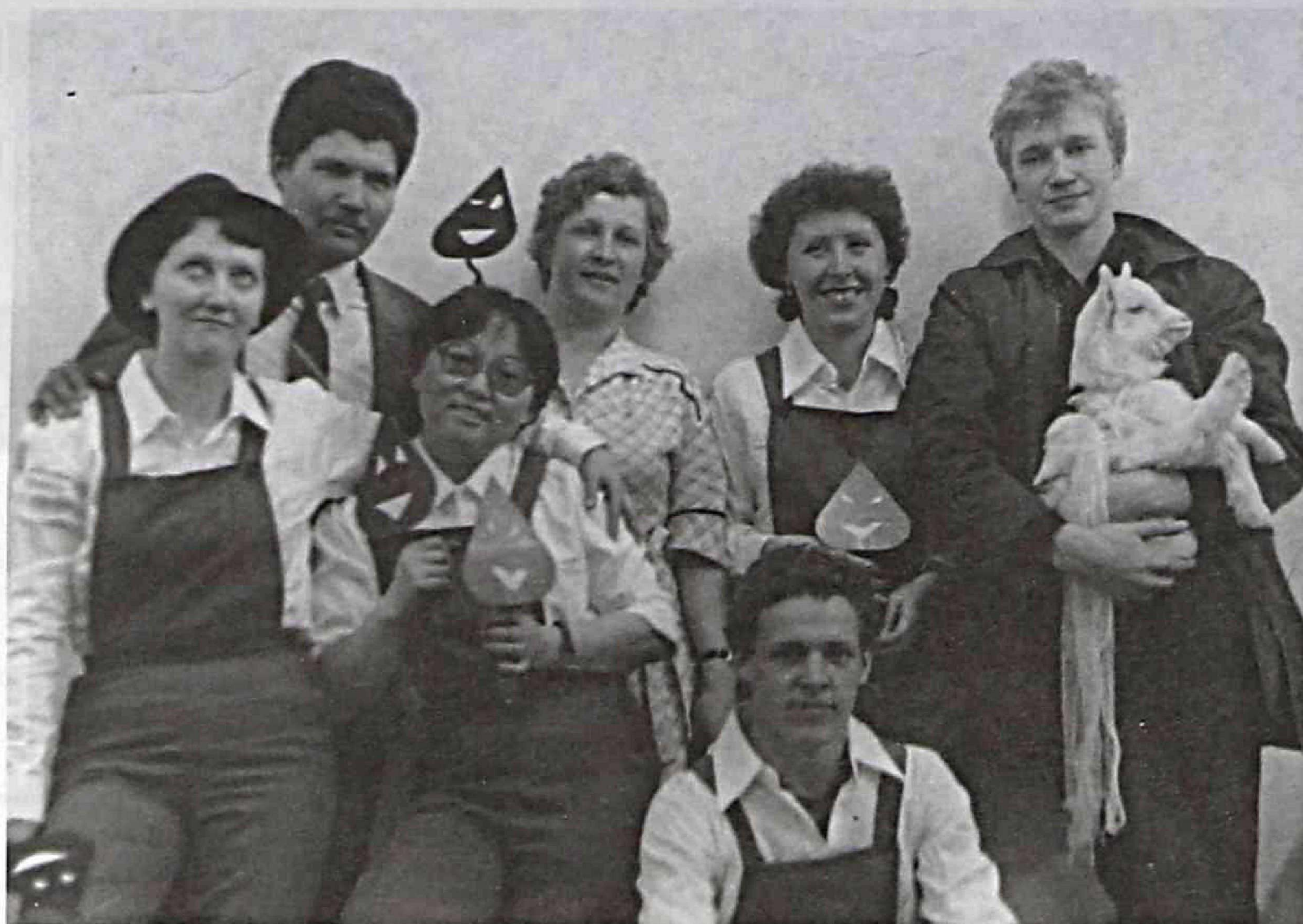
Команда КВН треста «Дальспецстрой» (1987-1988 годы)