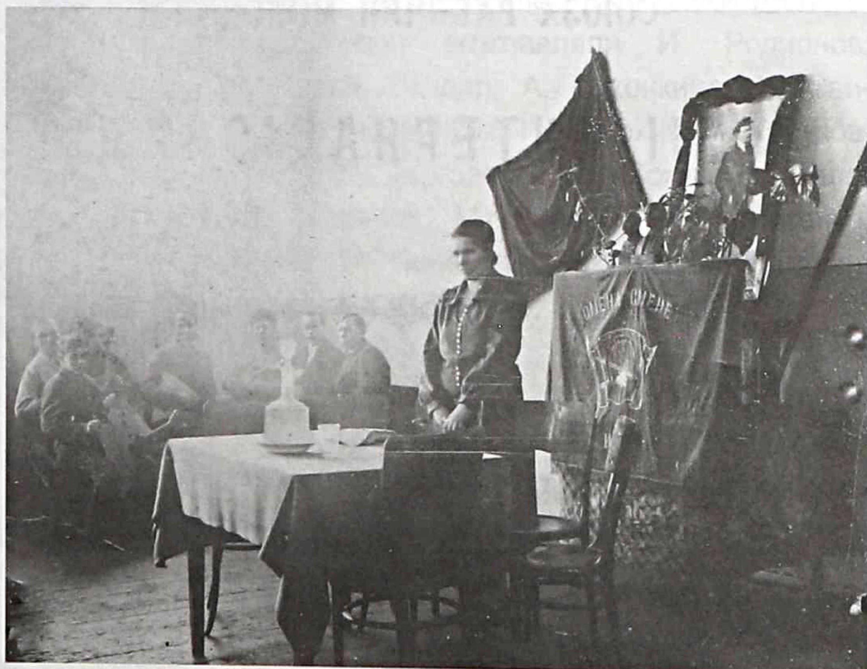
Комсомольское собрание к 10-летию со дня смерти В.И. Ленина в школе №3