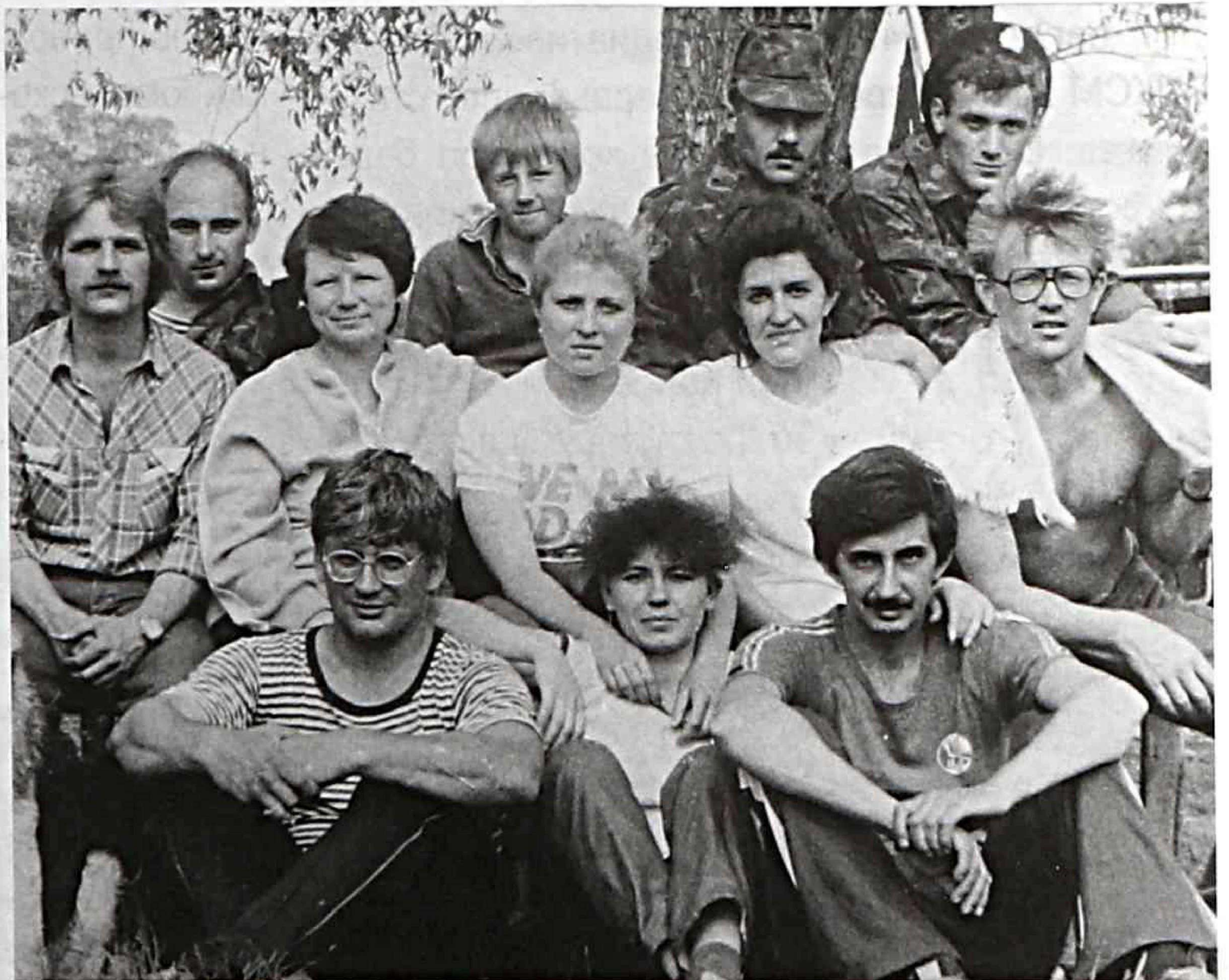
Организаторы туристического слета молодежи ААПО «Прогресс» с представителями подшефной воинской части

В 1984 г. победитель конкурса профессионального мастерства, сборщик-клепальщик