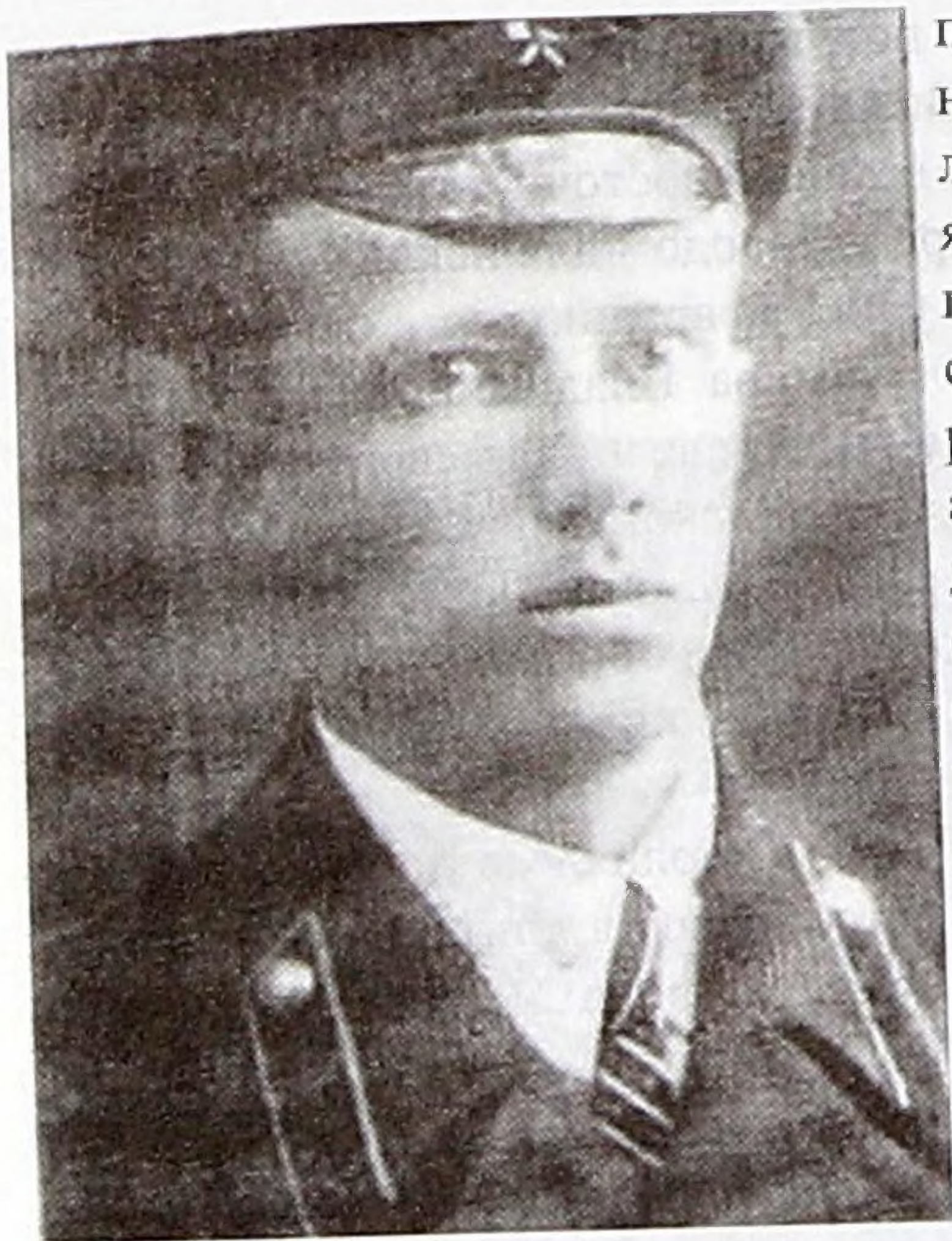
Владимир Владимирович Арсеньев Владивосток, 1926

правилу я всегда следовал, находясь подолгу в тайге, в лесоустроительных партиях, как старший по порубке просек, отвода лесосек, таксации лесных угодий. По роду своей лесной специальности мне много приходилось ходить по Уссурийской тайге, я имел нарезное оружие, но никогда не злоупотреблял им. Отец учил меня добру».