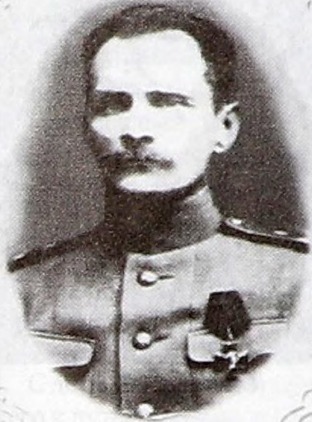
Владимир Клавдиевич Арсеньев 1872 – 1930гг.