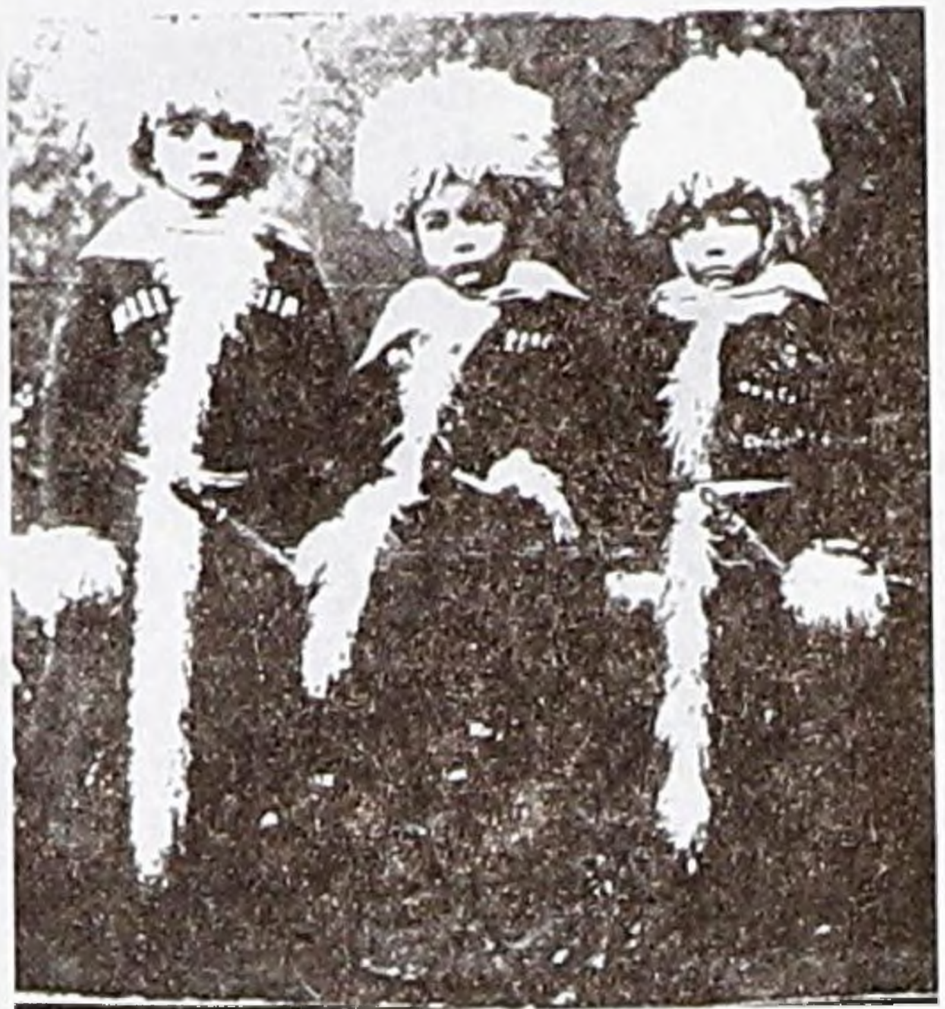
Владимир Арсеньев в центре

тантиновна, и семья поселилась в домике в «Гнилом углу».