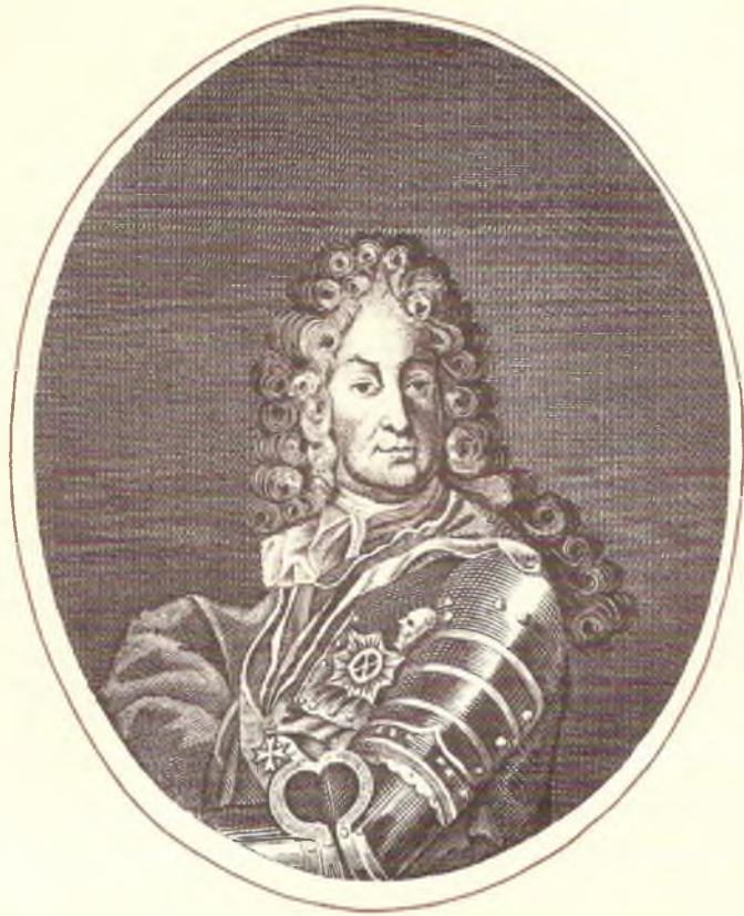
Le Comte Scherémiteff. Графъ Шереметевъ.