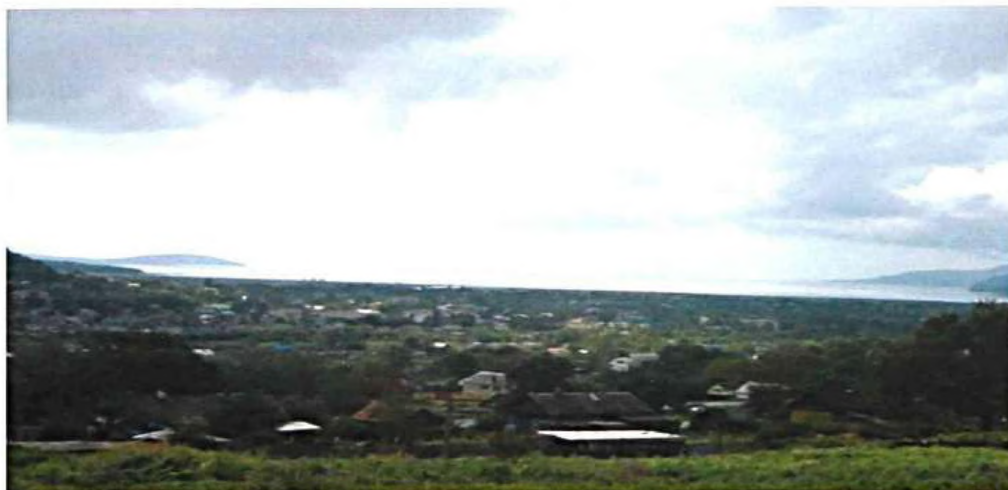
Шкотово вид с перевала