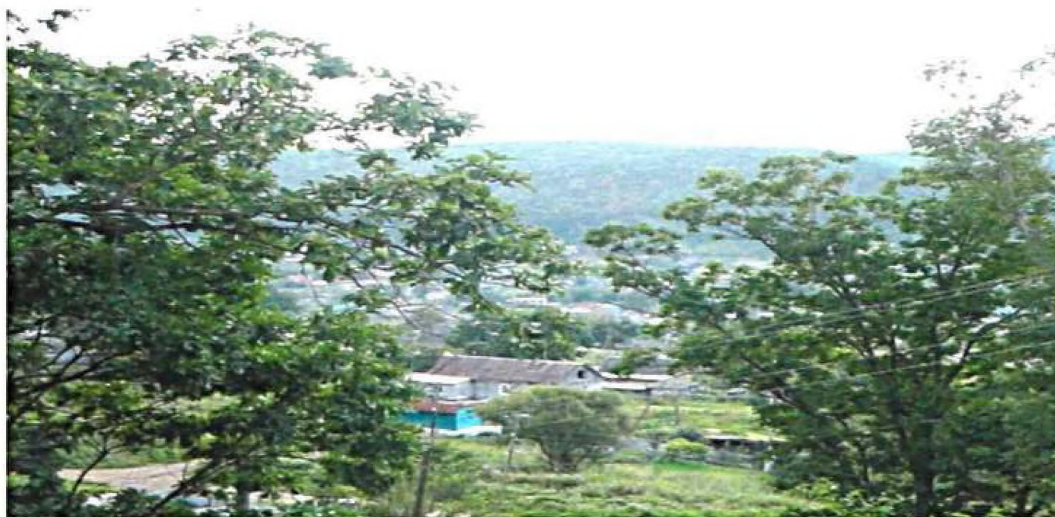
Шкотово. Сентябрьская зелень