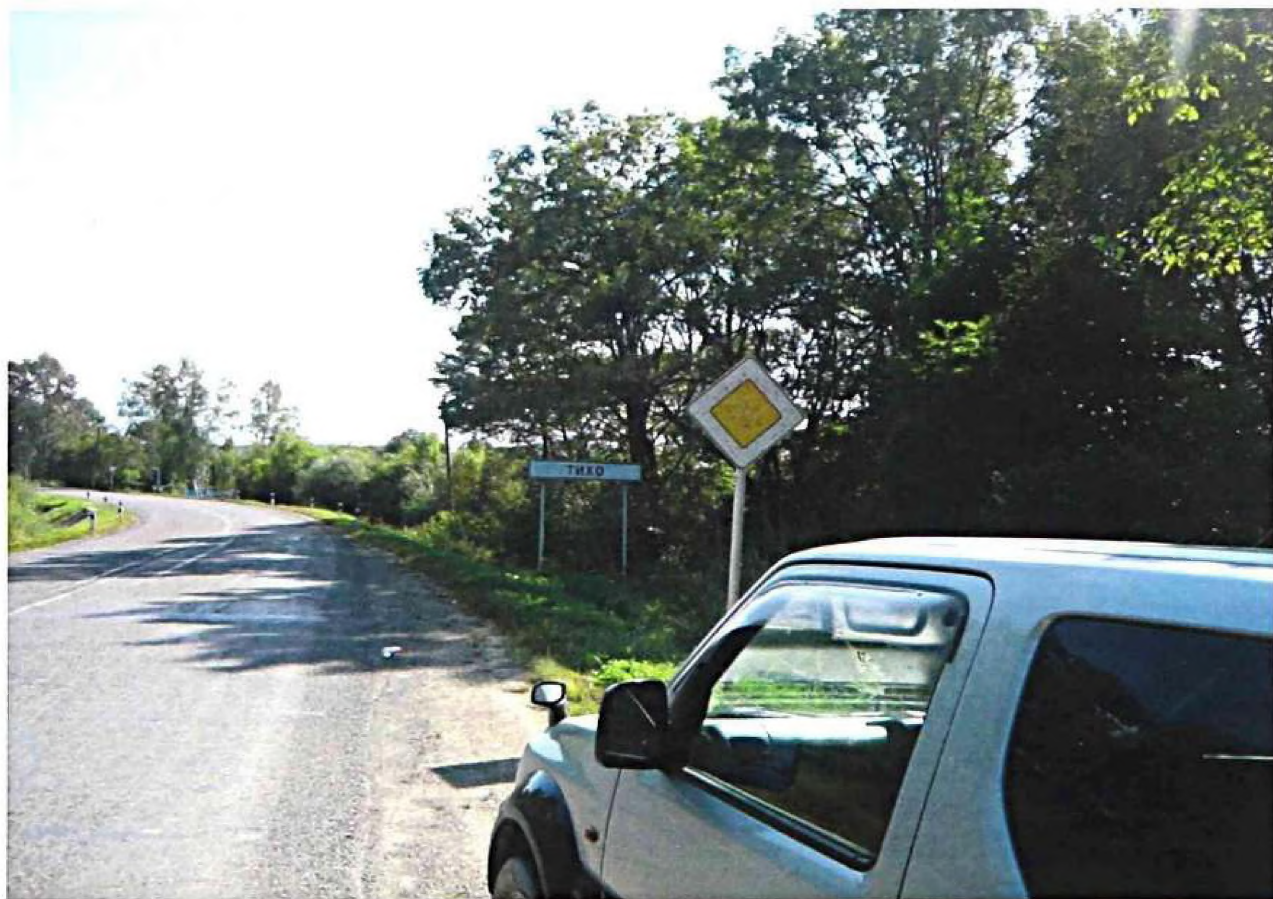
Впереди ещё более семисот километров пути...!