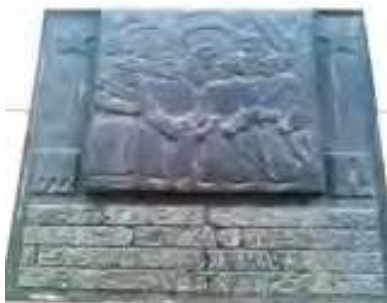
Мемориальная доска на улице 25 Октября

На мемориальной доске правда, если присмотреться, красноармейцы встречаются с какими-то человеко-собаками и инопланетянами в скафандрах (особенно две фигуры на заднем плане), да и подпись с трудом читается.