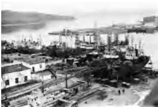
Старая территория ГСРЗ, конец 60-х годов

75 лет назад в Приморье был образован Гайдамакский судоремонтный завод (1947).