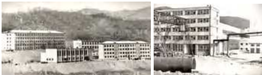
ПСРЗ, 70-е годы

«Приморрыбфлот», в состав которого вошел и Гайдмакский судоремонтный завод.