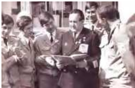
Г.Н. ХОЛОСТЯКОВ в окружении делегации комсомольцев из Находки, Калининград, 70-е

Георгий Никитович - кавалер двух орденов Ушакова I степени - высшего «флотоводческого» ордена СССР (даты указов Президиума Верховного Совета СССР о награждении - 20 апреля и 28 июня 1945 г.), а 9 мая 1965 г. ему присвоено звание Героя Советского Союза.