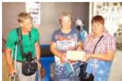
Экспедиции в Сергеевку и Николаевку, 2021г.

Стало традицией публиковать лучшие работы юных исследователей в «Записках клуба». Работая с архивами и другими источниками, родоведы стремятся оставить своим потомкам серьезные исследования по поиску своих родовых корней. Эти изыскания зафиксированы в первую очередь в «Записках клуба «Находкинский родовед».