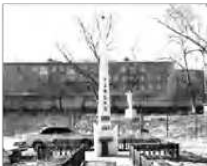
Обелиск в честь вручения рыбокомбинату «Тафуин» Красного знамени Комитета обороны СССР в 1942 г.