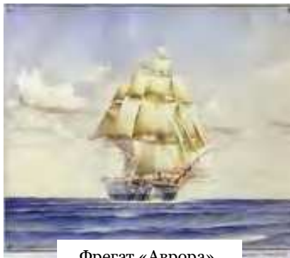
Фрегат «Аврора». П.П. Куянцев

Наряду со своей работой на флоте, П. П. Куянцев занимался рисованием, специализировался в акварели, работал в жанре марини. Океан и живопись — вот две вещи, которые можно было назвать главной любовью Куянцева.