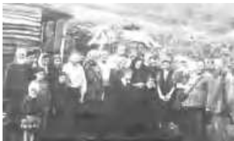
Жители деревни Лагонешты, 1957г.

Самые ранние документы о деревне Логанешты, найденные краеведами в архивах, датируются 1907 годом, когда постановлением Приморского Областного по Крестьянским делам