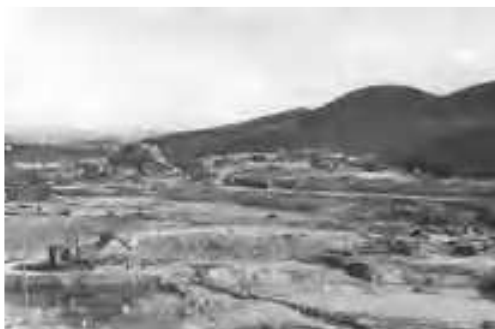
ПСРЗ. Земляные работы на месте будущего слипа 50-е годы

По окончании второй мировой войны в Министерстве рыбной промышленности восточных районов СССР создается общий проект развития рыбного промысла на Дальнем Востоке. Для Находки предусмотрен план строительства рыбного порта, судовой верфи и жилых поселков.