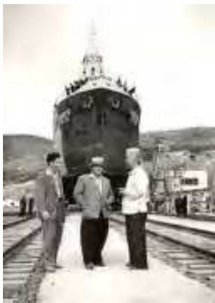
Фото 1958 г. поднятого на слип судна Колыма, найденное на сайте завода.

В январе 1958 г. на завод пришли первые специалисты, выпустившиеся из Дальневосточного мореходного училища.