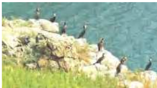
Остров Лисий.

Остров Лисий – одна из достопримечательностей Находки. Остров Лисий – останец древнего затопленного горного хребта, который отделился от материка в результате общего погружения суши в период образования