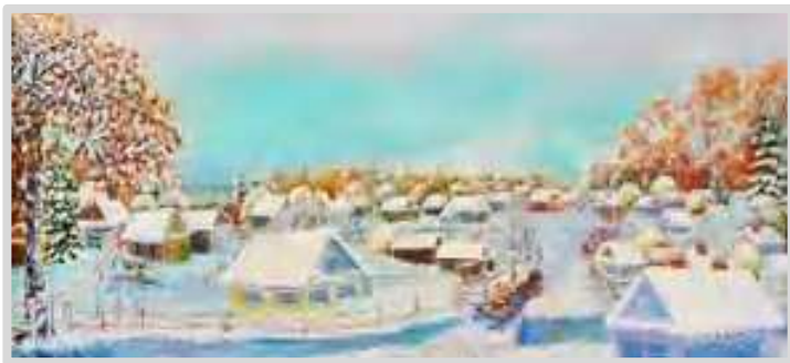
«Лагонешты» Ф. К. Калушевич

Ф. К. Калушевич родился в селение Логанешты в 1926 году, подполковник в отставке, участник Великой Отечественной войны. Создал более 400 художественных произведений (интернет).