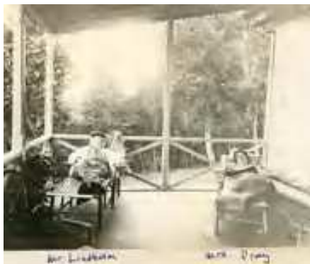
На даче Находка Отто Линдгольм и Элеонора Прей

В архивах музеев остались сотни фотографий, запечатлевших отдельные моменты из жизни семьи Линдгольмов. В хозяйственной деятельности О.Линдгольма была государственная лицензия на разработку золотоносных месторождений на острове Аскольд и поселения Находка. До сих пор мы пользуемся названиями окружающих город Находка поселков – Золотари и Приисковый.