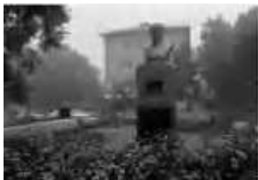
Бюст Ш.Г. Надибаидзе в Ливадии

В 1978 году на здании управления рыбокомбината установлена мемориальная доска, на которой написано: «База сейнерного флота имени Шалвы Надибаидзе (бывший рыбокомбинат «Тафуин») основана в 1925 году» .