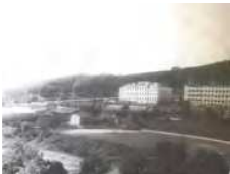
Общий вид отряда (В/Ч 2020) 1970-1972г.

В зону ответственности 62-го ПоГО вошли участки советско-маньчжурской границы по устью реки Суйфун до мыса Хой. В состав отряда вошел морской погранично-пропускной пункт «Находка».