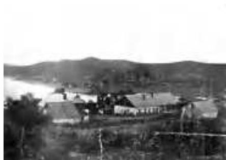
Бухта Гайдамак, 1912г. Справа-школа юнг, слева- дом графа Г.Г. Кейзерлингга (из книги Р.В. Кейзерлингга)

Бухта Гайдамак с ее постройками на берегу, проложенными дорогами, привлекла в 1911 году переселенцев, основавших недалеко поселок Ливадию.