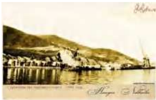
Строительство Торгового порта. 1948г.

17 июня 1947 года Совет министров СССР принял постановление «Об организации порта в бухте Находка». Именно эта дата является днем основания порта.