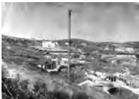
Посёлок Тафуин в 40-е годы