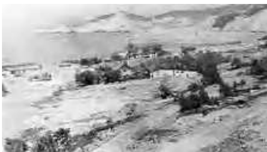
Стройплощадка порта на мысе Астафьева, 1960-е гг.

Находкинский торговый порт стал хозяйствующей единицей, вошедшей в систему управления Госморпароходства в подчинении отдела портов при Дальневосточном пароходстве. Тем не менее, до сдачи в эксплуатацию первой очереди порта в 1947 году, на берегах бухты Находка продолжал действовать портовый пункт.