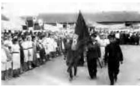
Вручение переходящего Красного Знамени Государственного Комитета Оборона рыбокомбинату Тафуин. 9 августа 1942.