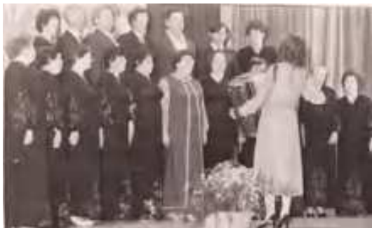
Заводской хор в 1986 г.