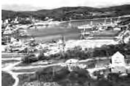
Гавань Гайдамак, ГСРЗ, 2007 г.

Кроме рыбопромысловой деятельности, здесь занялись строительством судов прибрежного лова по проектам, разработанным в своем конструкторском бюро. Малые траулеры серии «МТ», рыболовные боты «ДРБ» имеют хорошие мореходные качества, экономичны на промысле. В целом за время своего существования организация спустила со стапелей 84 новых судна.